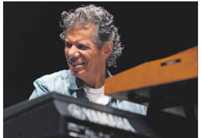
Chick Corea ennyi év után is jelenség a színpadon

A vastappsal visszahívott zenészek legalább negyed órára ráadásul búcsúztak: Rodrigo híres Concierto de Aranjuezének Ada-