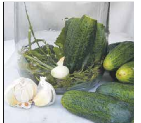
Igazi nyári csemege a kovászos uborka

nap mindenütt egyenletesen érje. Ha megérett – a leve tejszíni és zavaros, kovászos ízü és illatú lett – kidobjuk a kenyeret a tetejéről, leöntjük a levét. A megkovászolt uborkákat és cukkiniket jól záródó edénybe vagy üvegekbe szedjük át, rászűrjük a levét, lezárjuk, és hideg helyre (legjobb, ha hűtőszekrénybe) állítjuk. Így több napig eltartható.