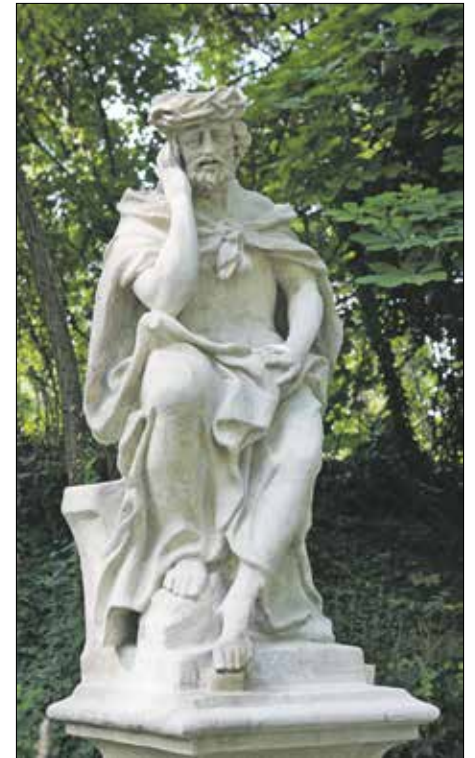
Felújítás után újra a régi helyén áll a szobor

a szobor és a posztamens belsejébe. Az alkotás olyan mészkből készült, ami ellenáll az időnek, de azért hamarosan egy hidrofobizáló bevonata is lesz, amely az eső ellen óvja majd. A talajmenti fagyoktól