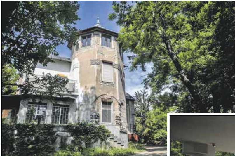
Egy éve még meglehetősen romos állapotban volt

A rendszerváltást követően sokáig üresen állt az egykori villa, majd az önkormányzat új funkciót talált az erősen leromlott állagú háznak. A Norma-fa-rehabilitáció részeként a terület központi infor-