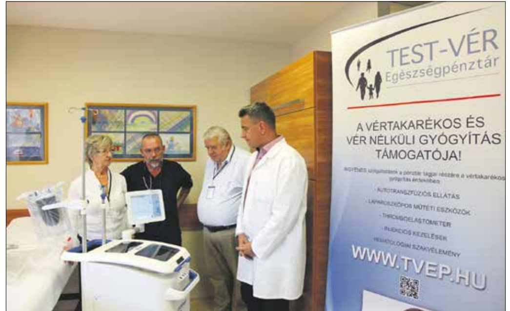
A sejtmentő készüléket a TEST-VÉR Egészségpénztár adta át használatra a gerincgyógyászati központnak

„A húsz évvel ezelőtt magánszemélyek által alapított, ma már több