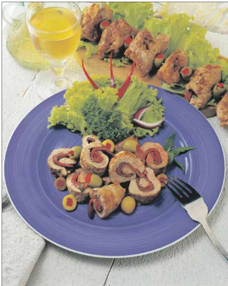
A szűztekercsek mellé kizárólag friss, nyers zöldségeket, salátákat fogyasszunk!

Egy jól behűtött őzgerincformát kibélelünk megnedvesített celofánnal, és egy kevés (kb. fél deci) zselatinos levet öntünk bele. Derméni hagyjuk, azután rétegezve vagy összekeverve beletöltjük a zöldségeket. Ráöntjük a maradék zselatinos levet, és hűtőszekrényben kocsonyásodni hagyjuk. Tálaláskor deszkára borítjuk, lehúzzuk róla a celofánt, majd forró vízbe mártott késsel felszeleteljük.