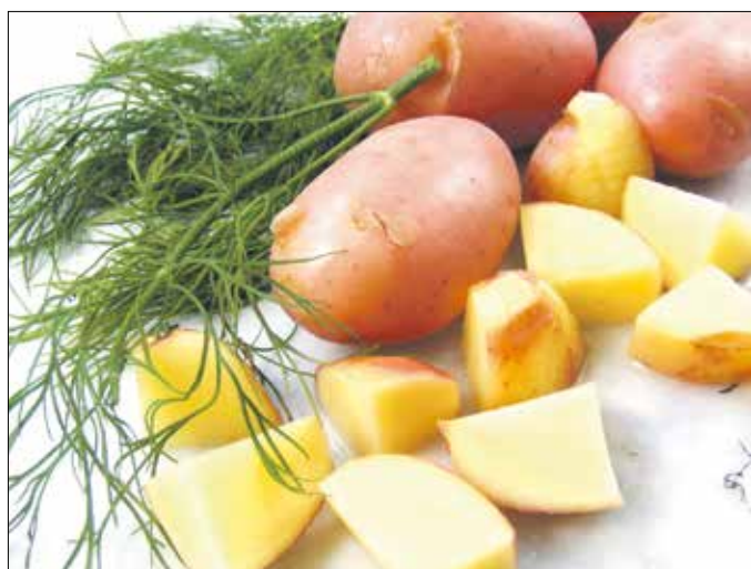
A hideg újkrumplileves hozzávalói

2 kiskanál liszt 1 csokor kapor 1 dl tejföl 1-2 evőkanál fehérborecet