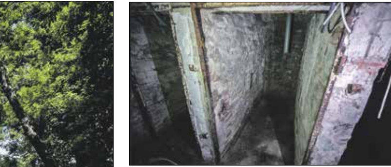
Embertelen körülmények uralkodtak a börtönpincékben

Bár az emberek zöme tudta, hogy az ÁVH-sok azért biztosra mentek. Fedőtevékenységként az udvaron, egy lampionos kerthelyiségben mulató üzemelt. A civil vendégek közelében tehát foglyokat kínoztak, szenvedésük hangjait pedig talán éppen a vidám zene nyomta el... A vallatásokat túlélő foglyok később a nyolcszögletű vallatószoza alapján tudták beazonosítani a helyszínt.