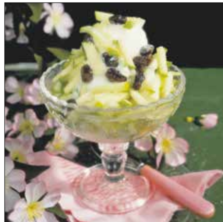
Könnyen és gyorsan elkészíthető desszert

4 szép zöldalma 1 kezeletlen citrom leve és lereszelt héja 5 dkg kristálycukor késhegynyi frissen reszelt gyömbér körömnnyi fahéj só 9 g zselatinpor