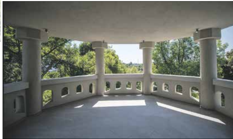
Egykor vállaltóhely volt, ma kilátótorony

emelt kézzel mutogatta az igazolványát, hogy ő semmi rosszat nem tett. Az is látszik, hogy a torony tetején lévő egykori kilátóterasz ekkor már zárt volt, pár ablakkal, de azokat is eltakarták a vallatósok idejére. Az ÁVH 1956-os megszüntetésével a titkos börtön-épület pincéit igyekeztek elfalazni, a villában lakásokat alakított-