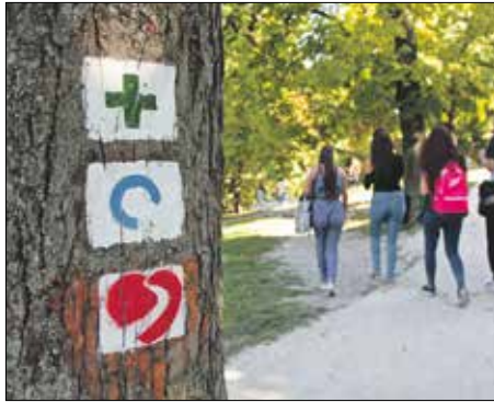
Szív alakú jelzés segíti a tájékozódást

A pulzusértékeket a kiindulóponttól elvihető túralapra lehet feljegyezni, majd a kör végén egy zárt gyűjtőládába dobni. Az adatokat szakemberek értékelik ki a Budapesti Szent Ferenc Kórházban. Amennyiben olyan eltérést látnak, ami orvosi vizsgálatot vagy konzultációt igényel, a megadott telefonszámon, e-mail-címen felveszik a kapcsolatot az érintettel, és előjegyzik kardiológiai szakrendelésre. Az intézmény tapasztalatai alapján a vezetett túrákon megjelenők három százalékánál derül ki, hogy betegek, és invazív beavatkozásra – koszorúér-tágításra, szív-műtetre, pacemakerbeültetésre – van szükségük.