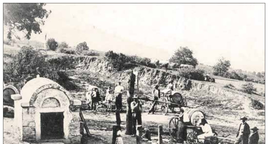
Vízfordók a Városkútnál az 1860-as években, amikor már divatos nyaralóhely volt a Svábhegy és környéke

A gyógyintézet 1837. május 7-én nyílt meg a Svábhegyen. Ez volt az első kísérlet szanatórium létrejöttére a környéken. A „savógyógymód”, amit Szuhányi doktor alkalmazott, egyszerű tejkúra volt, a friss levegő kitűnő hatásai-