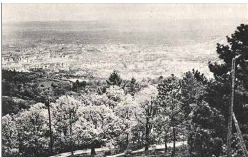
Kilátás a Svábhegyről

A Svábhegy különleges klímájának gyógyító ereje már a 19. században ismertté vált. Azt, hogy itt kellene létrehozni csábító nyaraló-gyógyintézetet, Szuhányi doktor vetette fel, és egy vállalkozóval összehozva a gyógy-savóintézetet létesített valahol a Városkút környékén. Merész, főként kockázatos vállalkozás volt ez 1837-ben, amikor a Svábhegy épp csak kezdett divatba jönni.