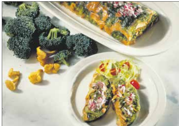
Kánikulai kocsonya? Létezik!

– a szárát eltesszük más étel készítéséhez –, a gombát nagyobb cikkekre vágjuk. A brokkolit enyhén sós vízben 4 percre forraljuk, majd hozzáadjuk a gombát, és még kb. 6 percre főzzük. Leszűrve hűlni hagyjuk.