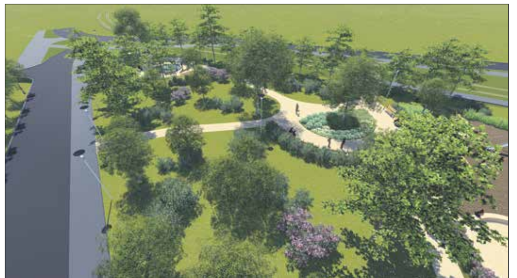
Detre László, Eötvös Loránd vagy Glück Frigyes park? A hegyvidékiek dönthetnek, mi legyen az új közterület neve

Az év egyik legjelentősebb közterületi fejlesztése kezdődött meg a Szendrő utcában, ahol mintegy 380 méter hosszúságban újul meg az úttest. A szőnyegezés során 2300 négyzetméteren aszfaltolnak, egy korábbi közműépítés helyén pedig a pályaszerkezetet is kicserélik a kivitelezők. Ez utóbbinak technológiai okai vannak, az utólagos bontás után ugyanis nehéz elérni a Hegyvidéken szükséges talajtömörséget. Ha ez nem