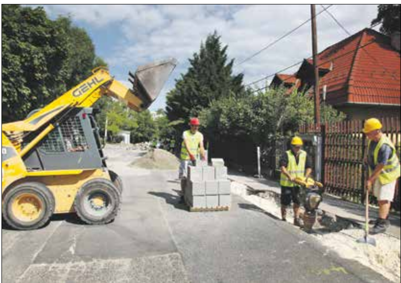
Várhatóan szeptember végére fejezik be a kivitelezők a Szendrő utca felújítását