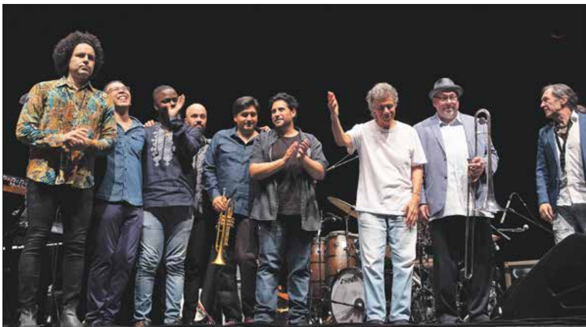
A „spanyol szívu banda” nevéhez méltó latinos, vérpezsdítő zenével varázsolta el magyar rajongóit