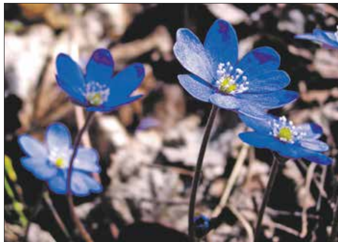
A védett növény rendszerint a tél végén, az első hóvirágok után nyílik

Három ritkaság közül választhatja ki a közönség az év vadvirágát a tavalyi év végi szavazáson. A meleg homoktalajokon virító báránypirosító és a nyílt sziklagyepeket díszítő kövér daravirág nem volt „ellenfél” a májvirággal szemben, a két másik összesen nem kapott annyi szavazatot, mint a győztes. Persze, ez nem azt jelenti, hogy azok a növények ne lennének a hazai flóra értékes kincsei, egyszerűen arról lehet szó, hogy a kirándulók szeme elé ritkán kerülő