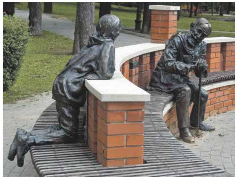
A Jókai-agora a Diana parkban

Ha belépünk az Operaház művészbejáróján, és balra fordulunk, meglátunk egy folyosót. Oda festették az elhunyt énekesek arc-