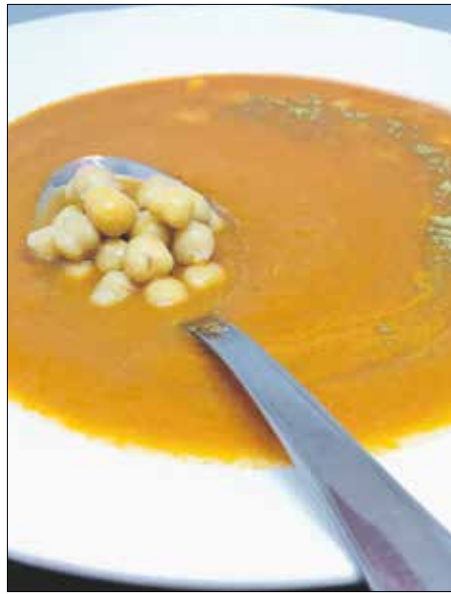
A csicseriborsónak alacsony a kalóriatartalma

a napraforgómagot egy tiszta serpenyőbe, hogy közepes lángon, körülbelül 1-2 perc alatt, sűrű kavargatás közepette megpiríthassuk. Vágyjuk fel kockákra az almát,