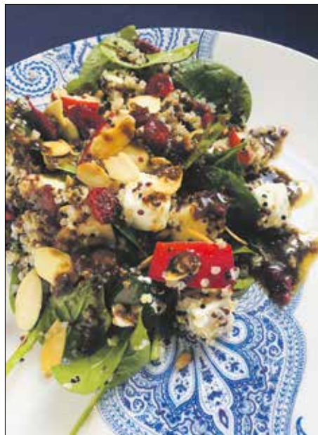
Előételként, köretként is kitélő

A quinoát főzzük meg az alaplében vagy vízben. Mindeközben dobjuk a szeletelt mandulát és