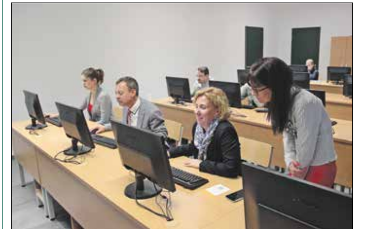
A sajtótájékoztató résztvevői is tesztelték tudásukat

A sikeresen, legalább 80 százalékosan szereplő fiatalok névre szóló tanúsítványt kapnak, a legeredményesebb iskolák között pedig ajándécsomagokat sorsol-