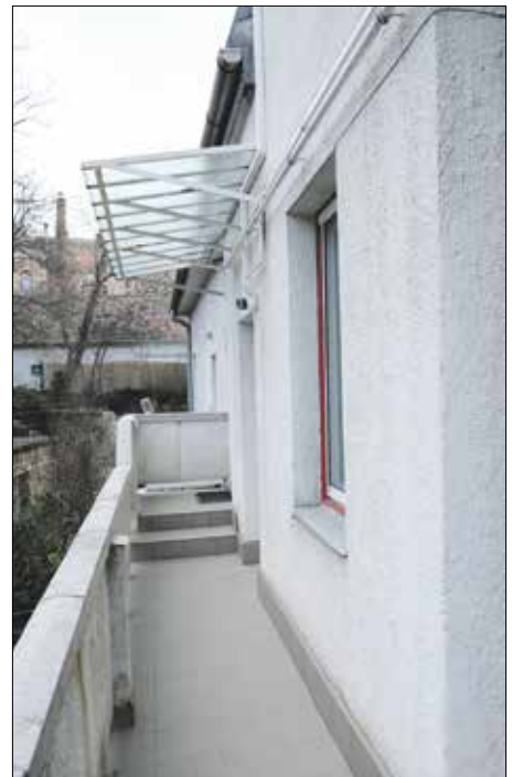
A függőfolyosó és az erkély szigetelésére, burkolására kapott pénzt a Költő utca 6. alatti ház

A legutóbbi vis maior pályázat-hoz hasonlóan most is a gázalavezeték felújítása vagy cseréje volt a „sláger”, ezekhez kilenc lakóközösség kért segítséget. Visszatérő problémáról van szó, hiszen a közterületi gázvezetékek felújítását követő kötelező nyomáspróbán a hálózathoz csatlakozó lakóházak régi típusú vezetékai rendszerint megbuknak a nyomáspróbán. Ilyenkor, az életveszélyes helyzet