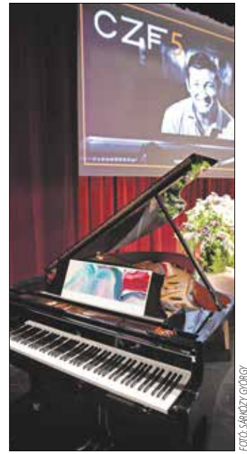
A Steinway új zongorája, a Spirio

A kivetítő „varázsvásznán” Paul Klee festményei jelentek meg, amelyekről a gyerekek bátran elmondták véleményüket, érzéseiket. Az elhangzó zenei illusztrációk (Farkas Ferenc: Kőbéka, Saint-Saëns: