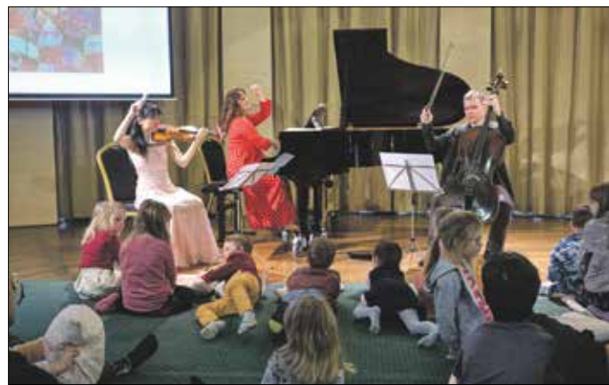
A hangszerbemutató arról is szól, hogy a gyerekek megkedveljék a zenét