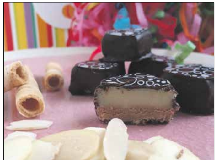
Jót tesz a bonbonnak, ha néhány napig állni hagyjuk pléhdobozban

A tésztához 1 egész tojást és 7 tojás sárgáját habosra verünk a porcukorral és a reszelt narancshéjjal. Hozzáadjuk a narancsok levét és egy facsarányi citromot, majd a mandulát és a kemény hab-