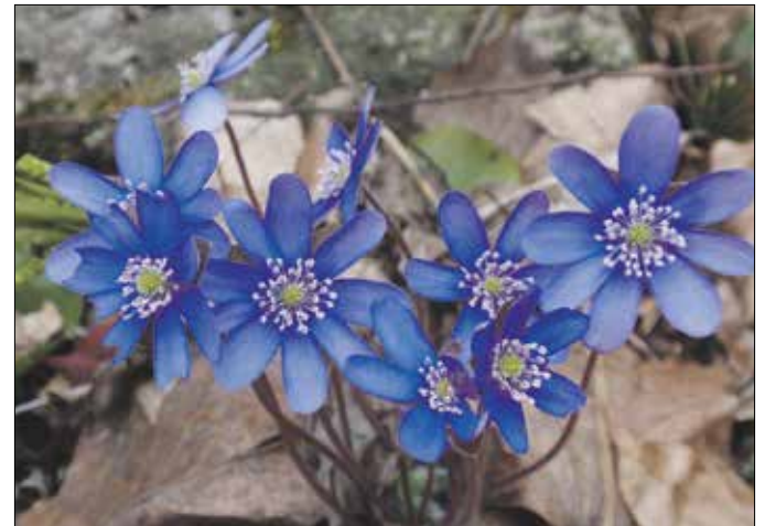
Árnyéktűrése és korai virágzása miatt helye lehet a díszkertekben is

zépén elhelyezkedő porzókra. Ez a kombináció – főképpen a kevés konkurens virág miatt – különösen vonzó a nektárra éhes rovarok