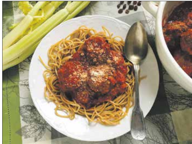
Pompás itáliai lakoma

A csicseriborsót leöblítjük, és friss vízben tesszük fel főni két átréselt fokhagymagerezd és egy rozsmaringág társaságában. Lassú tűzön puhára főzzük a szemeket, sózzuk, borsozzuk, a rozsmaringágot kidobjuk, és kiemelünk egy jó merőkanálnyi csicseriborsót. Külön serpenyőben kevés olívaolajon aranyárgára pirítunk két összetört fokhagymagerezdet, hozzáadjuk a szardellát, a paradicsomot, az őrölt erős paprikát, meghintjük finomra metélt rozsmaringgal, egyet buggyantunk rajta, majd az egészet a csicseriborsóhoz öntjük. Botmixerrel homogénre pürésítjük, majd visszatesz-