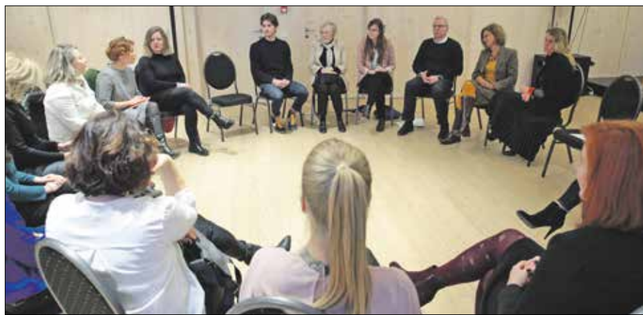
A hegyvidéki soroptimisták szeretnék segíteni a hozzájuk forduló diákokat álmaik megvalósításában