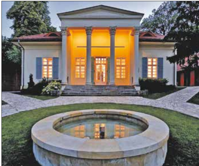
A felújított Barabás-villa