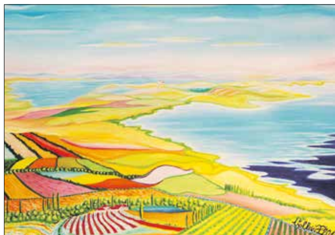
Tihany látképe az aszfófi hegyről

Vollein Ferenc festményeit szakértők az avantgárd naiv reneszánsz iskolájához sorolják. Ő maga úgy látja, művészete egyfajta játék, amelyben igazán megtalálja önmagát. Első, 2015-ös tanulmányúrtját követően több alka-