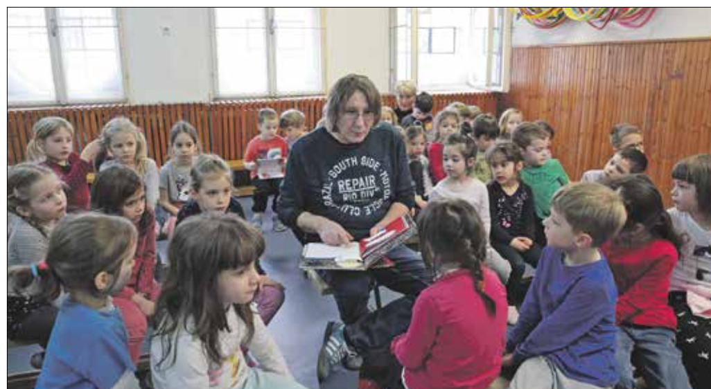
Kiss Ottó költő kalauzolta a mesék csodálatos birodalmába a Városmajor Óvodába járó gyerekeket

mába a kicsiket. Elmondta, hogy Gyuláról érkezett, ott írja a verseket, regényeket. Amikor megjelenik egy verseskötete, sokszor megjelenésük, és elkezdik énekelni, aztán vannak olyan versek, amelyekből rövid rajzfilmek készülnek, ahogyan például a Régi kincsek című kötet költeményeiből is.