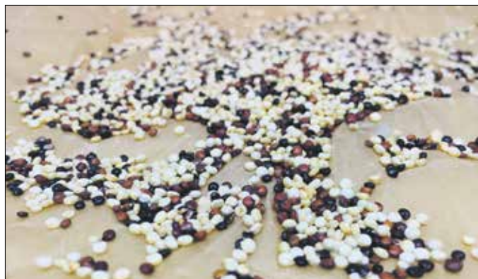
A quinoa fogyasztása fenntartja az energiaszintet, gátolja az elhízást

Minden előítéletünket megcáfolva a parajok és a céklafélék családjába tartozik, a finnyás Európá-