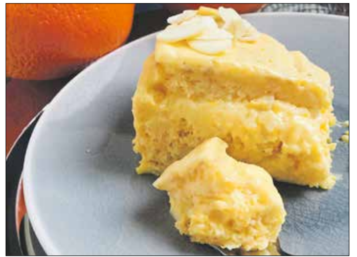
Sok-sok tojássárgája és gyümölcs – így az igazi a narancsos mandulatorta!

1,5 kg paradicsom 10 dkg pancetta ½ csokor petrezselyem 1 hagyma 1 zellerszár 1 sárgarépa 1 gerezd fokhagyma só, bors olívaolaj