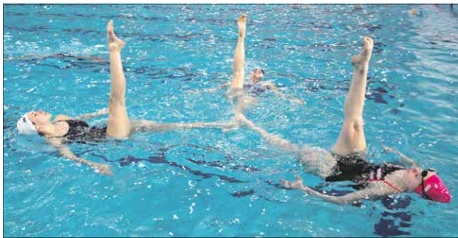
A SYNUS SC edzéslehetőségeiről, tanfolyamairól személyesen a MOM Sport Uszoda recepcióján, vagy a +36-30/953-7197, +36-30/397-5650 telefonszámokon és a synus.szinkron@gmail.com e-mail címen lehet érdeklődni.