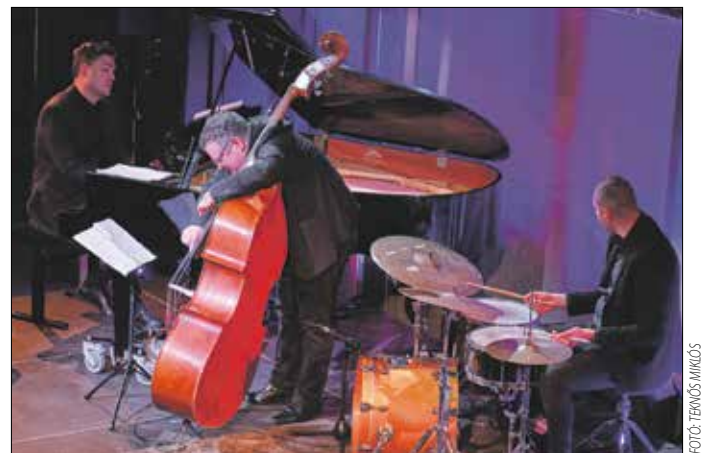
A Jazzical Trio a Lóvasút rendezvényközpontban adott koncertet

Az idén kis jubileumát ünneplő, ötödik Cziffra György Fesztivál már tavaly megkezdődött. Cziffra György születésnapján, november 5-én a világhírű orosz zongoraművész, Jevgenyij Kiszin a fesztivál névadója előtt tisztelegett szólókoncertjével a Műpában. Ugyanazon