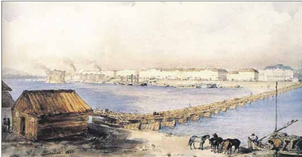
Hajóhid 1843-ban Barabás Miklós A pesti dunapart a Lánchíd épülő pillérével című festményén

pestis több százezer ember halálát okozta Magyarországon. Később Mária Terézia megtiltotta a pestistemetők használatát és a templomok köré való temetkezést.