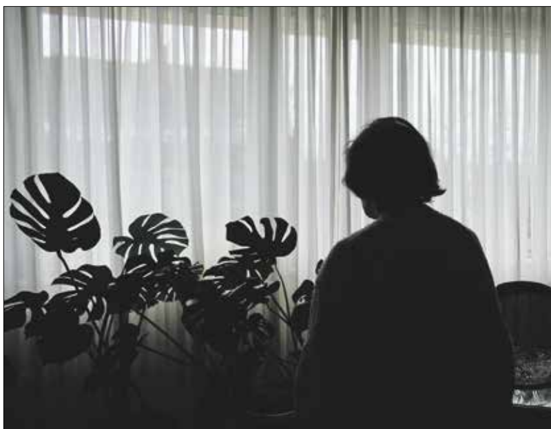
Az idősök az elszigeteltség miatt nehezebb helyzetben vannak, segítségre szorulnak

a megszokott társaságot, így elke-rülhet, hogy elszigetelve, kelepécében érzi magát. Ráadásul idősen az ember nehezebben tud igazodni az új körülményekhez, változtatni a szokásain, megijed. Ezért fontos, hogy a családok és a szomszédok figyeljenek oda főleg az egyedül élő öregekre, betegek. Segítsük őket, hogy tevékeny legyenek, legyen célja a napnak, a hétnek és a hónapnak. A megnyugtató szavak is nélkülözhetetlenek. De az idősök mellett ne feledkezzünk meg a gy-