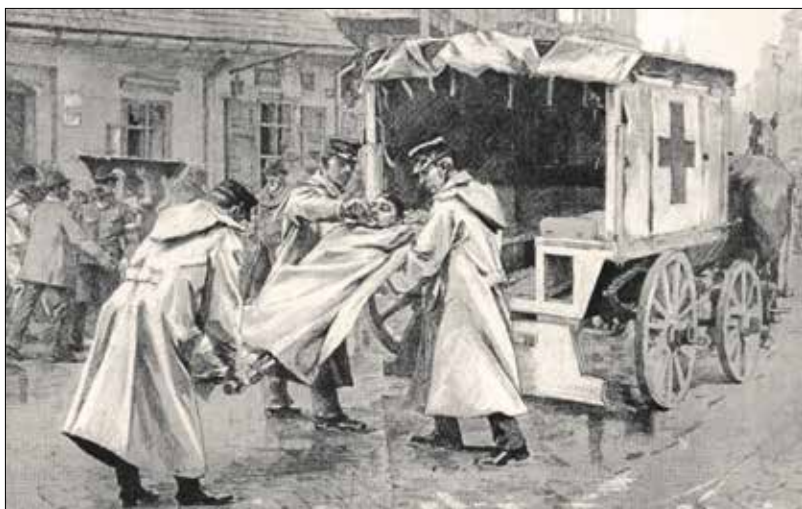
Kolerás beteget tesznek fel a Vöröskereszt Egylet kocsijára 1892-ben

A középkortól kezdve a nagyobb városok mindig is kedvező terepei voltak a ragályok terjedésének, a zsúfoltság, a kosz, az állatok bűze folyamatosan mérgezte ezeket a központi helyeket. A pestis, a tífusz, a kolera és a különféle influenzák többször megkeserítették a polgárok életét, sokszor jelentős számú emberéletet követeltek.