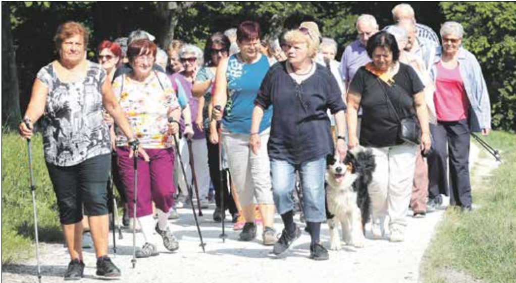
Nyáron már így együtt gyalogolunk újra, ha most otthon maradunk mindannyian

gyaloglódást három lépésben volt csak lelkereje lemondani. – Először azt írtam a Facebook-csoportban, hogy csak az jöjjön, aki nagyon akar. Aztán egy következő üzenetben már azt kértem, az jöjjön, akinek nem kell zsúfolt tömegközlekedést használnia, végül azonban megírtam a számomra legnehezebb, harmadik üzenetet: „ne jöjjenek, min-