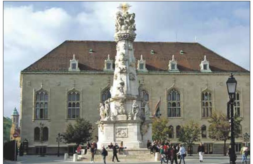
A 17. századi pestis elvonulása után épített Szentháromság-szobor a budai várban

zasztó gyomorgörccsök és bélsikarások kínoznak, amiket én soha életemben nem ismertem; minden anaesthetikus következményekkel egyben. Jó szerencsére épen kinn voltak a Svábhegyen a gyerekeim.