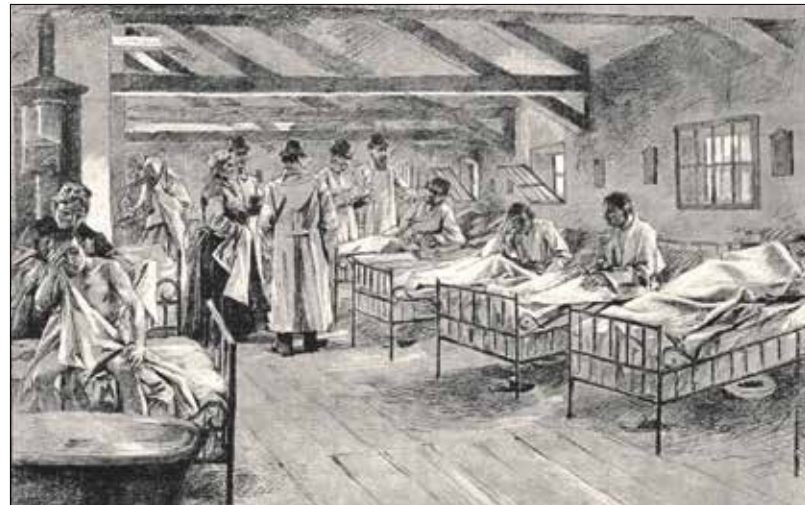
Kolerás betegek a budapesti járványkórházban 1892-ben

A leányom rögtön kúra alá fogott: tüzes só, fodormenta herbaté megtette a maga hatását. Egy pár napig átkozottul éreztem magamat; s az volt a legjobb védelmem, hogy abszolúte nem ettem semmit. Nem is kellett, undorodtam még a kanáltól is, ha megláttam. De hát mi bajom volt nekem? Cholera nem; mert az a Svábhegyen soha sem volt. Influenza sem: mert semmi lázam sem volt mellette. Mai nap aztán röjtötem, hogy mi történt velem! Hát az történt, hogy én mint tudákos kerész, a szőlő-lugasaimat befecskenedtettem a peronospora ellen rézgáliccal. Ebből aztán a lugas mellett levő fügefák is kaptak eleget. Mai nap két érett füget szakítottam le a fáról s azt láttam, hogy azok tele vannak világoskék pontokkal. A görccsö kiderítette, hogy azok a pettyek a rézgálic foltjai. A baj előestéjén én ebből a fügeből ettem. Tehát én saját magam mérgeztem meg magamat rézgáliccal. Ezentúl az érett fügetek elébb megmosatom és megtörültem. Ezt kellett volna tenem előbb, akkor nem harapdáltam volna kínomban a vánkossom csücskjét.” (Pesti Hírlap, 1893. 09. 03.)