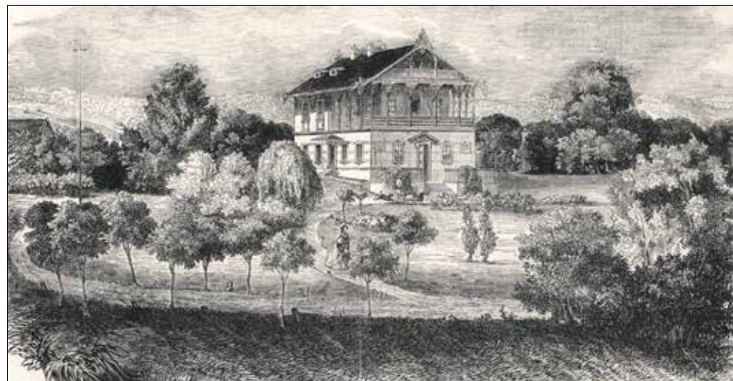
Svábhegyi nyári lak az 1850-es években

lakókat, midőn Pesten a legnagyobb erővel dühöngött a járvány, semmi baj sem érte; itt nem volt kolera, sem hagymáz, itt nem haraguszna az emberek egymásra, itt még csak nem is politizálnak, annyira egészséges mindenki. Tavaly egy derek emberbarát a nyári lakosság kedvéért