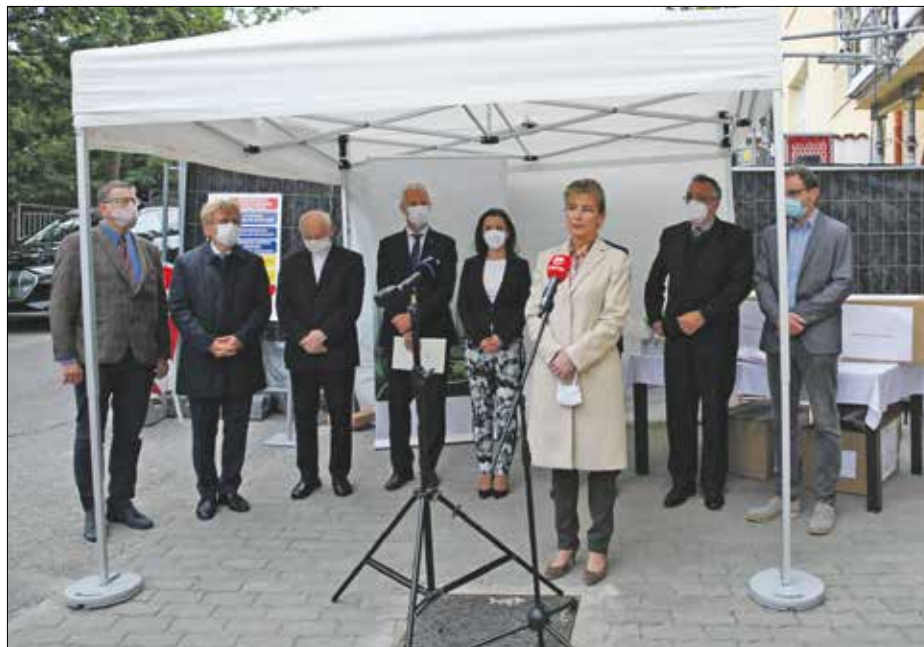
Herczegh Anita, a köztársasági elnök felesége köszöntötte az ápolókat

ja. – A koronavírus-járvány idején, amikor látogatási tilalom van a kórházakban, az ápolók azok, akik folyamatosan a betegek mellett vannak. Nem csak az eddigi nélkülözhetetlen tevékenységüket végzik, hiszen a látogatási tilalom miatt most a hozzátartozókat, a gyerekeket, unokákat is nekik kell helyettesíteniük. Ez különösen nagy felelősség, mert rövid idő alatt kell megismerniük