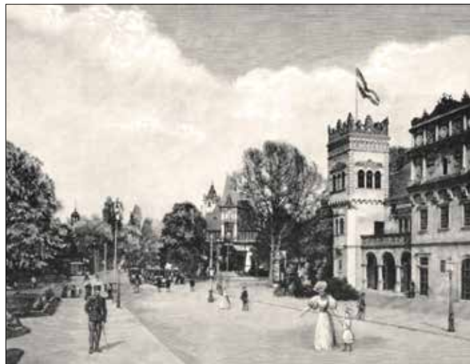
Korabeli grafikák az ezredévi kiállításról (Vasárnapi Ujság, 1896)

Valószínűleg e könyvének köszönhetően, hogy az Országos Magyar Kertészeti Egyesület a tiszteletbeli tagjává választotta 1896-ban. Ugyanebben az esztendőben az ezredévi kiállításon történt, hogy Ferenc József király megszó-