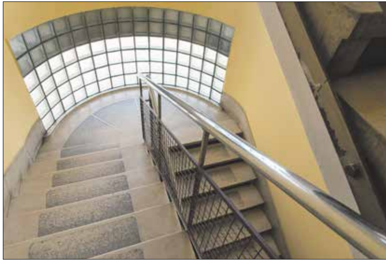
Az épület közepén helyezkedik el a lépcsőház

házat. Újítás ez, mivel ezideig Budapesten a lakásból ki kellett menni az utcára – esetleg esernyővel – és az utcáról volt a garázs elérhető. Biz-