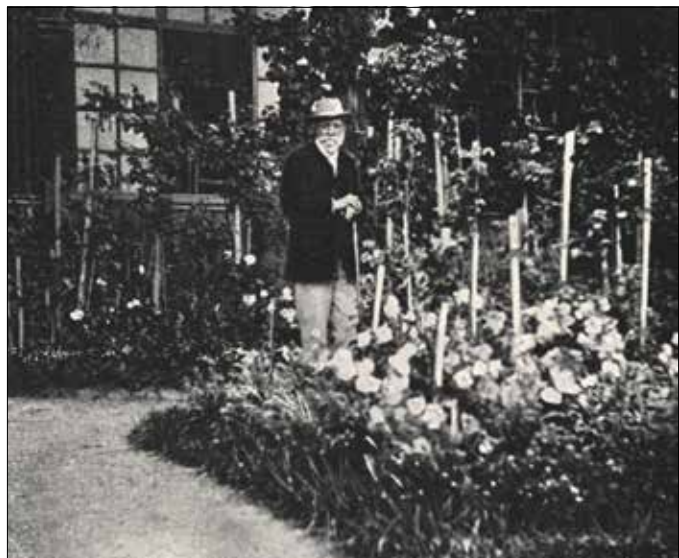
Jókai Mór mintagyümölcsössé tette svábhegyi kertjét

lította Jókait, csodálkozva, hogy ő is jelen van. Az emberek ugyanis el sem tudták elképzelni, hogy egy ekkora író pályafutása csúcsán ilyesmivel foglalkozzon, és standja legyen egy gyümölcskiállításon. Ahol egyébként a Lielgel vajkörtéjét és a Jodoigne diadalmát körtéjét mutatta be.