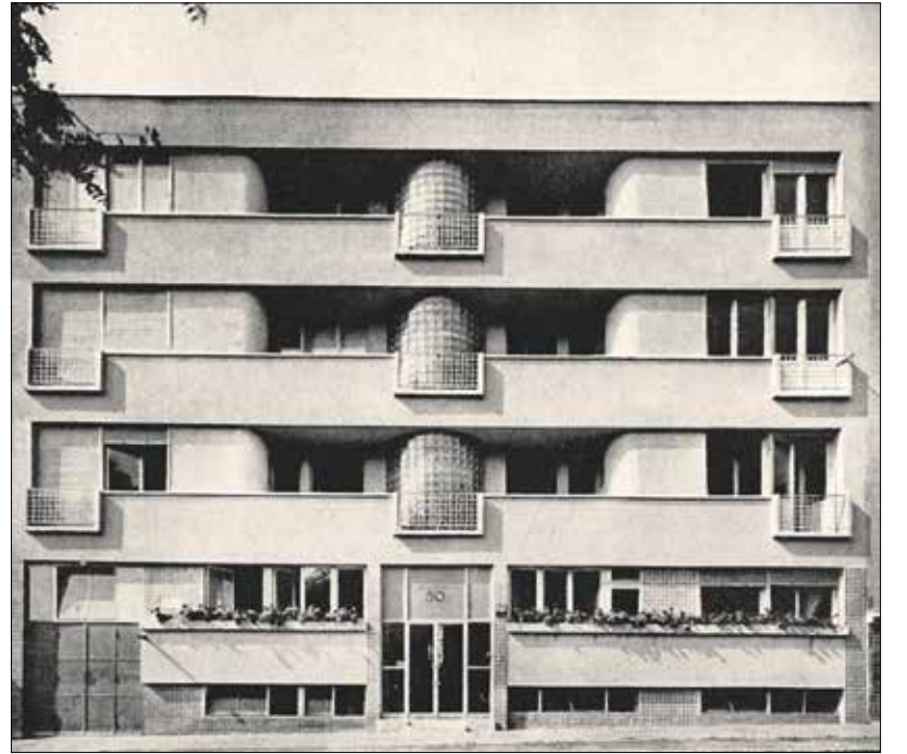
„Az épületen egy új életszellem nyilvánul meg: egyszerű, derűs élet keresése”

Az épület megjelenése a belsők tökéletes kifejezője, az utcai homlokzat az adottságok következménye, a lépcsőház üveghengerfelülete, a konyhák kis nyitott erkélyei, árnyékokban gazdag plasztikus hatást biztosítanak. A falfelületek fehér és kék sávokozás derűsíti az utcai homlokzattal. Az udvar sárgás homlokzattal tágas erkélyeket – osztják és nem tagolják, mert rendet, egyszerűséget és áttekinthetőséget kerestek a tervezők, nem pedig azt a híres tagolt mozgalmaságot, amely 20–30 év előtt divatozott, azzal az eredménnyel, hogy a tájkozatlan utód azt vélheti: mivel a ház minden ablaka más formájú és más arányú, azokat az építető bontási anyagkereskedőknél vásárolta