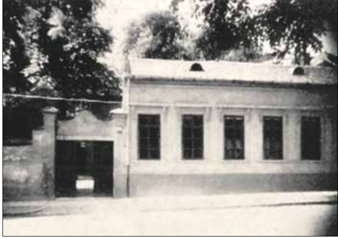
A régi ház, amelynek a helyére háromemeletes bérház épült

A három fivér közül Vilmos (1851–1926) ügyvéd lett, Gusztáv kormányfőtanácsos (1853–1935) és Henrik kereskedelmi főtanácsos (1855–1937) pedig a Hoff-