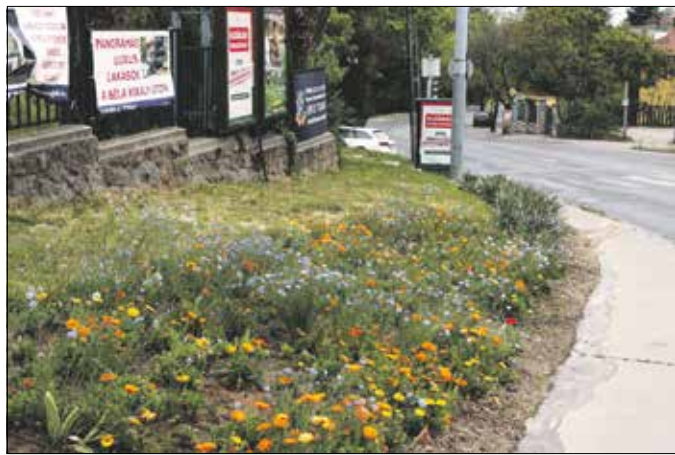
Áttelelt körömvirágok a Szent Orbán téren