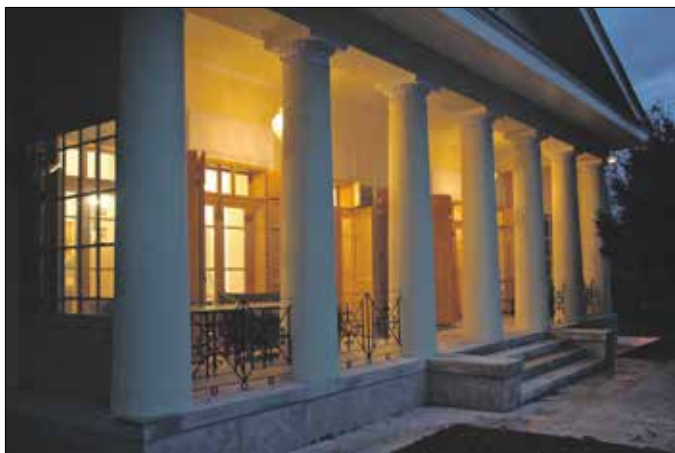
Az Óra-villa Görgői Artúr egyik főhadiszállása volt 1849 tavaszán

valamilyen módon rávenni az embereket, nézzenek körül, és segítsenek abban, hogy minél több emlékhelyet lehessen rendbe hozni. Az első adást még 43 követte, Magyarország mellett tíz olyan országban is forgattunk, ahol 1848–49