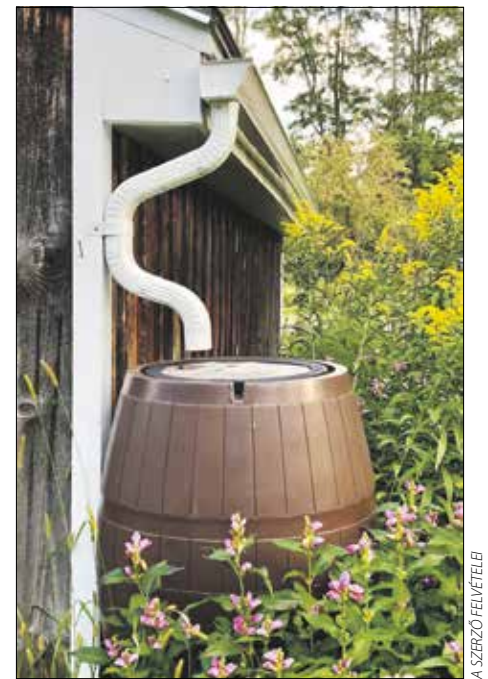
Bármilyen méretű edényben gyűjtögethetünk

hasznosítása. A Hegyvidéki Zöld Iroda a KEHOP 5.4.1-Energiatakarékos Hegyvidék program keretében is szeretné felhívni a