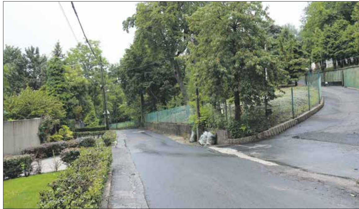
Mindenfajta közlekedést lehetetlenné tenné a többszörösére növekvő forgalom

letének augusztus végi megnyitóját, hogy azt egyáltalán nem használhatja iskolaként, így pedig megteveszti az oda jelentkező gyerekek szüleit. Erről az önkormányzat már tájékoztatta a magániskolák működését engedélyező és felügyelő állami szervet.