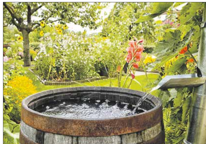
A hatékony vízgyűjtők komoly beruházást igényelnek, de megtérülnek

gyűjtési módszer alkalmazható a házunkban. A legösszetettebbek és leghatékonyabbak komoly – de végül megtérülő – beruházást igényelnek, és érdemes ezeket már a ház építésekor betervezni.