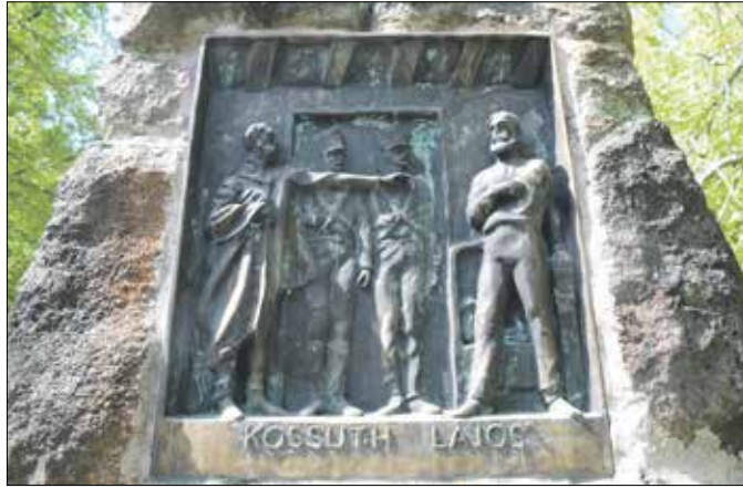
Dombormű a zugligeti Kossuth-szobor talapzatán

– A tévésorozat sajnálatos módon 2002-ben véget ért, de Katona Tamással egyetértettünk abban, hogy a megszerzett tudást jó lenne