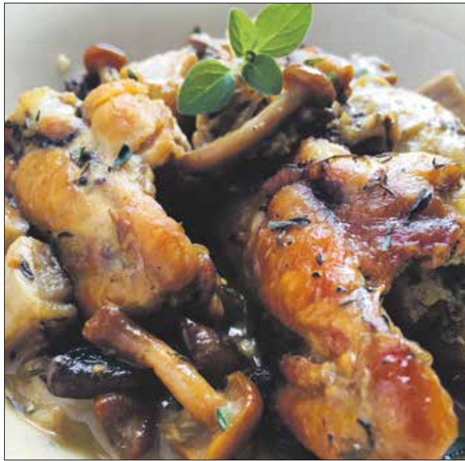
A gombás csirkeszárnyat a legjobb tárcsán, tűz fölött elkészíteni

féltartós tejjel, és egy kis formába öntve eltesszük a mélyhűtőbe. Így szaporítottuk, és jóval alacsonyabb zsírtartalmúvá is tettük, amely trükköt a fogyókúrások figyelmébe ajánljuk... A felbon-