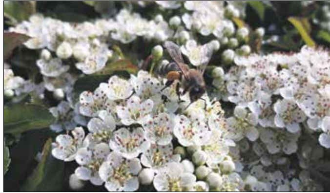
Akár több kilométerre a kaptártól is gyűjtögetnek a méhek

künk, megfáradt városi embereknek nyújtanak rekreációs élményt és felüdülést, de a méhek is megtalálják a virágpontot. Ezenkívül az