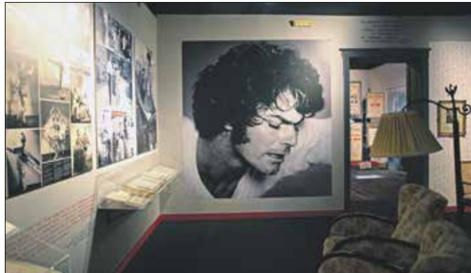
A Róna Viktorról készült kiállítás egy részlete

elemeket felvonultató, a táncművész életútját bemutató tárlat látható most négy teremben. Róna személye kivételes módon nem csupán, sőt, nem elsősorban művészi kvalitásai miatt izgalmas. A gyenge adottságokkal induló, ám roppant cél- és öntudatos kislány útja a világ leghíresebb balettszínházai meghódításáig, varázslattal felérő, pá-