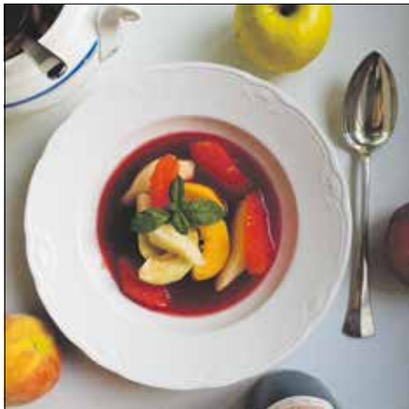
Kiváló frissítő nyáron