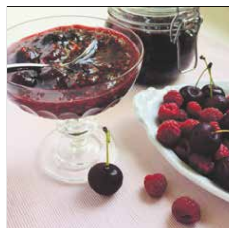
Meggy, málna: pompás páros!

A kettő viszont, ha összeházasítjuk őket, csodálatos elegyet alkot, hiszen sem túl savanykás, sem túl édes, darabos, mégis pépes lesz a végeredmény. S persze ez a fajta szinkeverés is jól tesz a spájzpolcok hangulatának. Az egyetlen dolog, amire figyelni kell, az időzítés. Legyünk résen, hogy a meggy még, a málna már érjen, amikor befőzésre adjuk a fejünket. Nem lesz sok időnk!