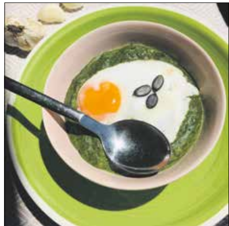
A mángold méltatlanul hanyagolt „kincsünk”

Én épp a nagy nyár eleji leolvastásnál találtam rá egy ilyen „tégla” aranytalálékra, ebből született ez a spenőtnél markánsabb ízű, harsányzöld püré, amelynek a tökmagolaj még teltebb ízeket kölcsönzött, a beleszórt pirított tökmagszemek pedig izgalmasabbá tették a textúráját. Egy kevés alaplével kissé hígabbra is készíthetjük, el tudom képzelni, hogy kiváló krémleves lenne belőle.