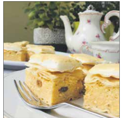
Csemege a túrós sütik kedvelőinek

Nagyon hasonlóan készül a vargabéleshez, de itt a tojásfehérjét cukorral verjük fel, és nem keverjük a töltelékbe, hanem a sütemény tetejére halmozzuk. A túrós sütik kedvelői nem hagyhatják ki!