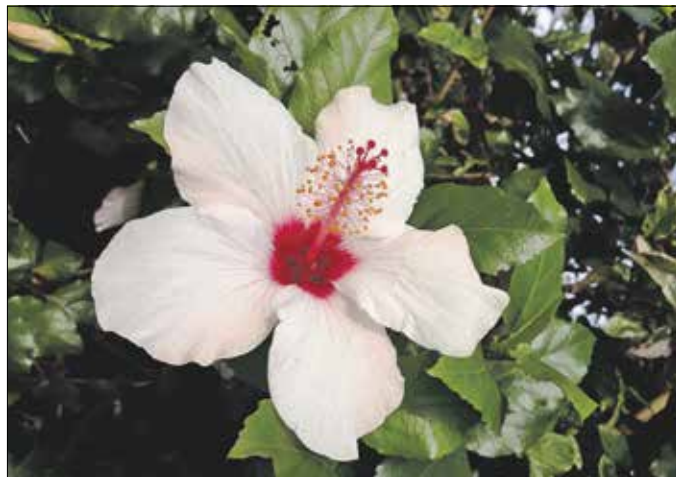
Különlegesen szép virágú és sokoldalúan hasznos növény

A szabadba költöztetés előtt érdemes átültetni a tövet, és alaposan visszavágni. A szép sötétzöld leveleket nem kell féltetni,