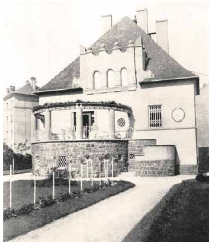
„...mosolyog a kis fehér ház a kavicsos kert közepén” (1928)

Ödön színészhez, tőle kapta vezetéknévét. Nevelőapja társulatával vidéki vándorlás, „kocsiszínek, kocsmák, daltársulatok, az ősi ripacsok társasága” határozta meg kamaszkorát.