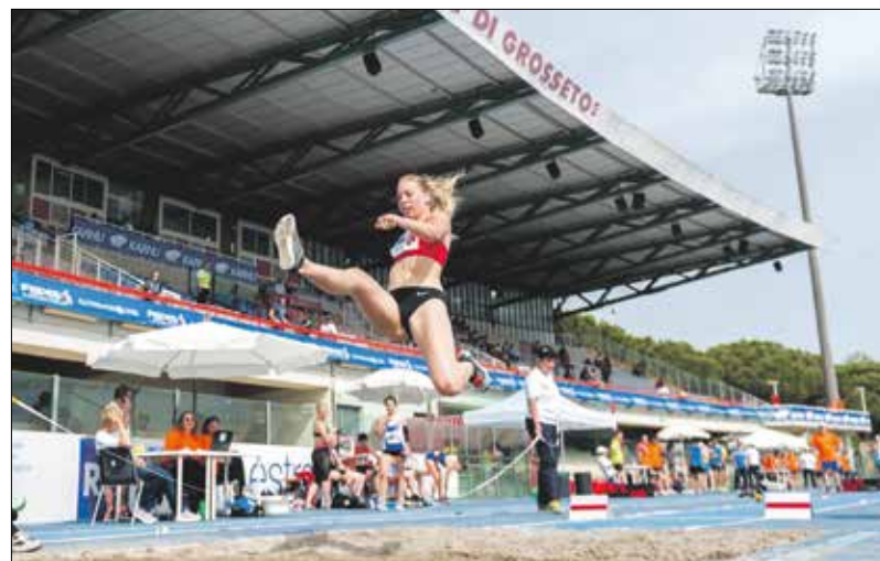
A távolugrás a kedvenc versenyszáma, ő tartja a világcsúcsot a paraatléták között

enyhítették, egy hónapot Budapesten töltöttem, mert áttérünk a technikai edzésekre, és ezt szerettem volna az edzőmmel közösen végigcsinálni. Végig kapcsolatban álltunk, megkaptam tőle az edzéstervet a gyorsasági és állóképességi tréningekhez. Aztán visszamentem tanulni Szombathelyre, de most lehetőséget kaptam a TE-től, hogy ismét a fővárosban lehessenek, így nyáron már itt tudok készülni.