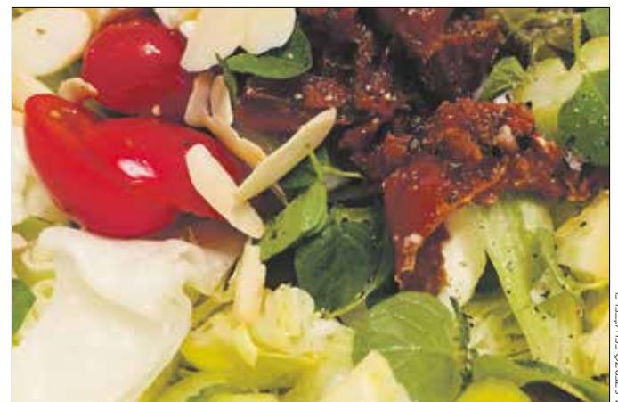
A kecskesajt az egészséges étrend kiemelkedő kiegészítője