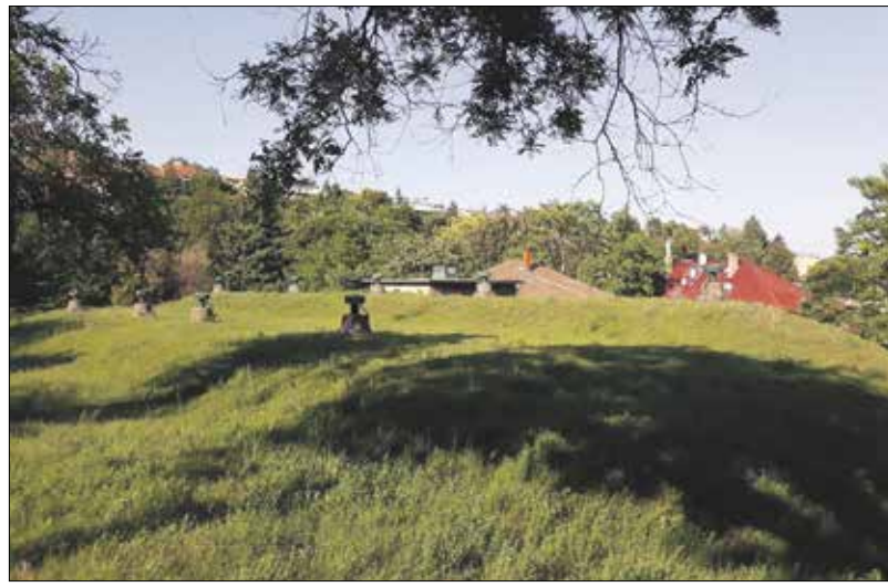
Úgy is kifejezetten vonzó a terület összképe, hogy a tulajdonos nem nyírja sűrűn a fűvet

Így vált nyilvánvalóvá, hogy ha a vízművek ingatlanjain a fű nincs sűrűn nyírva, a terület összképe nem feltétlenül válik rendezetlenebbé, sőt a megjelenő virágok kifejezetten vonzó képet eredményeznek. Azaz: a tulajdonos cég általános megítélését nem rontja, ha a kerületben átnéve az emberek a nyírt