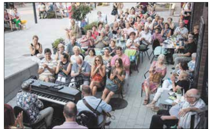
A Hegyvidéki Kulturális Szalon közönsége is válogathat a programok között

– A világon számos olyan tér és helyszín van, ahová azért helyeznek ki hangszereket, hogy bárki játszhasson rajtuk. Innen jött az ötlet, hogy olyan zenei eszközöket készítsenek, amelyek félleg-meddig játékszerek is. A Zenélő Budapest részeként három helyszínen, a Millenáris Parkban, a Várkert Bazárban és a Hegyvidéki Kulturális Szalon teraszán is ki