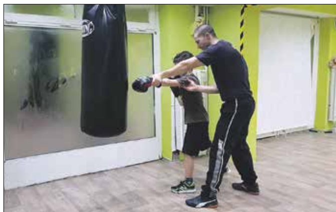
Gyerekekkel is foglalkozik a Demeter boksiskola

túraútvonal teljesítése közben játékos sportvetélkedőkön vesznek részt a próbázók, akikre a körút végén közös interaktív edzések várnak. Különböző küzdősportágakat lehet majd kipróbálni, a