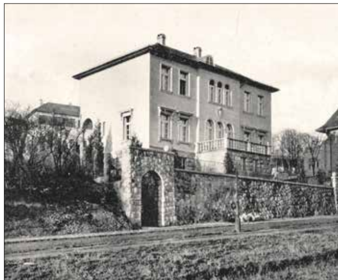
A Ráth György utcai épület klasszikus stílusú, háromszintes villa volt

készültek, de gazdag ornamentikával, melyet legtöbbször felesége, Lux Alice tervezett. A Ráth György utcai ház még inkább klasszikus stílusú