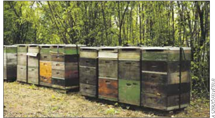
Kaptárak a Normafánál

– Természetesen! A kaptárokra szerelt fésűkkel friss virágpont is lehet gyűjteni. Ahogy a terheléssel hazaérkező rovarok a kaptárba igyekeznek, és átküzdik magukat a fésű fogai között, a lábukról a virágpont egy része leperget egy kis fiókba. Mivel a virágpont nyersen nagyon romlékony, mindennap, reggel vagy este el kell jönni érte. A friss virágpont a kaptár kinyitása és a méhek jelentősebb zavarása nélkül lehet elvenni, és akár azonnal belekeverni a reggeli müzlibe. Meg kell említenem még