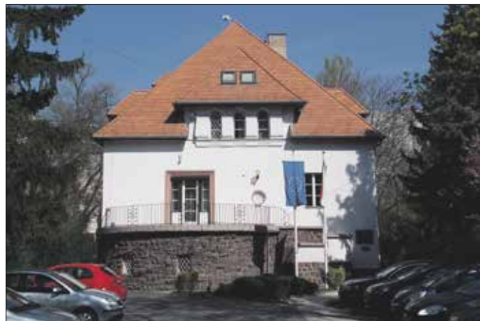
A Tartsay Vilmos utcai épület napjainkban

szeretnénk Rózsahegyi Kálmán Nemzeti Színházi tagságának 25-ik évfordulóját úgy reá, mint az egész magyar közönségre nézve felejthetetlen módon megünnepelni. Azt gondoltuk, hogy egy kis házat építtünk neki, a legmagyarabb stílusnak, mintegy dokumentálva ezzel azt, hogy a művészetnek, aki egy negyedszázadon át hintette el közöttünk lelke pazar kincsét, nemcsak babérral nyújtunk át, hanem hajlékot is tudunk adni neki öreg napjaira. Ennek a háznak a köveit a magyar társadalom minden rétegének a szeretetéből és áldozatkészségéből kívánjuk összehordani és ehhez csak annyit kérünk azoktól, akiknek Rózsahegyi Kálmán valaha csak egy derűs pillanatot szerzett: járuljanak hozzá egy-egy téglával és akkor állani fog e kis ház, úgy Rózsahegyi