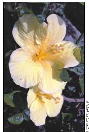
„A királyok virága”

A kertészeti hasznosítás mellett a növény számtalan hasznosított