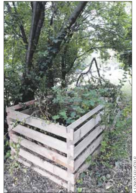
A helyszínen gyűlik a nyesedék

egyik érdekes szépsége a kora tavaszi fürtös gyöngyike és aszpektus, amiben nagyon sok példány virágozott, és magot is tudott érlelni. Akár ezres nagyságrendű álló-