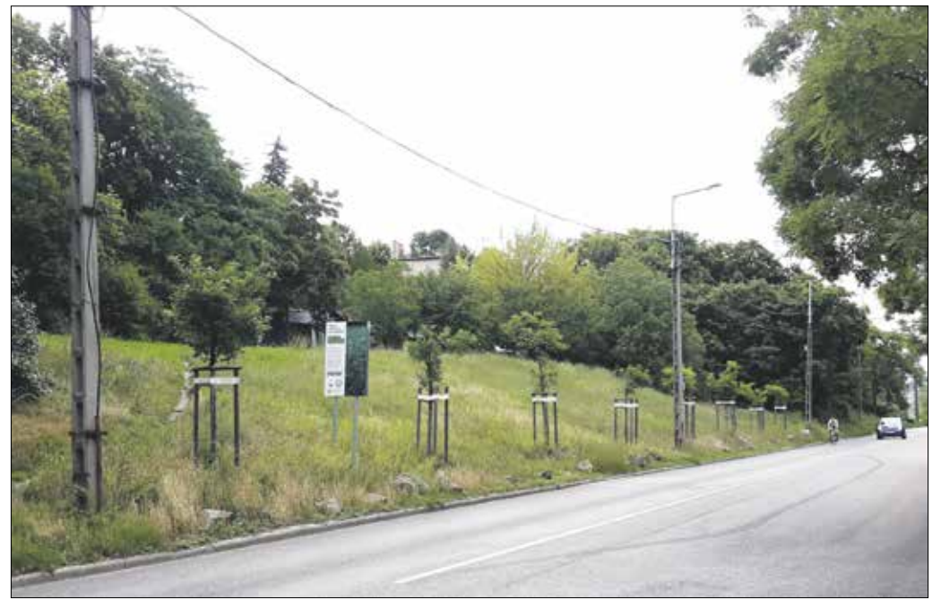
A magyar gyeplő is szép, csak máshogy, mint az angol – erre bizonyíték az Abos utcánál lévő füves rézsút is

– Van egy aktív telepítés is, ami tulajdonképpen magvetést