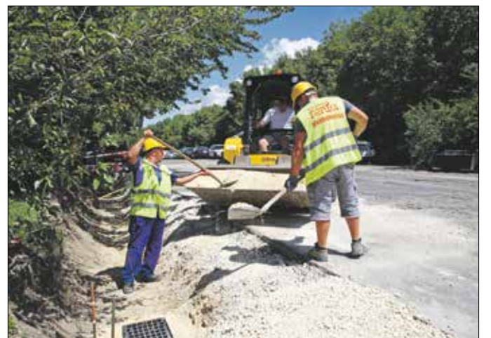
Vízvezető épül a Álom utca Zalatnai út és Trencsényi utca közti részén

Az úthibákat folyamatosan javíttatja a Hegyvidéki Önkor-