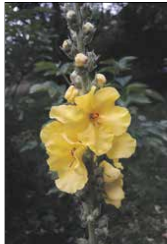
Ökörfarkkóró a kaszálórét

a terület szándékosan ilyen, és az a fejlesztési koncepció, hogy hagyjuk felnőni és virágozni a növényeket, hogy magot tudjanak érlelni. Ezáltal azok a kétszikű virágos fajok, amik eddig károsultak voltak a gyakori kaszálásnak, most jobban elszaporodhatnak. Szakszerűbben mondva: a fűvek