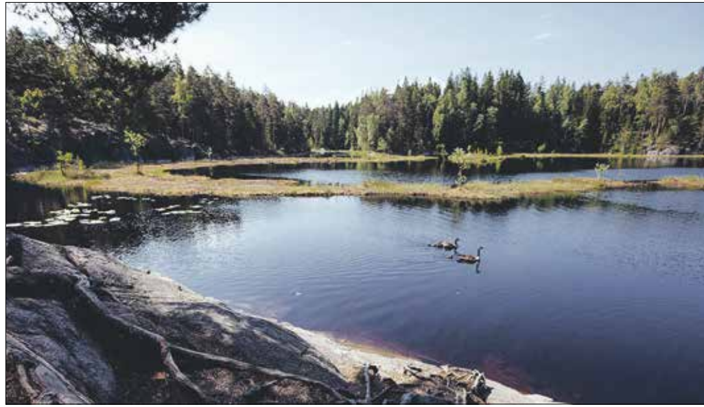
Espoo mellett ugyan ott van a Nuukio nemzeti park, de a városban belül is ki kell alakítani zöld helyeket

nem mindegy a népesség átlagos egészségi állapota, ez pedig a zöld területek aktív igénybevitelével