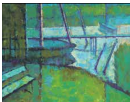
Füzes Gergely: Stégnél