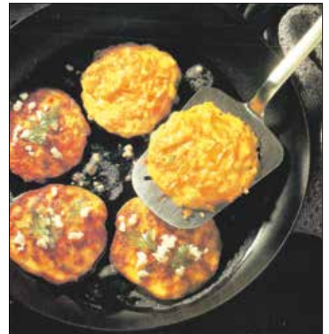
Gyorsan elkészíthető zöldséges harapnivaló

Hozzávalók (4 személyre): 1 db kb. 1 kg-os zsenge csillagtök • A töltelékhez: 20 dkg darált sertéshús 3 evőkanál szójagranulátum 5 dkg rizs 1 kis fej vöröshagyma 2 gerezd fokhagyma 2 evőkanál olaj só, őrölt bors ételízesítő por 1 nagy csokor petrezselyem • A tál kikenéséhez: olaj • A tetejére: 0,5 dl tejföl 5 dkg reszelt sajt