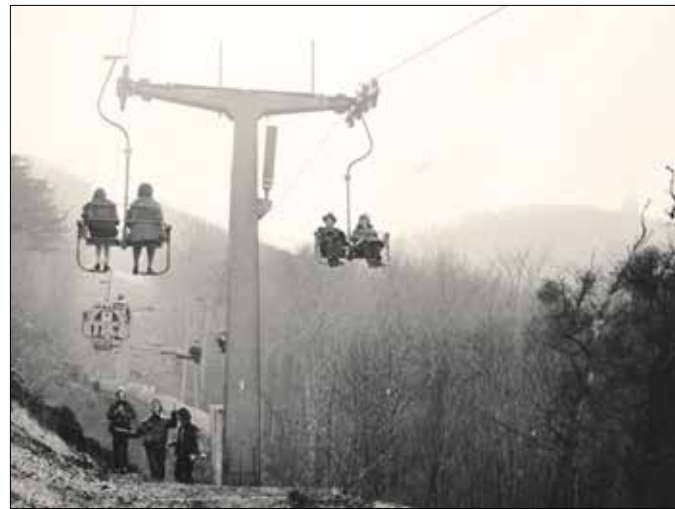
Panoráma a János-hegy felé (1976)

Az elkészült János-hegyi légpályát 1970. augusztus 19-én adták át ünnepélyes keretek között. Az állami, fővárosi és kerületi vezetők