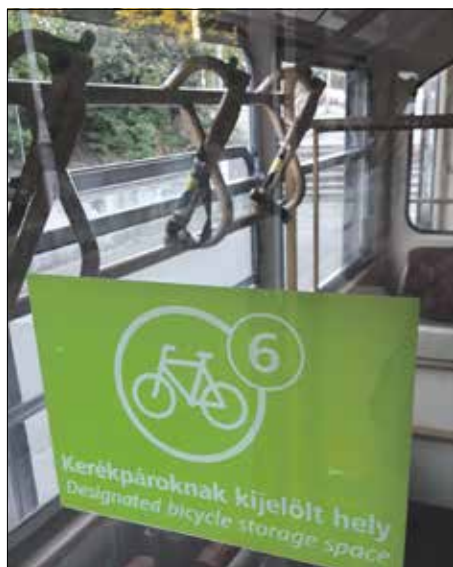
A fogason már régóta lehet biciklit szállítani

délután, munkából hazafelé, fáradtan vigye fel a drótsamarat a hegyre inkább a villamos, a busz vagy akár a fogaskerekű!