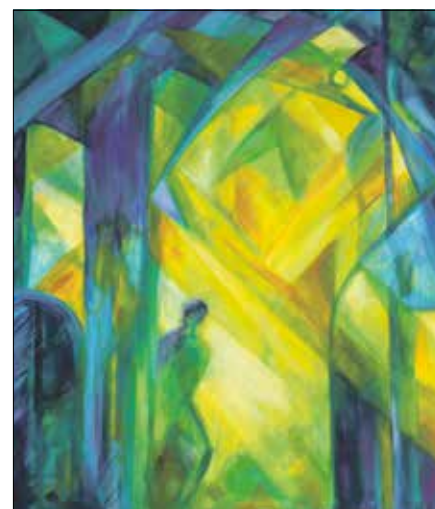
Siska-Szabó Hajnalka: A gótika fényei