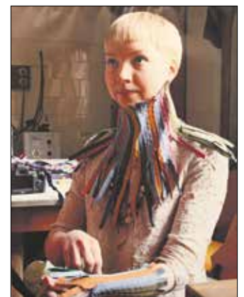
2016. Zipp kurzus