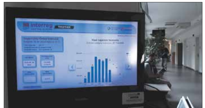
Okosmérő a polgármesteri hivatal épületében

Az eredmények kiértékelése után a szakemberek beavatkozási pontokat azonosítottak. Ezek alapján az önkormányzat Hegyvidéki Zöld Irodája végezte a