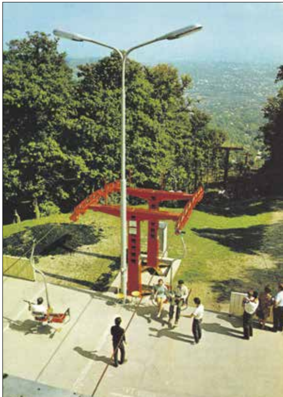
Kezdetben még piros színűek voltak az acélállványok

Az átadás előtt kezdetben csak Zugligről vagy János-hegyi kötélpályaként emlegetett közlekedési eszközt egy nyilvánosan meghirdetett névpályázat mintegy tízezer javaslatból kiválasztva keresztelték a ma is használatos Libegő névre. Néhány beérkező ötlet: Angyalvasút, Acélpók, Búvós-szék, Drótcacsai, Émelygő, Égi taliga, Fotellift, Fácánröpte, Hegyi-kopter, Páros-János,