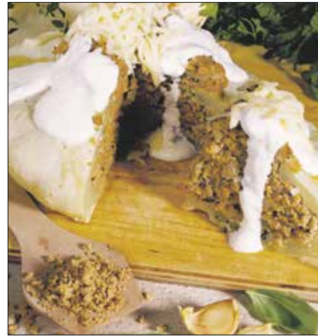
Általában darált hússal töltjük meg

A csillagtök formáját tekintve kínálja magát a megtöltésre. A töltelék általában hagyományos darált húsos, amelyet bátran fű-