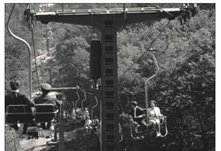
Összesen 101 széken libeghetünk

A Tükör című lap az átadás után egy héttel úgy fogalmazott, hogy