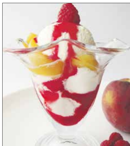
Pêche Melba: ószi-barackos fagyaltkelyhe

leg szépséges jéghegybe töltött vaníliafagyalton heverték, ám mára egyszerűsödött az édesség megjelenése. A változás azonban nem vált kárára, mert a tartalma gazdagodott: a hatyú helyett jött az ínycsiklandozó málnaöntet, így