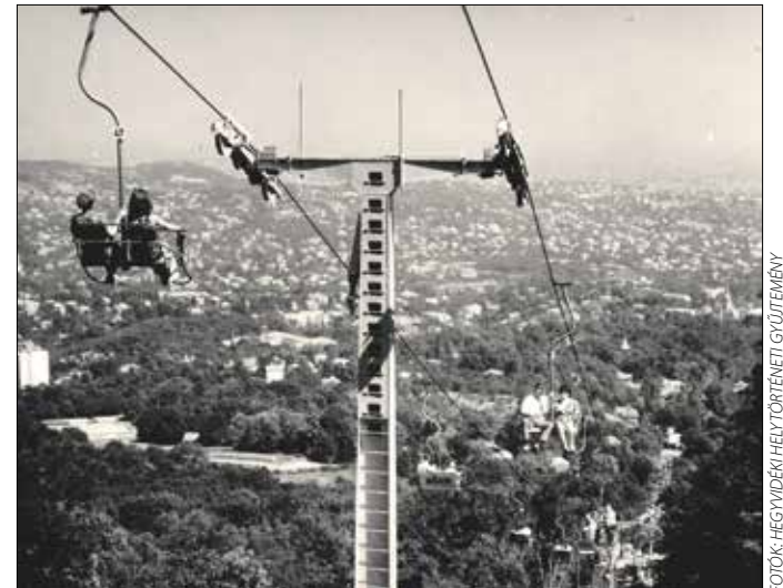
„Mintha nem is mi mozdulnánk [...], hanem a város közelednék felénk”

tozott, ekkor kapták a tartóoszlopok a környezethez jobban illeszkedő zöld színüket. A különleges közlekedési eszközt az első hét évben az építető XII. kerület üzemeltette, majd 1977-ben a BKV-hoz került, és néhány hosszabb-rövidebb kitérő után 2010 óta újra a társaság kezelésében működik.