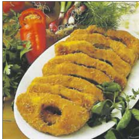
Ne sajnáljuk mellőle a tejfölt, a tartárt!

Gyakorlott sütő-főző embereknek nem gond a csillagtök kirántása, annál nehezebb a megtisztí-