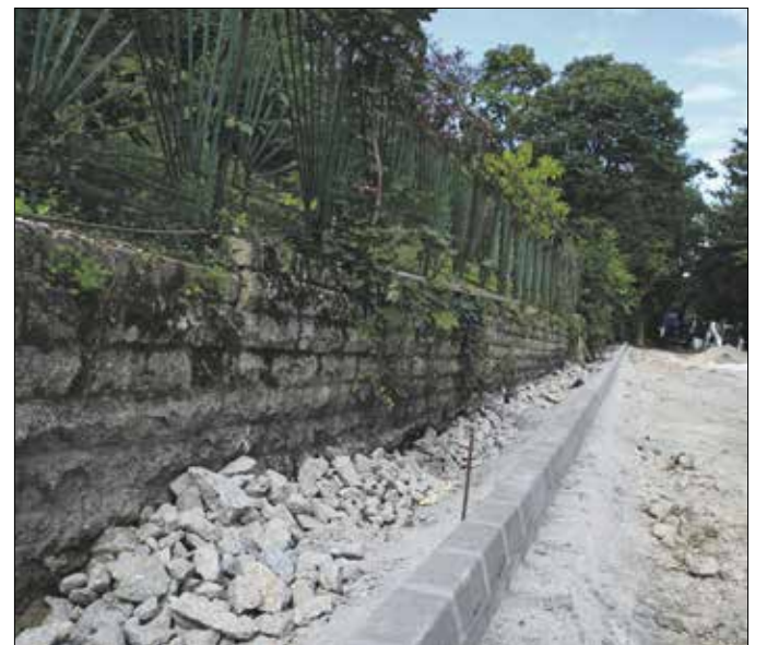
Már elkészült a szegélyezés a Gyógyfű utcában

megállója melletti és a Konkoly-Thege Miklós úti murvás parkolókat. Mozdáskorlátozottaknak fenntartott helyek is lesznek, továbbá az elektromos autók töltését lehetővé tévő modern töltőfejeket telepít a kivitelező.