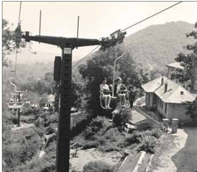
A tervezők a kétszemélyes ülések mellett döntöttek

már a kilátásért érdemes volt létrehozni a Libegőt. Idézet a cikkből: „... amikor valahol – feltételezően külföldi vendéggel – a város sok-sok kiemelkedően atraktív pontjának egyikén megállunk, igen-igen, akaratlanul szinte felkiáltunk az örömtől... Ezekhez a szívemengető »pontokhoz«, a Citadellához, a Várhegy egyenlő helyéhez, a Hármashatár-hegyhez [...] most egy újabb, bizonyos szempontból mindegyikünkkel különlegesebb csatlakozik: a Libegő lefelé, a Zugligről közeledő ülése. Mintha nem is mi mozdulnánk, a kötélpálya utasai, hanem a város közelednék felénk. Fenn ringunk a magasban, előttünk ez a káprázat, amint az erdők lombjai közül kitárul