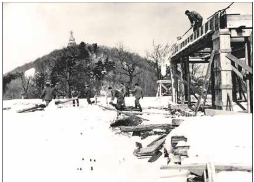
Épül a Libegő (1969)

Az építkezés idején sokan aggodtak, hogy a folyamatosan mozgó székekbe való beszállás súlyos baleseteket okozhat. Félelmük felesleges volt, az elmúlt ötven évben egyetlen komolyabb sérülés sem történt. Az utasok biztonságára a kezdetektől nagy gondot fordítanak az üzemeltetők. A tartóoszlopokra hangszórókat szereltek, amelyek segítségével üzemzavar esetén értesíthették a fenn lévőket. Az állomási ügyeletesek