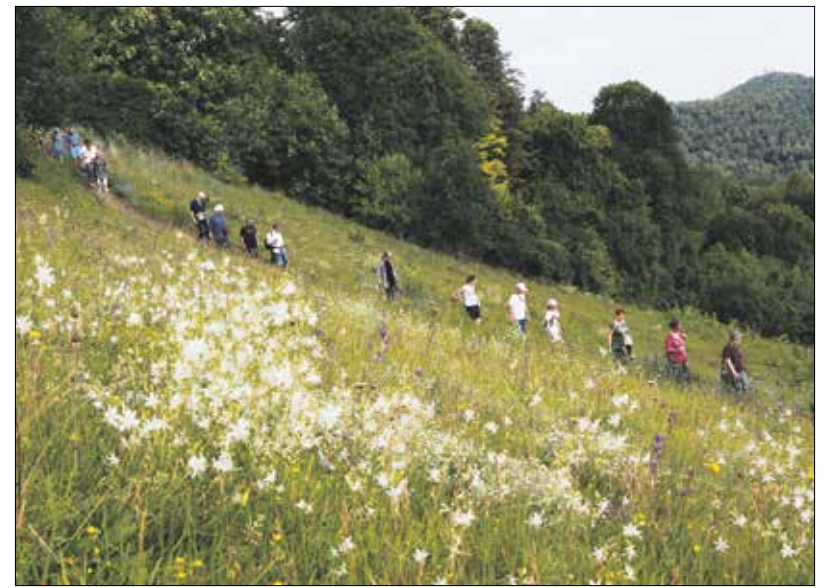
A tömegesen nyíló ágas homoklilium szinte légies, fehér fátyolként borítja a réteket

A sétán feltűnt egy nem várt orchidea is: a madárfészek kosbor. Ez a növény népszerű rokonai között nem számít szépségkirálynő-