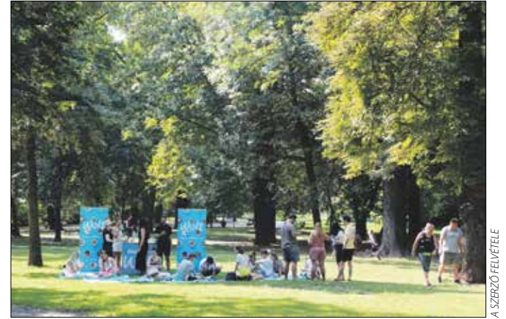
Piknikkel egybekötött szemétszedést tartottak a fiatalok

A példamutató kezdeményezéshez, ahogy minden hasonló esetben szokott, az önkormányzat Hegyvidéki Zöld Irodája biztosított kesztyűket, szemétszákokat, és vállalta az összegyűjtött szemét elszállítását is. Végül ez utóbbival nem volt sok dolga, mert a civil