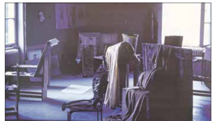
1983. Reggel a rajzteremben