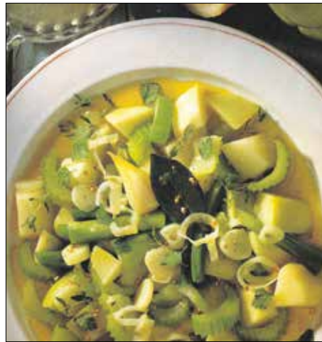
Hagyjuk, hogy összeérjenek az ízei!

A csillagtököket félbevágjuk, kimagozzuk, meghámozzuk, majd 2x2 centis kockákra vágjuk. A megtisztított újhagymákat 3