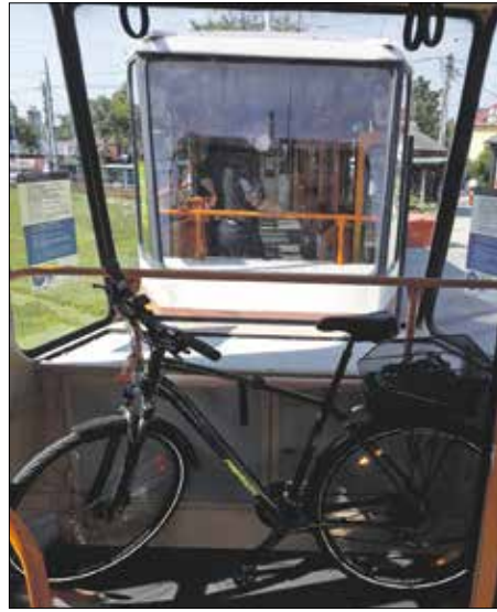
Kerékpárnak kijelölt hely az 59-es villamoson

A XII. kerületnek azonban csak egy viszonylag kis része érhető el a fogas vonaláról, így az sok kerékpárosnak csak komoly kitérő és súlyos idővesztés árán jelenthet hasznos alternatívát. Május óta a BKK nekik kedvezkedik a