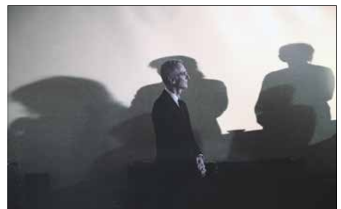
A diplomaosztó ünnepséget megelőző pillanat

ba, ott találkozott az archív anyagokkal. Nem sokkal ezután Schrammel Imre és Fekete György elindított egy projektet, ellátták az intézményt számítógépekkel, fotófelszerelésekkel, videóvágó-kamerákkal.