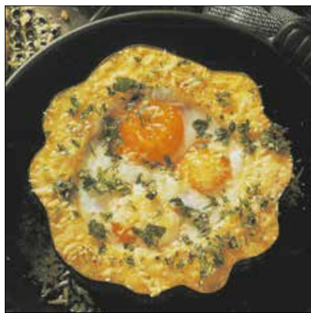
Mutatós étel a tojásos csillagtök fészékben

A csillagtökök tetejéről egy „kalapnyit” levágunk, és a magos belsejét kikaparjuk, eldobjuk. Ezután a zöldséglevesben kb. 10 percig főzzük, majd lecsöpögtetjük, de a főzővizéből egy csészényit félreteszünk. A megpárolt tököcskéket kivajazott tepsibe vagy tűzálló tálba egymás mellé rakjuk, a