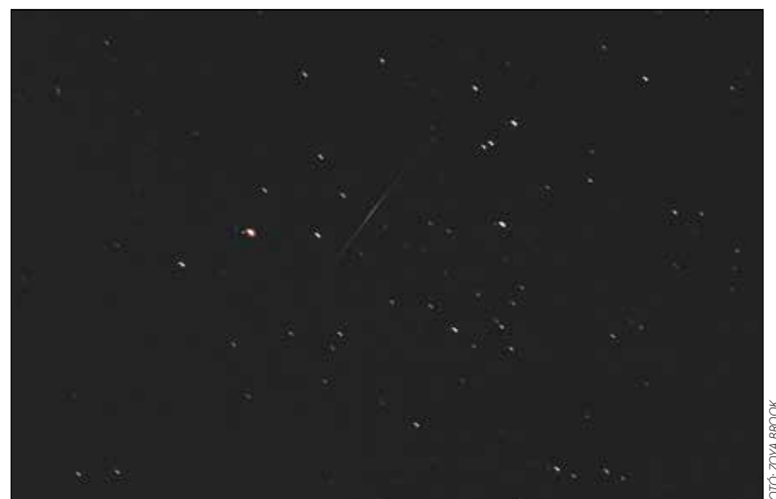
A csillaghullás jelensége az ősidők óta érdeklő az emberiséget