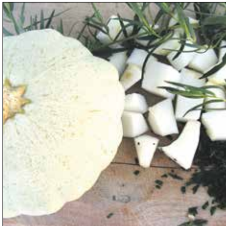
A szemrevaló csillagtökből kitérő leves főzhető

Az igazi nyári levelek közé tartozik, olyannyira, hogy langyos