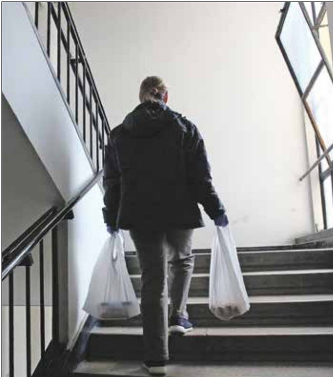
Az önkéntesek a járvány kezdete óta biztosítják az ebédszállítást

– A legtöbben ezt meg is teszik, ám sokaknak nincs állandó segítsége, vagy épp a jelenlegi helyzet miatt – például mert az őket ellátó családtag, ismerős megbetegszik,