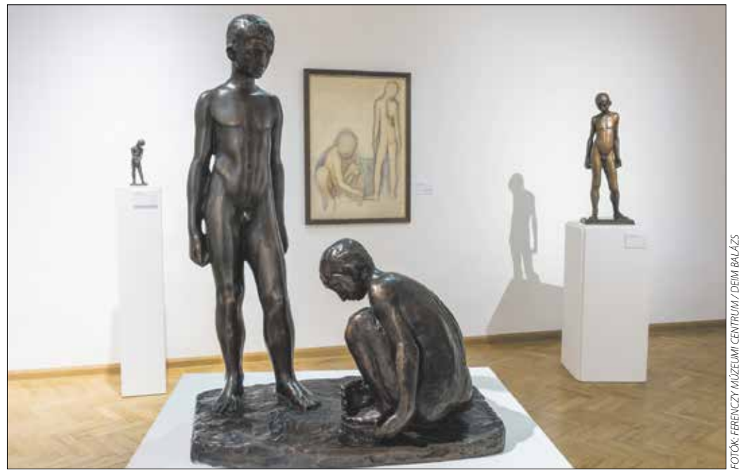
Kiállítási enteriorkép, előtérben Ferenczy Béni Játszó fiúk (1947) című szobra

Firenzeben, Münchenben tanult, Párizsban ismerkedett meg a kubizmussal, aztán végigjárta a szobrászat göröngyös útját, így lettek életművének szerves részei a formai váltások. Sok apró, ökölnyi szobrot is készített, ezekből három őriznek a szentendrei múzeumban. Mértani idomokra bontotta a test alakzatait, majd rövid ideig tartó kubista és avantgárd korszaka után újra felfedezte a klasszikus szobrászati értéke-