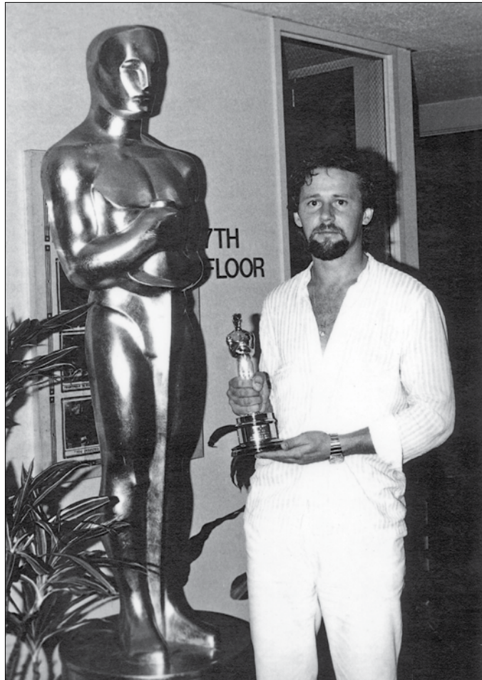
Csak hónapokkal később vehette át a szobrot (Los Angeles, 1981)

– A Mamim volt a mentorom, hozzá hasonlóan én is sokat rajzoltam. Zseniális művész volt! Ő