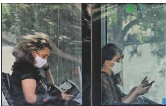
Már nem csak utazás közben kell maszkot viselni

ség lesz még rá. Arra is figyelmeztetett, hogy a maszk gyakori fel- és levétele igazán kockázatos; a legjobb, ha valaki otthon felveszi, és addig hordja, amíg haza nem ér. Minden alkalom kockázatot jelent ugyanis, amikor nem fertőtlenített kézzel nyúlunk a maszkhoz vagy az arcunkhoz.