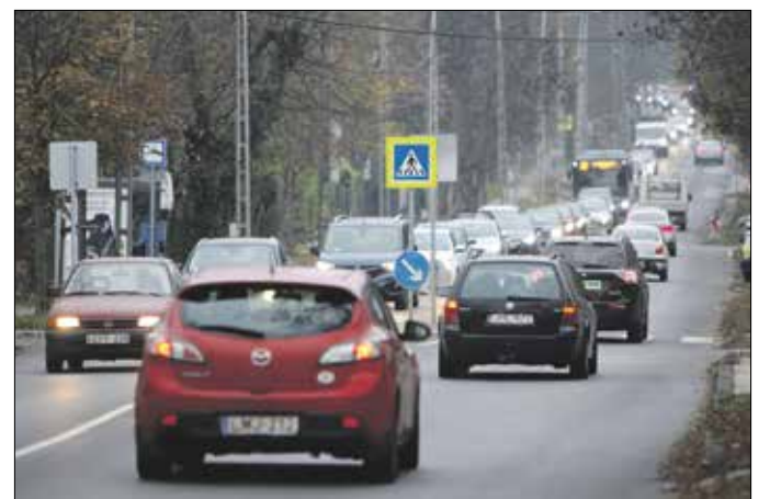
Mindennaposak a rendszeres dugók a Budakeszi úton

letes vizsgálata után, a buszsávok megépítéséhez szükséges tervek elkészítését, együttműködésben Budakeszivel és a XII. kerület önkormányzatával, a fővárosi önkormányzattal és a Volánbuszsal.