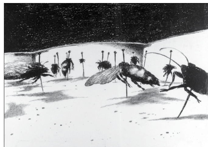
A légy szeméből látjuk az egész filmet – kivéve a végét..

tudom, akkoriban hogyan képzeltek el a megvalósítását. Bár előbb jött volna ez a nagy technikai revolúció!