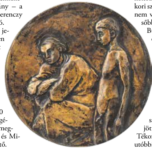
Ferenczy Béni: Anya és fiú (1939)

amellyel a nő szépség előtt tiszteleg, de szerette a torzót is, mert úgy vélte, az is ugyanúgy egész