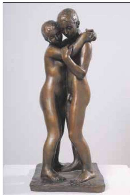
Ferenczy Béni: Szerelmespár (1948)

Ferenczy Béni Nagybányán nőtt fel, édesapja, Ferenczy Károly a nagybányai alkotótelep egyik alapítója és legtekintélyesebb tagja, édesanyja, Fialka