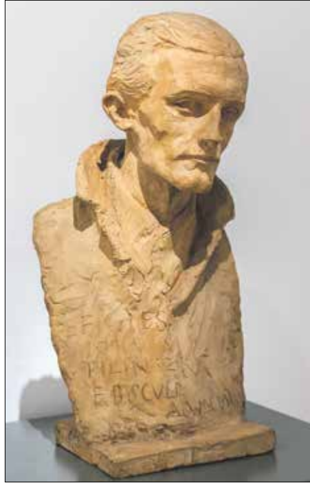
Ferenczy Béni: Pilinszky János (1954)

A legendás, kétgenerációs Ferenczy művészcsalád tagja, Ferenczy Béni nemcsak művészetével, hanem a saját értékrendjével, belső harmóniával sugárzó személyiséggel vált a 20. századi magyar képzőművészet emblematikus képviselőjévé. Több európai fővárosban megfordult, megismerkedett az avantgárd törekvésekkel, de mindig a szobrászat klasszikus hagyományait tekintette mércének: ezért is tartják számon a klasszikus mediterrán szobrászat egyik hazai képviselőjeként. Számos író és költő, köztük Juhász Ferenc, Nagy László, Pilinszky János, valamint későbbi szobrász generációk tekintették őt példaképüknek.