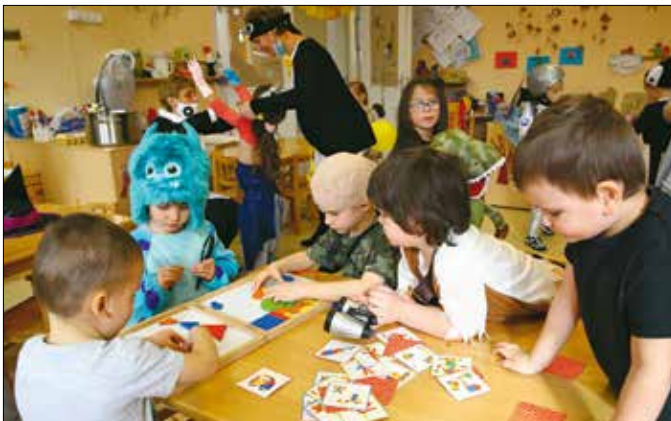
Hegyvidéki Mesevár Óvoda

Lapunk 4-5. oldalán részletesen olvashatnak a Hegyvidéki Mesevár Óvodáról, a KIMBI Óvodáról és a Mackós Óvodáról, valamint az óvodáértéssel kapcsolatos tudnivalókról. A további hegyvidéki óvodákat következő lapszámainkban mutatjuk be.