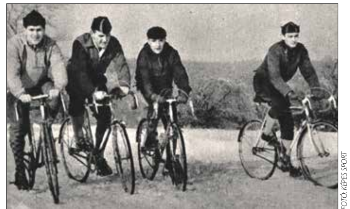
Kerékpárosok a havon a Normafánál (1964)

Anna-kápolna mellett, s miután a folytonos vasárnapi üvelésekkel már minden bokrot és minden lejtőt kiismertek, az ugrással is megpró-