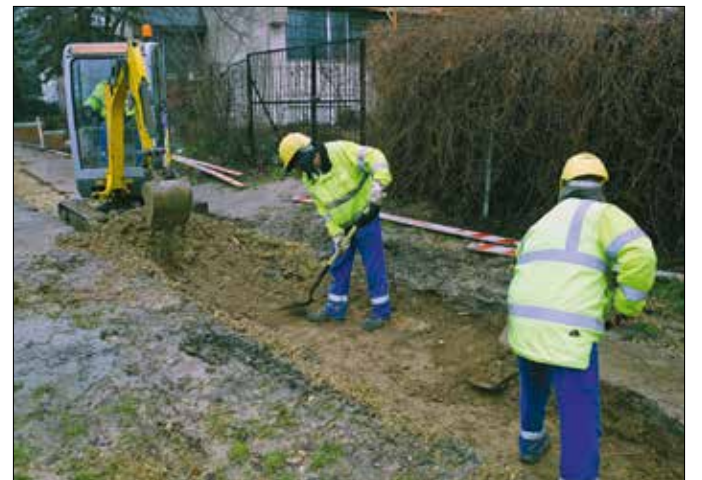
Az időjárástól függ, hogy mikor lehet aszfaltozni a Zugligeti úton

A fogyasztók biztonságos villamosenergia-ellátása érdekében zajló munkavégzés idején a Remete út-Szthlo Gábor utca irányába csak célforgalom esetén lehet behajtani a Zugligeti útról. Az Árnyas út a Szthlo Gábor utcától a Remete útig felfelé egyirányú lesz, a Budakeszi út felől csak a Remete útig lehet autóval eljutni, míg a Szthlo Gábor utcától lefelé mind-