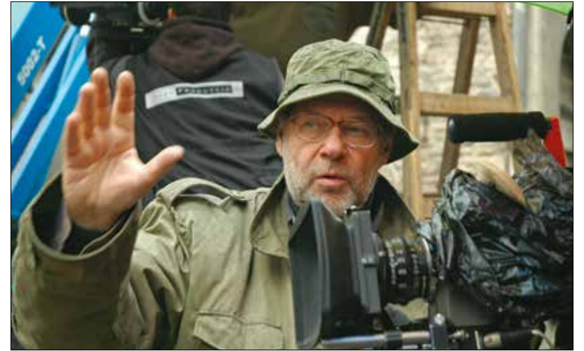
Szomjas György Kossuth-díjas filmrendező

– Tizenhat éves koromban két meghatározó dolog történt velem. Az egyik, hogy Budapest belvárosában éltem végig a forradalmat, másrészt meghallottam a rock and rollt. Illés Lajos