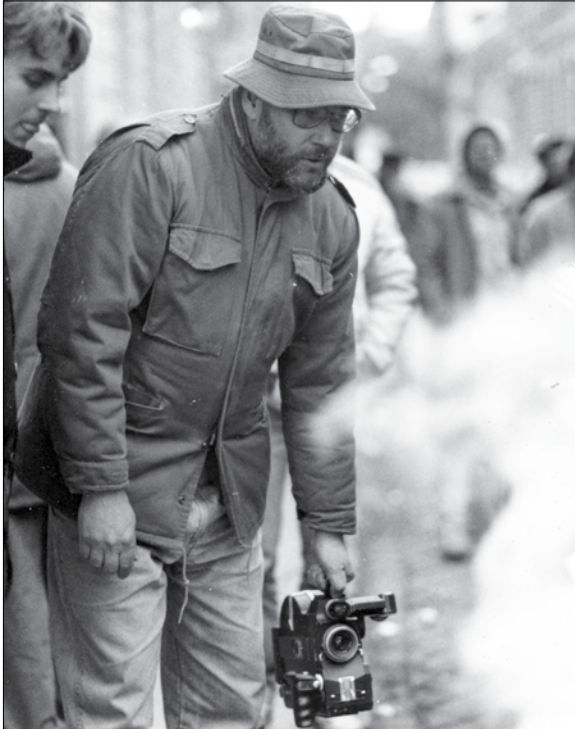
A Roncsfilm forgatásán 1992-ben