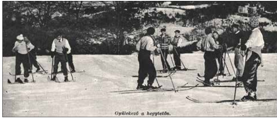
Normafa, 1920-as évek

Amint egy-egy versenyző elindult a meredek pályán s egy-két rövid másodperc alatt már eltűnt lent a fák között, hogy azután alul ismét mint