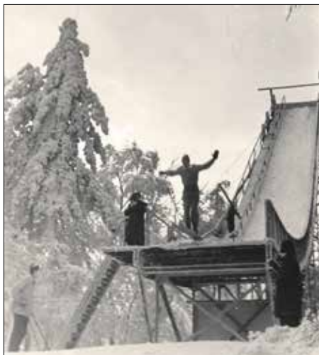
A már elbontott síugró-sánc

A rövid lesikló verseny pályája a Normafa meredek lejtője, és az u. n. Sigray-féle telek volt, e kettőn keresztül vették sebes inamukat a versenyzők. A távolság kb. 1 km., magasság kb. 100 méter volt.