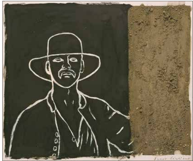
Fehér László: Rosszemberek

sok időnként előjöttek, aztán arnyjátékban jelentek meg a vásznon. Voltaképpen ez egy illusztrált dalciklus, a filmváltozatban egyéb filmrészletekkel még gazdagabb vizuális szempontból. Látványos és