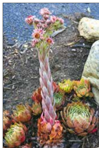
A kövirózsa virága

A sekélyen gyökerező növény húsos leveleiben tárolja a nedvességet, így hosszabb száraz időszakokat is károsodás nélkül átvészel. Ez a tulajdonsága teszi lehetővé, hogy a csupasz sziklákon, vagy nagyon sekély termőrétegen is megéljen. Tápanyagot főleg az esővel lemosódó porból szerez. Ahol gyökeret ver, ott folyamatosan termeli maga körül a sarjakat (erre utalva angol nyelvterületen „tyúk és csirkék” néven ismerik).