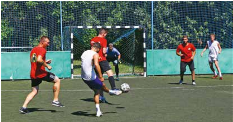
A fehér mezű „angolok” mindenkit legyőztek, méltó helyre került a kupa

Nyolc „ország” részvételével egy napos, pörgős mini labdarúgó-Európa-bajnokságot szervezett a Hegyvidéki Szabadidősport Non-profit Kft. a Városmajori Gimnázium mellett műfüves pályákon.