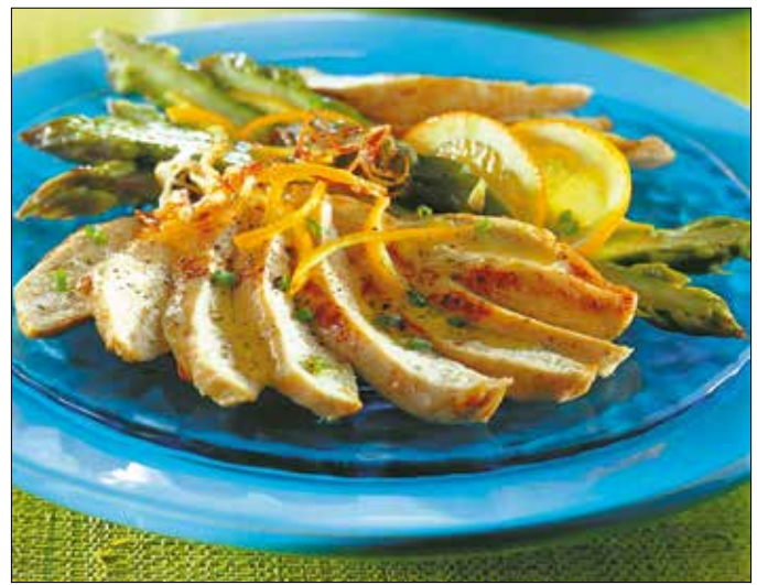
A pácolástól ízezebb, omlósabb lesz a csirkehús

A pácolástól nemcsak ízezebb lesz a sütnivalónk, hanem az olajtól puhábbá, omlósabbá válnak a hús- és zöldségszokrok. A pácolás ideje a nyersanyagtól függően né-