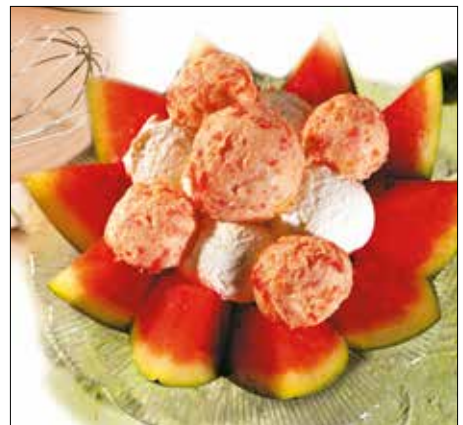
Királyi édesség görögdinnyéből

Kánikulában valóban királyi édességet varázsolhatunk egy cakkosra vágott fél görögdinnyéből. A csodás desszert megkoronázásához két megoldás is kínálkozik: vagy elkészítjük a különleges tejszínes dinnyefagylaltot, vagy egy-