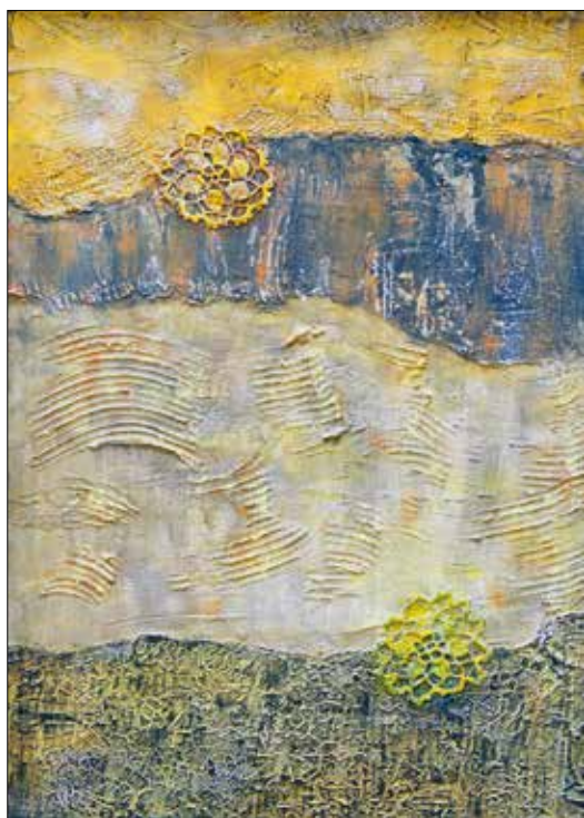
Szamos Iván: Délibáb