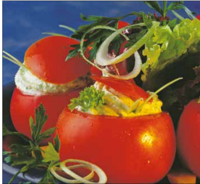
Nem szokványos, mutatós, laktató előétel

Hozzávalók (6 személyre): 6 közepes, kemény paradicsom, só, 20 dkg juhsajt, 2 dkg vaj, 2 evőkanál tejföl, 1 gerezd fokhagyma, késhegynyi őrölt fehér bors, 1 kis csokor petrezselyem