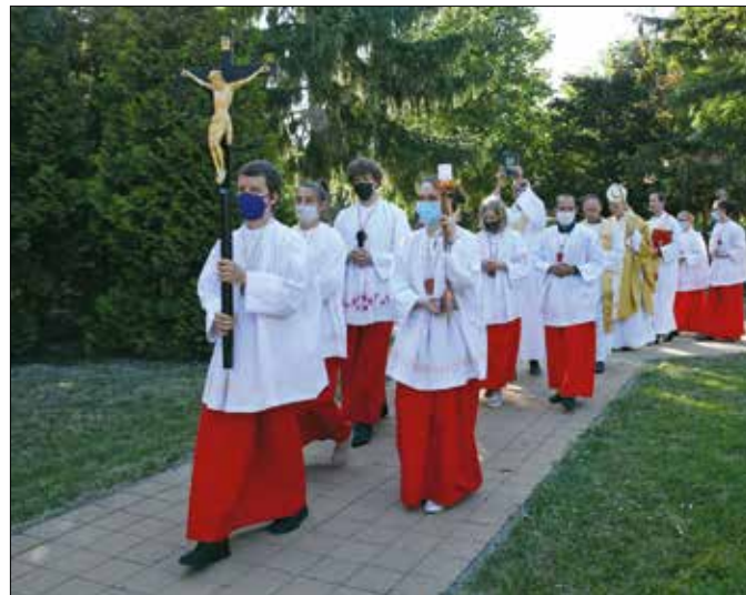
Összetartó közösség alakult ki az elmúlt nyolcvan évben

mot is. Igaz, a ma már ünnepeket építészeti bravúrunk tekintett épületet akkor elutasította a környék lakossága, „istengarásznak”