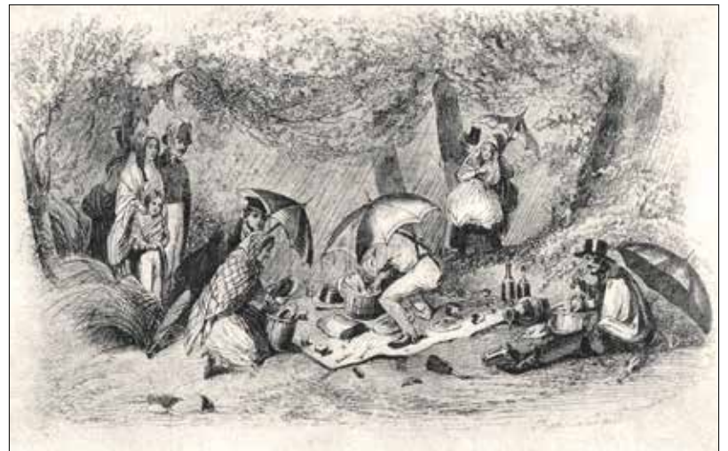
A hatalmas esőzések sok gondot okoztak a Zugligetben a 19. század közepén