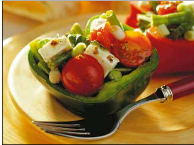
A tányérként szolgáló zöldpaprikát a végén akár meg is ehetjük

Játékosan, zöldpaprikatányérban tált nyári leje saláta ez. Inkább önálló fogás, mint klasszikus saláta, noha egy-egy grillezett hússzelet mellett is jól megállja a