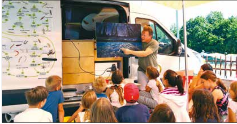
Apró vízi élőlényekkel ismerkedtek meg a gyerekek az interaktív laboratóriumban

■ További tudnivalók: hegyvidekport.hu/hegyvideki-matyas-tabor