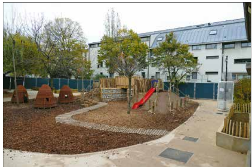
Hűsítő menedékek, játszóhelyek, és az oktatást is szolgálják a párizsi iskolaudvarok

Az immár negyedik online akadémián elhangzó kutatási eredményeket – a szakmai nézetek részleteinek nagyvonalú negligálásával – igen egyszerűen össze lehet foglalni: nem nyugtathatjuk meg magunkat azzal, hogy zöld kerületben élünk, tovább kell (okosan) zöldíteni az ablakpárkányainkat, tetőinket, falainkat és kertjeinket! Minden egyes fa, áll-