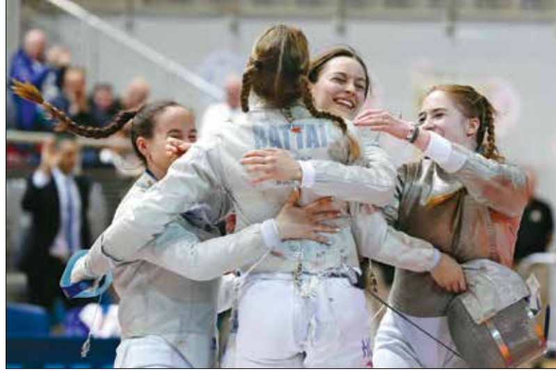
Aranyérem az Európa-bajnokságon

– Nagyon fontos a koncentráció, de ugyanúgy az állóképesség is. Egy-egy asszó viszonylag gyorsan lezajlik, ami azt jelenti, hogy