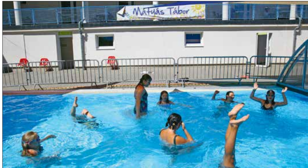
Abban az összes táborozó egyetért, hogy ilyen időben a legjobb a medencében pancsolni

Az ELTE Gyertyánffy István Gyakorló Általános Iskola peda-