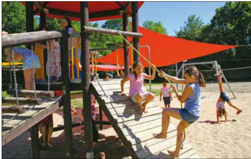
Van mivel elfoglalniuk magukat a táborozóknak, a játszótér sosem üres