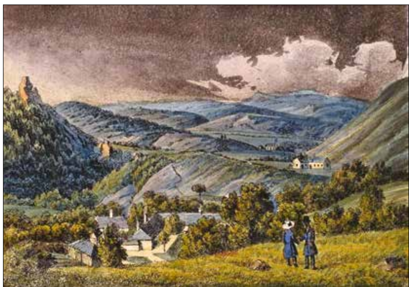
Carl Vasquez: Az Auwinkel, Buda mellett (színezett metszet a Zugligetről 1837-ből)

nyosan alábbhagynak, s észreveszik, hogy csakugyan jobb a sok garas, mint a kevés forint.” (Pesti Napló, 1851. augusztus 23.)