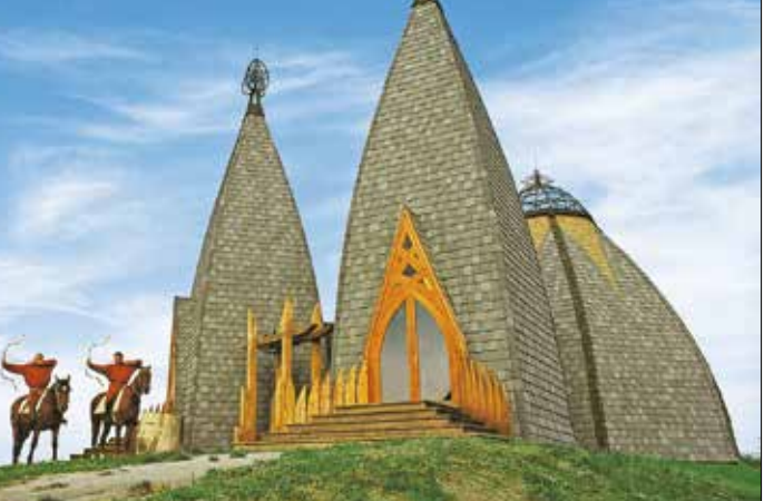
Az Erdők temploma Ópusztaszeren Csete György tervei alapján készült

Összegzőként megfogalmazta, mi a leginkább közös a művész házaspár munkásságában: a modern gondolkodás, a struktúraelv és az ornamentika. Ezek között pedig nemcsak az összhangot találták meg, hanem azt az utat is, amin egy-egy motívum rendszerizhetővé, újrendezhetővé válik ezen túlmenően olyan struktúrák