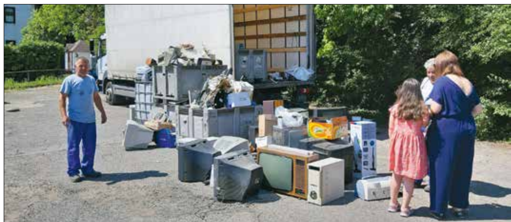
Az összes leadott hulladék mintegy fele árammal, akkumulátorral vagy elemmel működő készülék volt

A Hegyvidéki Zöld Iroda szerződött partnereinek keresztül gondoskodik arról, hogy az egyes hulladéktípusok, szétválogatva, az ártalmatlanítás megfelelő helyre kerüljenek, és amennyiben lehetséges, az újrahasznosításuk is