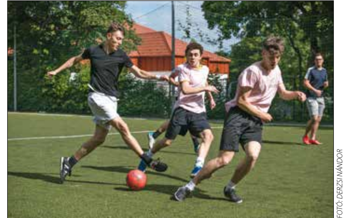
A hosszú bezártság után mindenkinek jólesett az egész napos mozgás

Közben azok sem unatkoztak, akik inkább az egyéni sportágakat