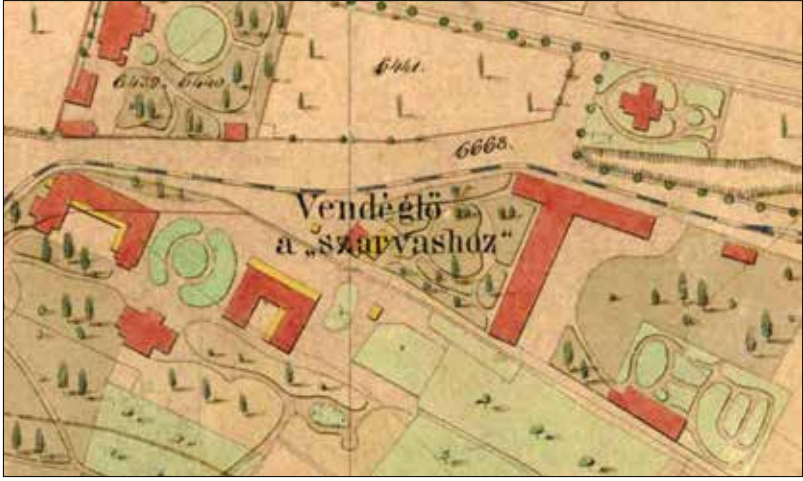
„A szarvashoz címzett zugligeti vendéglő” megjelölése egy 1878-as térképen

Nem így volt ez a múltban. A budai hegyvidék bővizű forrásokban, patakokban bővelkedett. [...] A Zalai út mentén a Zalai út és a Dániel út sarkától lefelé számított első vízbukató alatt van egy bővizű forrás,