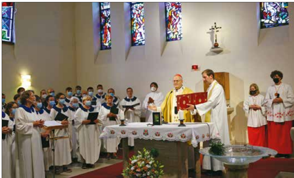
Erdő Péter bíboros, prímás, esztergom-budapesti érsek szentelte fel a templomot

ünnepejük. A Bibliában azt olvashatjuk, hogy Jézus világító lámpaként jellemzi Jánost. Így került fő ünnep az év legvilágosabb, leghosszabb napjára, a nyári napfordulóra (ami egyébként Jézus születésnapjától, a téli napfordulótól legtávolabbi időpont az évben).