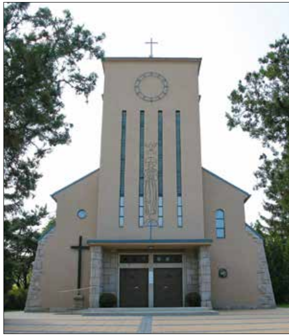
A Felsőkrisztinavárosi Keresztelő Szent János Plébánia

Ekkor a hívek, a mai Apor Vilmos térre tervezett, háromtornyú, impozáns nagytemplom elkészültéig, a közösségi házban alakították ki az átmeneti misézóhelyet. A né-