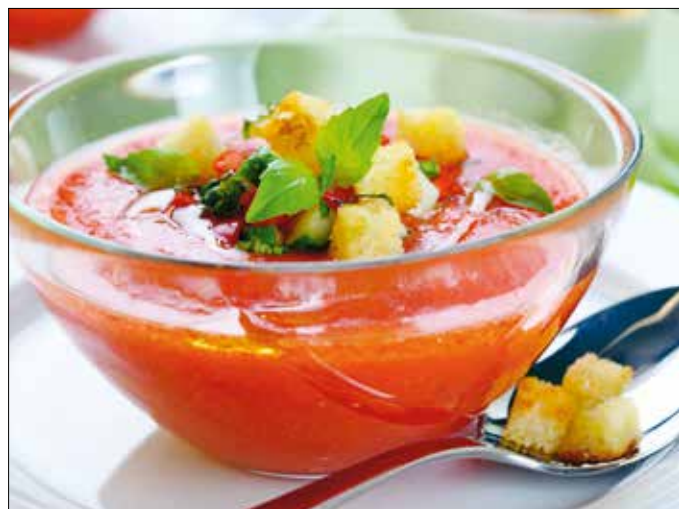
A híres gazpacho eredetileg nem volt sem spanyol, sem hideg, sem piros

Elsőként a kenyeret vízbe áztatjuk. Ezt követően a megtisztított hagymát és fokhagymát apróra vágjuk, a meghámozott uborkát és paradicsomot is feldaraboljuk,