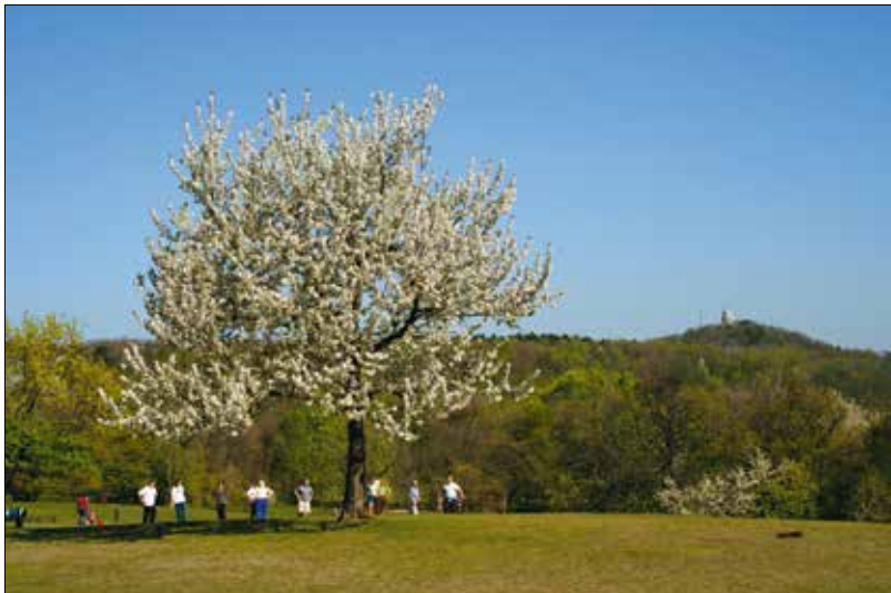
Akár már egyetlen fa is képes érzékelhető mértékben javítani mikroklímáját

sebb időt töltenek munkával, mint az árnyékos oldalon ülő kollégáik. Mindemellett a munka hatékonysága is sokat romlik, ami már kimutatható nemzetgazdasági következményeket is maga után von.