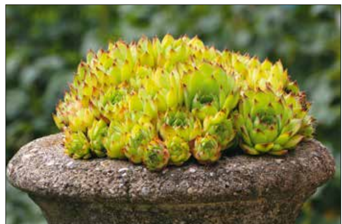
Leveleiben tárolja a nedvességet, így a hosszabb szárazságot is kibírja

Hazánkban két fajta őshonos vadon, mindkettő védett. A mediterrán kötődésű fali kövirózsa a Mecsekben és a Villányi-hegységben tenyészik, a sárga kövirózsa a mészkőhegységek nyitott gyepeiben, így a Budai-hegységben is több helyen előfordul. Kerületünkben leggyakrabban az alacsony tölgyesek alatt kibúvó sziklákon lehet megtalálni.