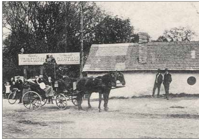
A Szarvas vendéglő egy 1909-es képeslapon

„A budai hegyvidék, amely ideális fekvésénél, pormentes özondús levegőjénél fogva a legszebb és legkiválóbb üdülőhelyek és kirándulóhelyek egyike, jelenleg vízben szegény.