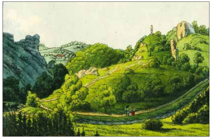
A Zugliget már az 1840-es években Budapest kedvelt kirándulóhelye volt

A kezdeményezés azonban nem talált nyitott fülekre, mivel néhány héttel később a Budai Napló arról számolt be, hogy az „államtitkár úr memorandumunkra a