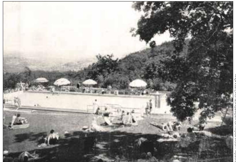
Természeti és építészeti szempontból is a főváros látványosságának számított

gondolat volt egy ilyen tó a hegytetőn. Pest külföldi vendégei természetes alakulatnak vélik és a közrudatban is gyorsan átment a »tengerszem a Svábhegyen« jelszó. Ide jár mostanában az arisztokrácia és a diplomáciai testület. Olyan dámákat látni itt, akikkel régebben csak a legelőkelőbb tengeri fürdőkön lehetett találkozni. A svábhegyi villatulajdonosoknak pedig egyenesen megváltás a »tengerszem«, mert így a nyaralást és fürdést egybekezdhetik és a strandolás miatt nem kell feladniuk kényelmüket. Persze azért a Hullámfürdő és a margitszigeti strand sem veszített népszerűségéből. Ezek is kedvenc találkozóhelyei maradtak az itthon nyaraló pesti társaságnak és külső eleganciában is