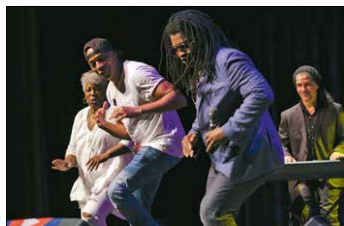
Általános örömmünneppé vált a koncert

Már az első dalok elhangzása után érezhető volt, hogy valami rendkívüli érlelődik, Rivera spanyol nyelvű konferálása a szokott-nál is élénkebb reakciót váltott ki a közönségből. A koncertre ugyanis eljött számos hazánkban élő ku-bai és más latin-amerikai rajon-