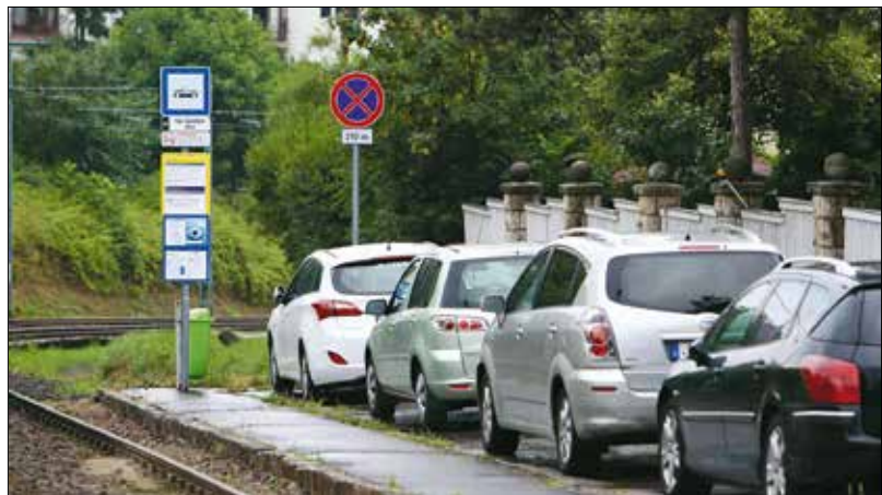
Közlekedésbiztonsági célt szolgálnak az újonnan kihelyezett tiltótáblák

kossági bejelentéseket is: az önkormányzatához tartozó útszakaszok esetében a www.hegyvidek.hu internetes oldalon, míg a fővárosi kezelésű utakon (a főutakon és a tömegközlekedés által használt utakon) a 06-1/301-7500-as telefonszámon lehet jelezni az úthibá-