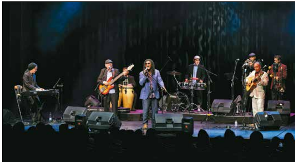
A nyolc remek muzsikus a kubai zene minden irányzatából vérpezsdítő ízelítőt adott a közönségnek