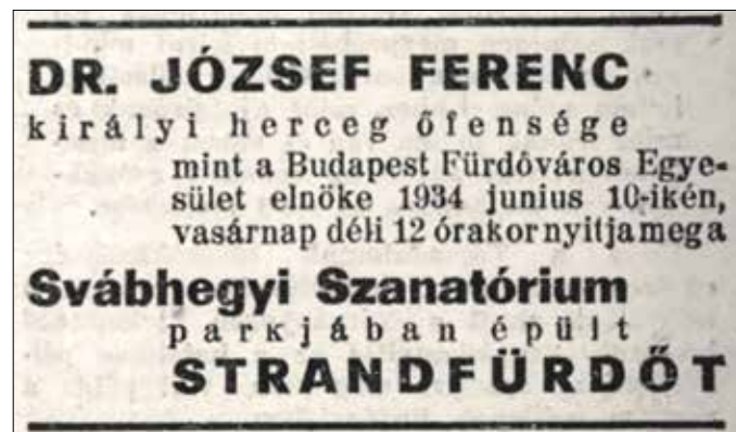
Újsághirdetés az 1934-es megnyitóról

gondolat volt egy ilyen tó a hegytetőn. Pest külföldi vendégei természetes alakulatnak vélik és a közrudatban is gyorsan átment a »tengerszem a Svábhegyen« jelszó. Ide jár mostanában az arisztokrácia és a diplomáciai testület. Olyan dámákat látni itt, akikkel régebben csak a legelőkelőbb tengeri fürdőkön lehetett találkozni. A svábhegyi villatulajdonosoknak pedig egyenesen megváltás a »tengerszem«, mert így a nyaralást és fürdést egybekezdhetik és a strandolás miatt nem kell feladniuk kényelmüket. Persze azért a Hullámfürdő és a margitszigeti strand sem veszített népszerűségéből. Ezek is kedvenc találkozóhelyei maradtak az itthon nyaraló pesti társaságnak és külső eleganciában is