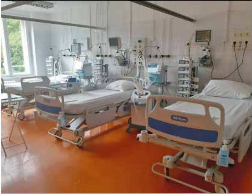
A külön COVID-osztály komfortosabb elhelyezést biztosít a betegeknek

kezdetektől, azaz 2020. március 13-tól a kezelés teljes vertikuma elérhető nálunk, ám a kórház különböző pontjain. A külön COVID-osztályal tovább növeljük a hatékonyságot, és ami legfontosabb ennyire fontos, a páciensek