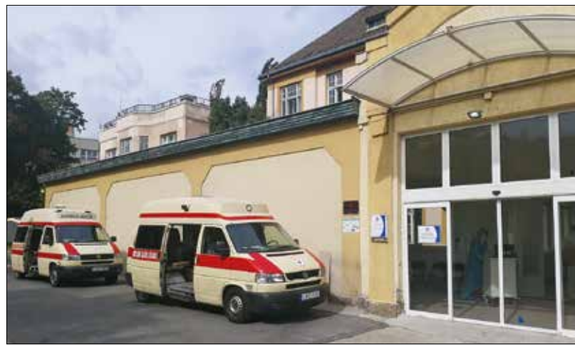
Az új kórházi részleg bejárata