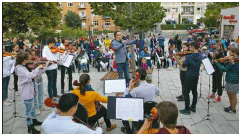
Szép számú érdeklődő előtt léptek fel a Solti György Zeneiskola növendékei

Másodszor szervezett támogató közösségi programot a XII. kerületben a Hegyvidéki Kulturális Szalon és a Hegyvidéki Szociális Központ Demencia Irodája, hogy helyi szinten is felhívják a figyelmet a demenciára, amit jelentős részben az Alzheimer-kór okoz. A szellemi leépülés, az elbutulás komplex körkép, egyaránt megkeseríti a beteg és a hozzátartozók életét. Leginkább a gondolkodási és megértési funkciók károsodásával jár, méghozzá átfogó jellelleggel és fokozato-