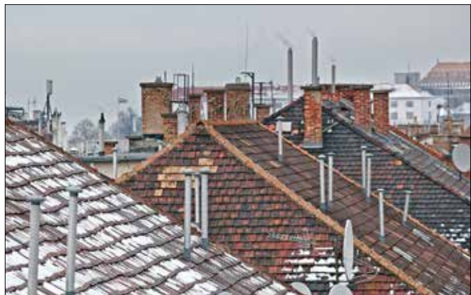
Nagyon fontos rendszeresen ellenőrizni és tisztítani az ingatlanhoz tartozó tüzelőberendezés égéstermékének elvezetésére szolgáló kéményt, a tartalékkéményt, a bekötő- és összekötő elemeket, valamint azok tartozékait