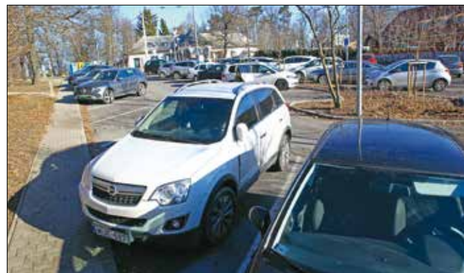
Az új parkolóban találnak maguknak helyet az autósok – ha akarnak...