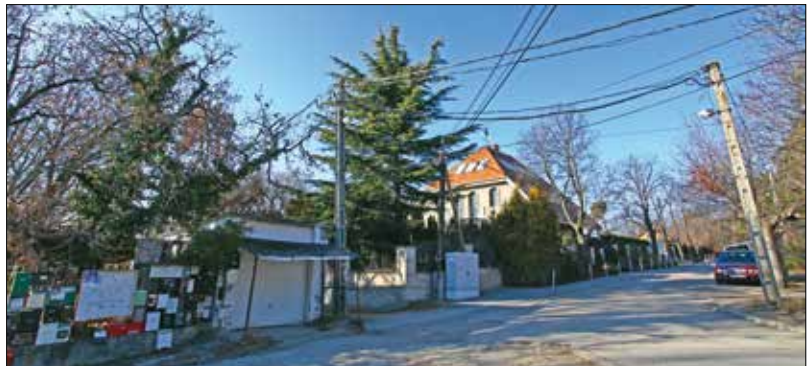
A Magas úton forgalomlassítást és az áthajtási tilalom érvényesítését kéri a lakók

feloldja-e az önkormányzat a 2022 márciusában lejárt változtatási tilalmat.