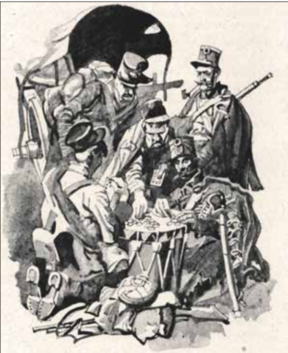
Honvédek pihenés közben egy korabeli grafikán

A Hadtörténelmi Múzeum egy évvel később már tényként kezelte ezt, miután 1927 tavaszán szakértői beazonosították a helyszínt. A Magyarság című lap így számolt be erről: „A Magyar Hadtörténelmi Múzeum és a magyar újságíró-társadalom együttes ünnepséggel jelölte meg azt a helyet, ahol Ábrányi Emil, a magyar újságírók nesztora, az első haditudósítást írta a szabadságharc idején. A mai Böszörményi-út és a Csörsz-utca sarkán, 1849 május havában Nagy Sándor József tábornok tartott hadiszállást és ide küldte ki Ábrányi Emil »újdondászt«, azaz mostani néven riportert, a Kossuth-kormány