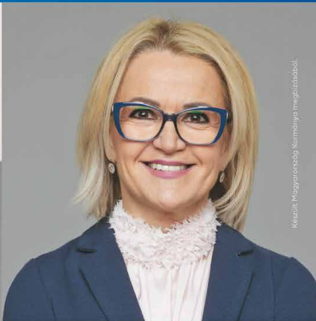
Készült Magyarország Kormányának megbízásából.