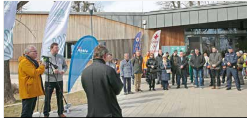
A „Találkozunk újra a Normafán!” programsorozat megnyitója

A Hotel Olimpia elbontása is kellett ahhoz, hogy elterelhesék a forgalmat az új Eötvös útra, és elkészülhessen egy nagyméretű parkoló, míg a régi helyén a többi között az ikonikus réteses kap helyet. Remélhetőleg mielőbb fel-