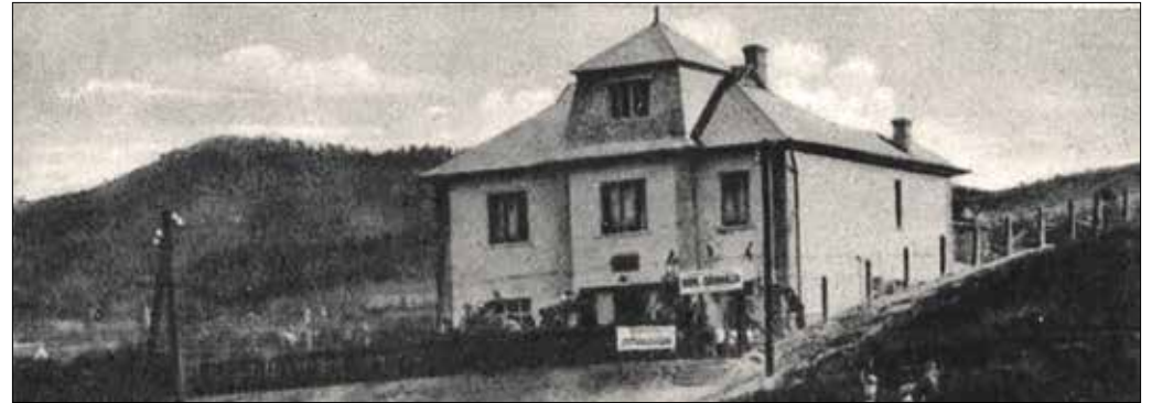
A „honvéd markotányosnőhöz” címzett bor- és sörház, ahol egykor Nagysándor József hadiszállása volt

ő korai halálával, ami a nevezetes riport megjelenése után kilenc hónappal következett be.