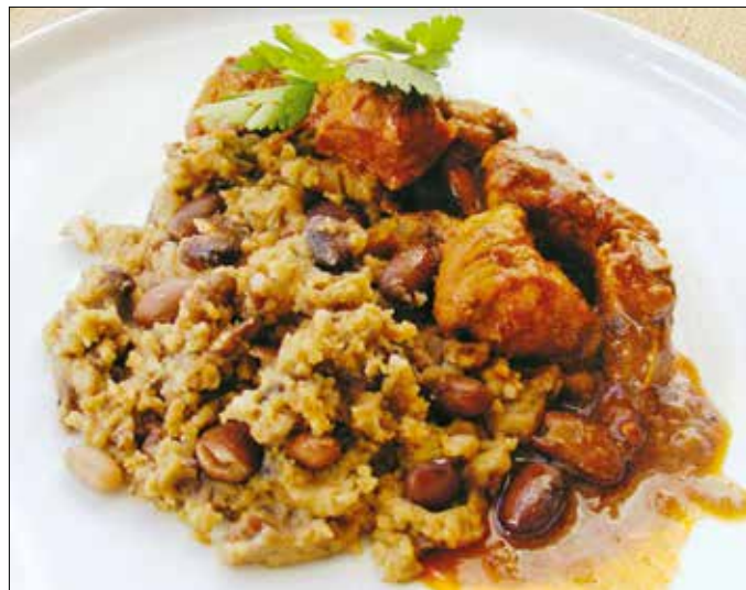
Az egyik legismertebb burgenlandi babos étel a babsterc

A babból készült ételek közül ez az egyik legismertebb. Általában magában eszik a burgenlandiak, aludtjejjel vagy savanyúsággal, de nem böjtos időkben pörkölt mellé