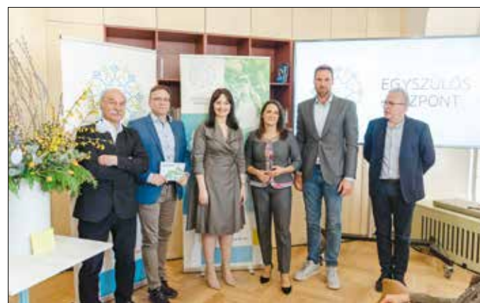
A Budai Egyszülős Családi Segítő Központ megnyitójának résztvevői

„Magyarországon félmillió gyermek él egyszülős családban. Az egyszülőség a legtöbb esetben nem értékrend, nem választás kérdése, bárki kerülhet ilyen helyzetbe. Van, aki elvállal, van, aki özvegyen marad, van, aki már várandósan ma-