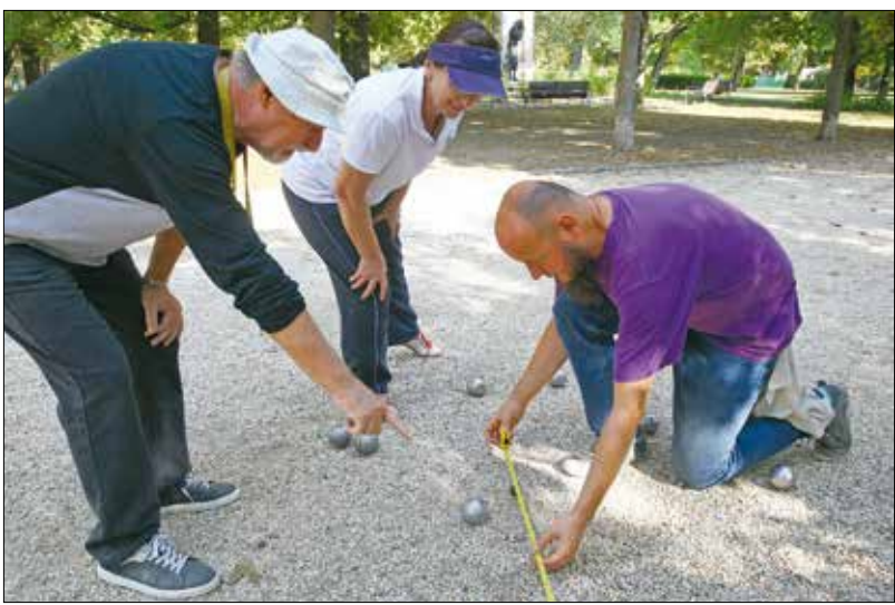
A francia eredetű pétanque rendkívül szórakoztató szabadtéri játék

A szervezők kifejezetten várták a demenciával élőket, hogy a betegsé- gükből gyakran adódó bezárkózást oldva ebben a védett körben töltsenek el egy kellemes délelőttöt.