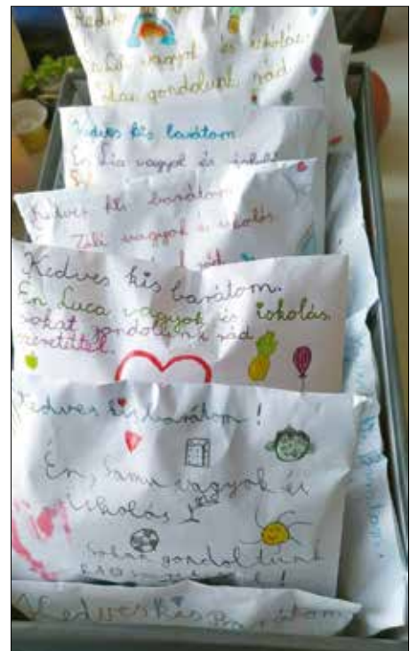
Szeretettelborítékok a Lauder iskolából

„A Magyar Máltai Szeretetszolgálat kezdeményezését karoltuk fel a diákkormányzat köz-