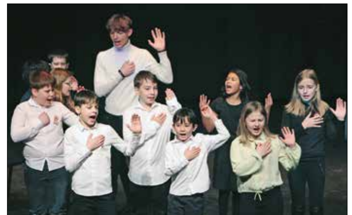
Részlet a Németsölgyi Általános Iskola diákjainak ünnepi műsorából