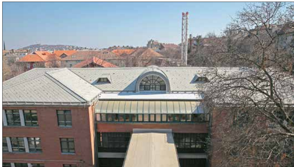
A tető- és strangfelújításnak köszönhetően megszűntek a beázások és a dugulások a Németvölgyi iskolában