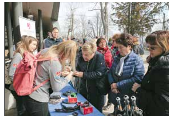
Pulzsmérés az Út az egészséghez program keretében