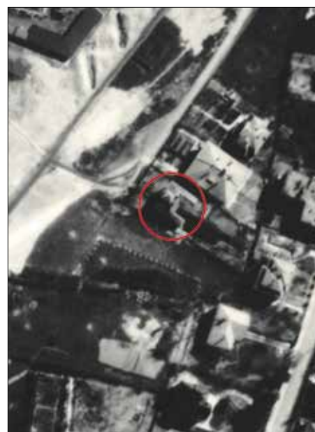
Légi fotó az épületről 1944-ből