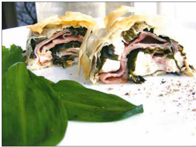
Medvehagymával is készülhet finom rétes

A babsterchez a szárazbabot közel egy liter vízben puhára főzzük. Közben egy vastag falú, széles edényben a lisztet sóval, nem túl erős lángon állandóan kevergetve, szárazon aranysárgára pirítjuk, majd a forrásban lévő bab levéből