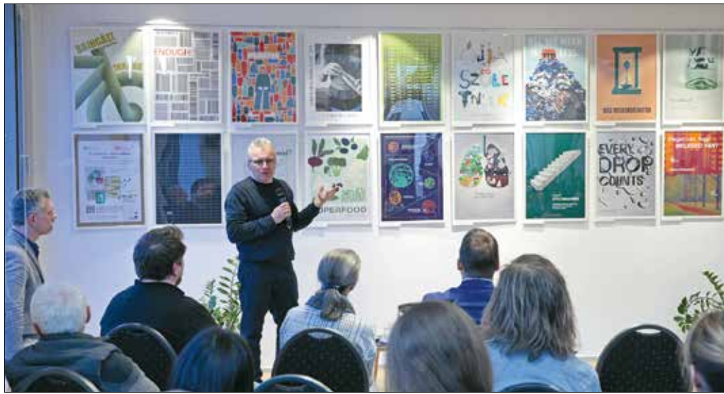
A polgármester szerint fontos, hogy felismertük az ökológiai problémát, csak így van esélyünk válaszokat adni