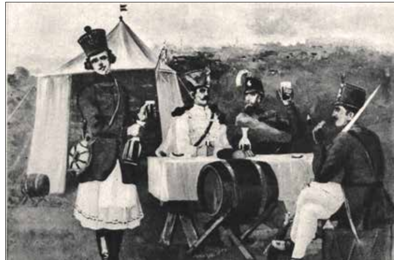
A vendéglő cégére a markotányosnői sátorral és tábori jelenettel

tányos sátrat, a katonákat, akik szalonnát és piritóst sütöttek, a zsírt pedig kenyérré csöpögtették, valamint Görgeyt, akinek „sudár