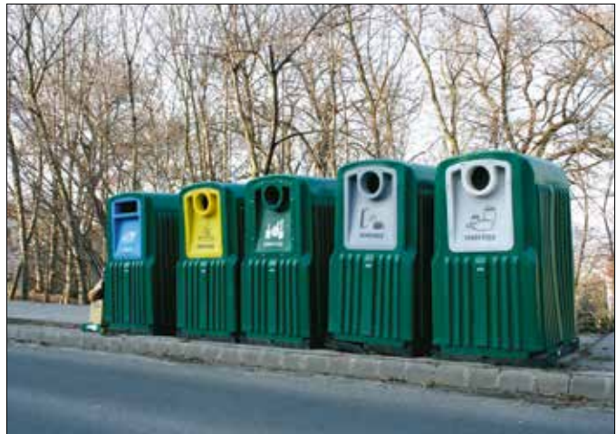
A budai oldalon folyamatosan csökken a teljes szelektív szigetek száma

A döntés nem a teljes sziget megszüntetése lett: megmaradnak az üvegyűjtő konténerek, hiszen az üveg jelenleg az egyetlen olyan szelektív gyűjtött hulladéktípus, amit nem lehet bele-