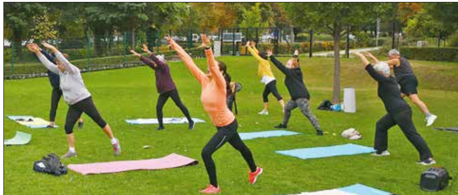
Akár az Aktív Hegyvidék program részeként zajló aerobikórák is felírhatók „zöld receptre”