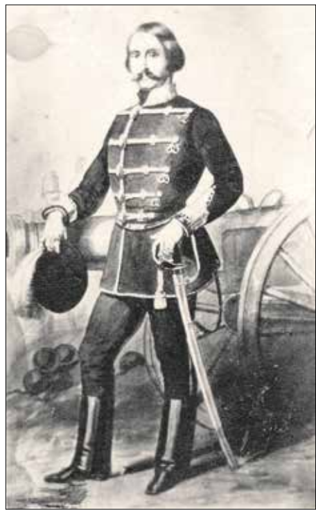
Nagysándor József tábornok

Miután a tulajdonos megtudta ezt, az 1925-ben felépített házát átalakította, és 1927 májusában megnyitotta a „honvéd markotányosnőhöz” címzett vendéglőt. A Magyar Hírlap hosszú cikkben mutatta be az új helyet: „Nevezetes napja volt szombaton a jó budai polgároknak. Az I. kerületben, a Böszörményi út és a Csörsz utca sarkán levő domboldalon felépült az új kocma. Azt avatták ünnepi céccal. Smaragd zöld színű domboldalon áll a kocma frissen vakolt épülete, a délutáni nap beanyozza galambszürke falait. Megcsillogtatja vörös cserép tetejét. Szombaton már a kora délutáni órákban megindult a jökevdű budai polgárok karaván-