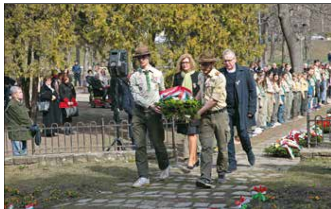
Koszorúzás a Gesztenyés kertben, a '48-as obelisznál