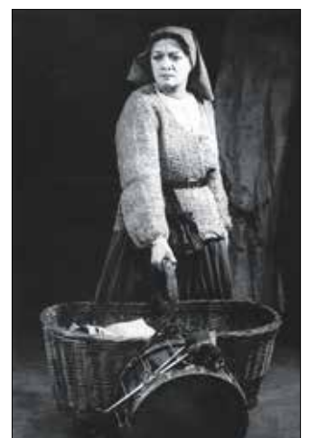
Kiss Manyi mint markotányosnő

Bizonyára bérbeadták a helyet, mivel 1948-ban az új tulajdonos