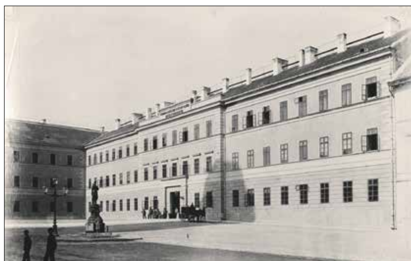
A Hadtörténelmi Múzeum épülete az 1900-as évek elején

deglőnél. A Pesti Hírlap így írt a kezdeményezésről: „Egy történelmi emlék megörökítése. Budán mozgalom indult meg az iránt, hogy emléktáblát létesítsenek azon a környéken, ahol 1849. május 4-től május 21-ig Nagysándor József vértanú honvédtábornok – mint az első hadtest parancsnoka – tartotta hadiszállását, amikor Görgey Artúr fő-