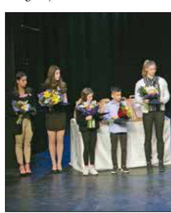
Ebben az évben is díjazta az önkormányzat az itt élő legjobb edzők, sportvezetők, testnevelők, sportoló diákok munkáját