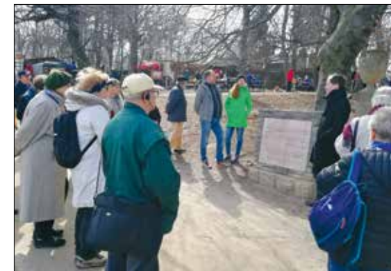
Helytörténeti séta a programindító rendezvényen