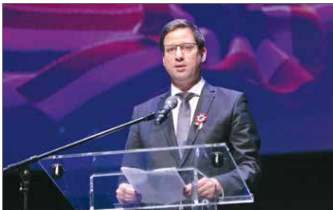
Gulyás Gergely miniszter mondta az ünnepi beszédet