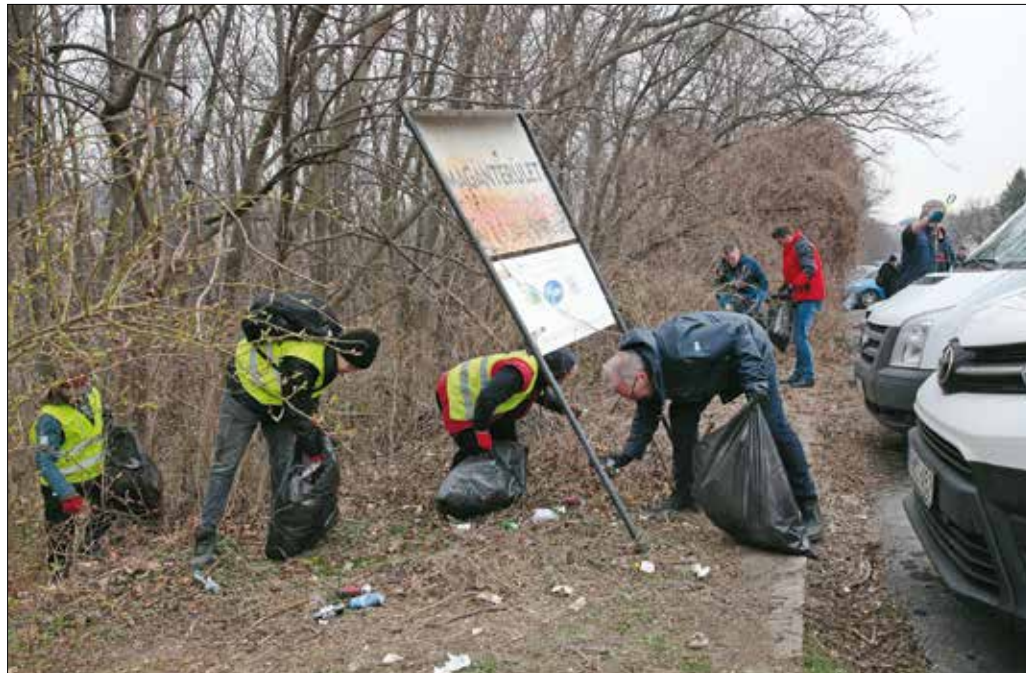
Ezúttal a Kútvolgyi út felső részén lévő parkoló melletti erdős részt tisztította meg a munkacsoport

„Arra kérjük a lakosságot, hogy a hulladékgyűjtő szigetek környékét ne használja szeméttárolónak, és a zöldhulladékot se dobálja a fák