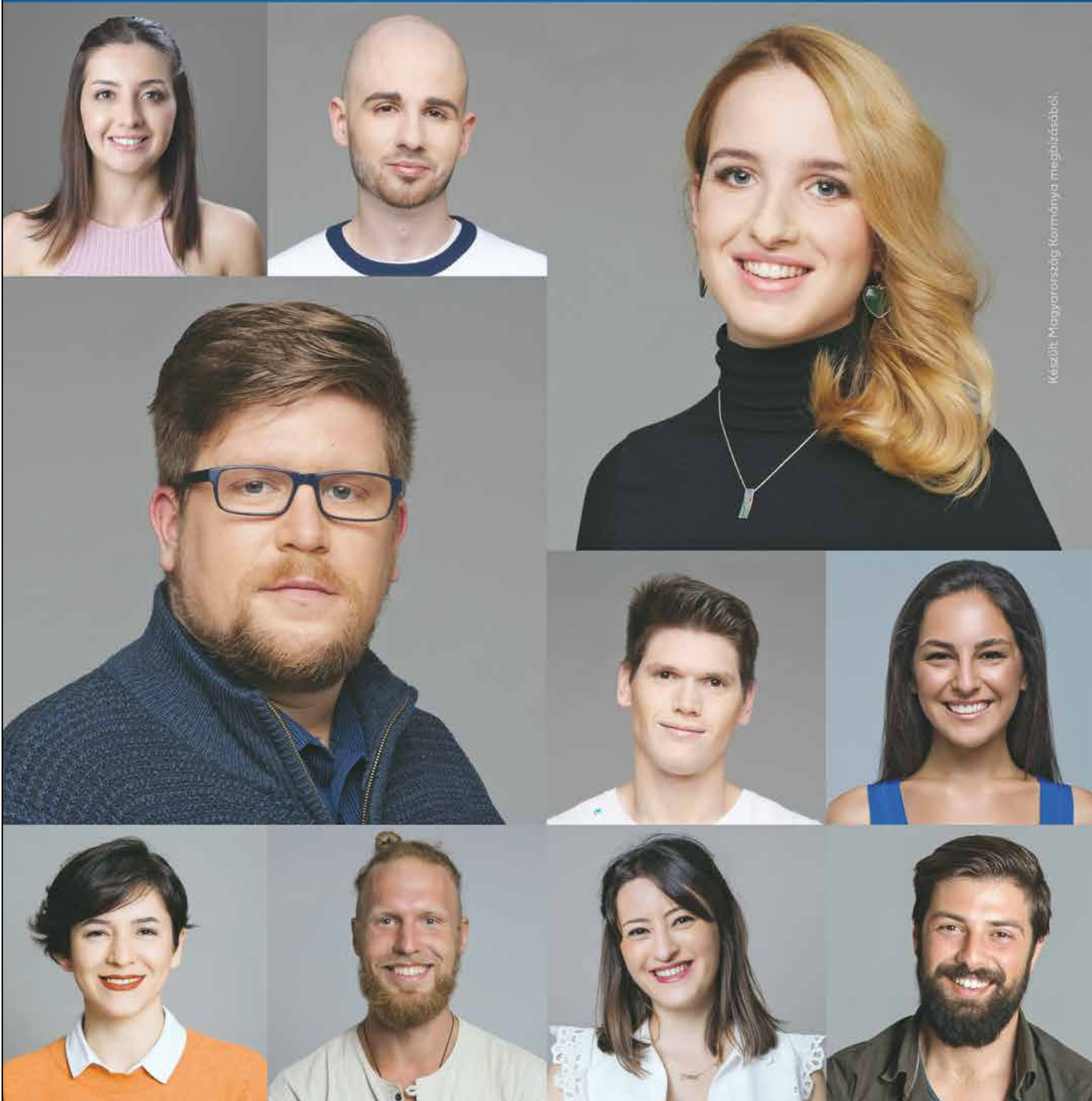
Készült Magyarország Kormányának megbízásából.