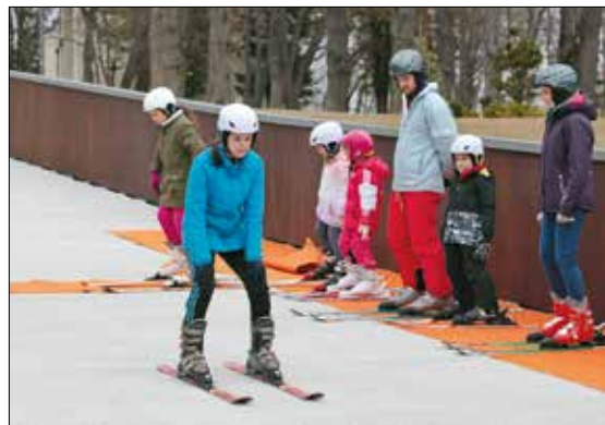
Négy évszakos pályán lehet megtanulni a síelés alapjait

Hosszú évekig romlott a Normafa állapota, aztán találkozott a kormányzat szándék és az önkormányzat elképzelése, lett