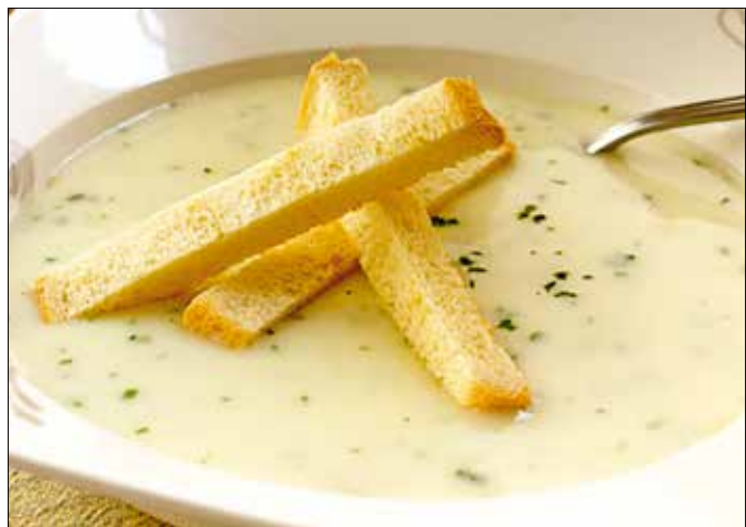
Az eredeti recept szerint Neuburgerrel készül a borleves

A híres szőlő- és bortermező vidéken magától értetődő, hogy alkalmasint borral készült leves is kerül az asztalra. Természetesen a bor valamilyen burgenlandi fajta, például Neuburger – az eredeti recept szerinti leves is ezzel készül.