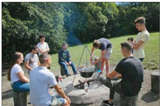
A kirándulóhelyeken sem szabad most bográcsolni, tüzet rakni

A tilalom idején tilos tüzet rakni az erdőkben, fasorokban, facsoportokban és ezek kétszáz méteres körzetében – akkor is, ha ebben a zónában már lakóingatlanok vannak, és ott gyűjtanánk tüzet. A