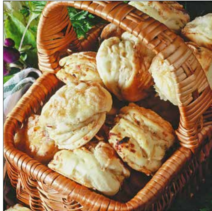
Hasonlít a tőpörtyűs pogácsához, mégsem az: bab van benne

Végül a megkelt tésztát beliszteztetett gyúródeszkán kb. ujjnyi