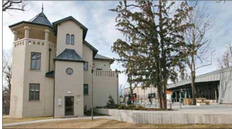
A Normafa Park Látogatóközpont belül-kívül impozáns épületkomplexuma

„A Normafa ügyében sok volt ugyan a vita, de egyik sem párt-