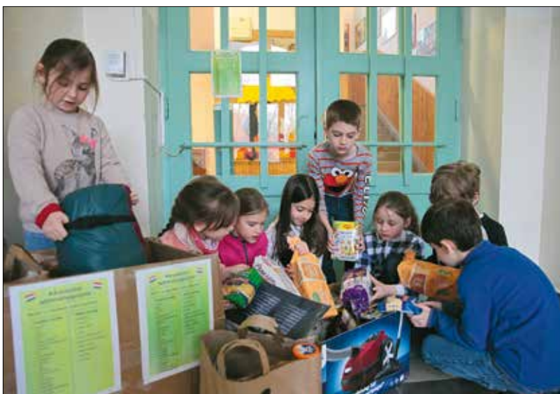
A Zugligeti Általános Iskola diákjai is gyűjtöttek a menekülteknek

veszik igénybe ezt a lehetőséget. Mindenkinek biztosított a napi háromszori étkezés és a tisztálkodási lehetőség.