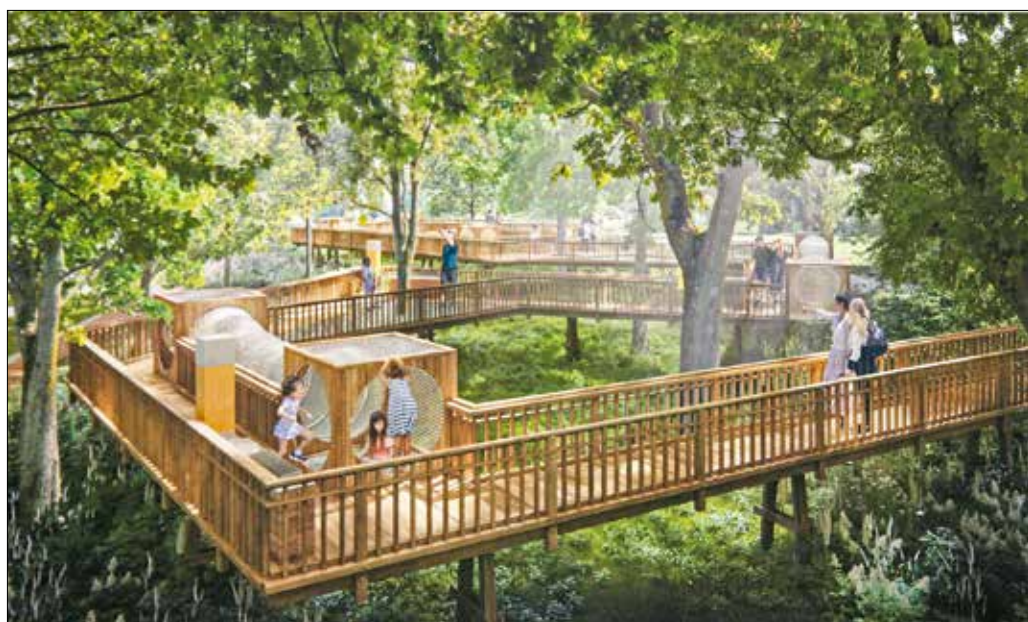
A győztes pályamű készítői biológiailag sokszínű területet terveztek

gezte a városmajori tervpályázat végeredményét Fűrjes Balázs, a Miniszterelnökség Budapest és a fővárosi agglomeráció fejlesztéséért felelős államtitkára, a bírálóbizottság elnöke a Moholy-Nagy Művészeti Egyetemen megtartott eredményhirdetésén.