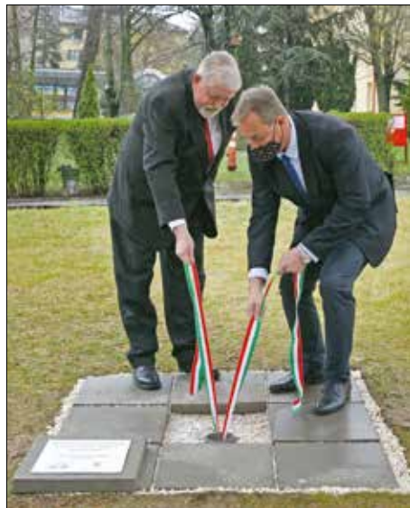
Kásler Miklós és Polgár Csaba

Intézetben (OOI). Ahogy arról korábban mi is írtunk, az intézménynek 2019-ben saját forrásból, mintegy 400 millió forintból újította fel a fej-nyaksebészeti osztályt, 2020-ban pedig az Egészséges Budapest Program keretében 1,5 milliárd forintból új sugárterápiás eszközöket szerzett be.