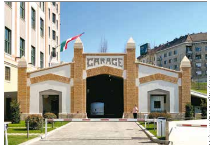
A kertben álló garázsépület is megújult

A nagyközönség számára viszont létrejött a Pénzmúzeum az egykori postahivatal tércsoportja helyén, a Csaba utca sarkán. Valószínűleg sokan jártak már annak