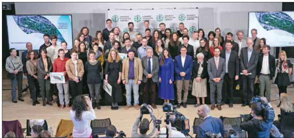
A pályázatban részt vevők és a zsűri tagjai