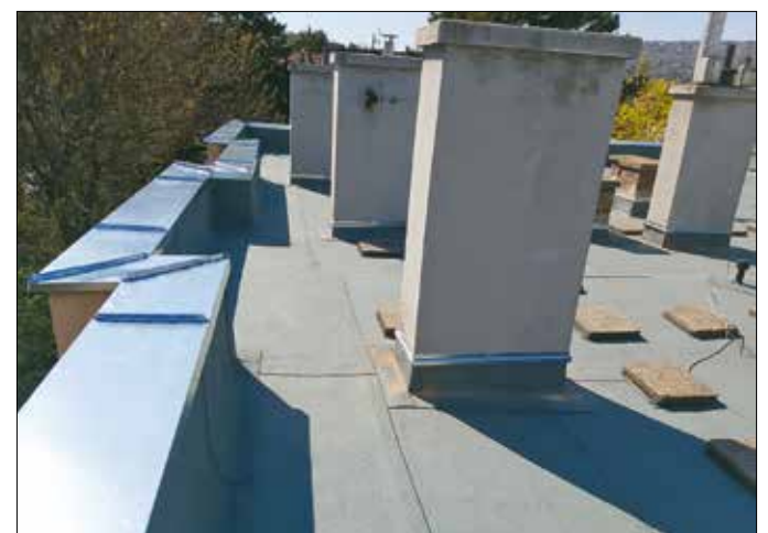
A tető szigetelésével megszűnt a beázás a Hegyalja út 136–138.-ban