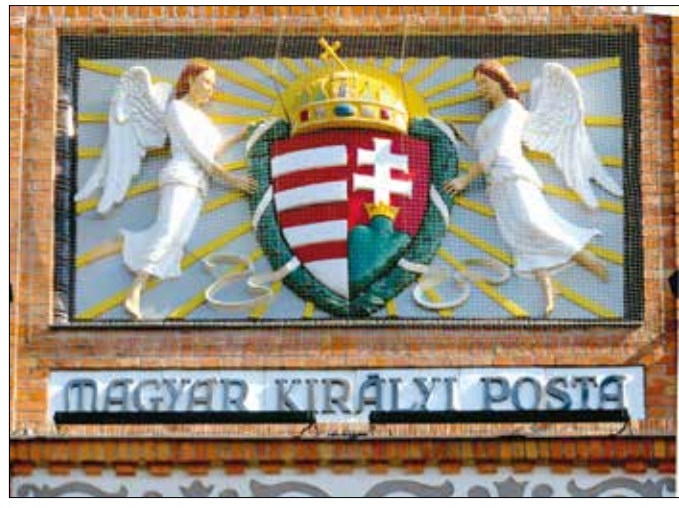
A helyreállított koronás magyar címer is a homlokzatot díszíti

Ekkor kezdődött meg a Postapalota intenzív felújítása, aminek a befejezését