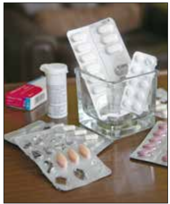
Vigyünk vissza a felesleget!

Pedig a gyógyszer – ideértve a csomagolását is – veszélyes hulladék! A talajba, talajvízbe kerülve károsítja az élővilágot. Egy nemrégiben elvégzett vizsgálat kimutatta, hogy strandszezon idején a Balatonban még magasabbra