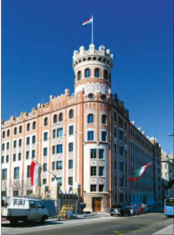
Az épület 2009 óta műemléki védetség alatt áll

A Pénzmúzeum bejárata a Széll Kálmán tér új elemének tekinthető aluljáró felől közelíthető meg. A Várfokegyház utca alatt, a tér szintjén kiépített rövid átjárót – a Postapalota egykori építész tervezőjéről – Sándy Gyula köznevezték el. A falfületeit és mennyezetét csillogó, rozsdamentes acéllemez-