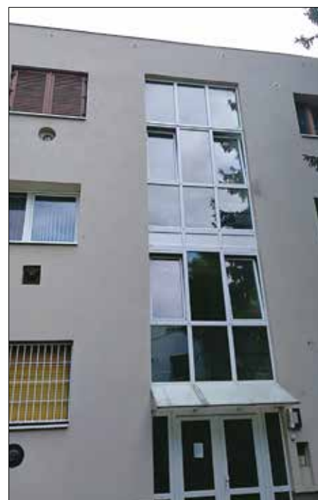
Határőr út 70/c: új homlokzati szigetelés