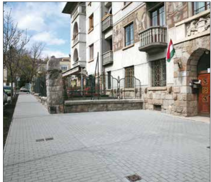
Új térkö díszíti a Kiss János altábornagy utca egy szakaszát

A közműnyomvonal feletti járdahibát javították a Németszőlgyi út 47–49. között, ahol aszfaltburkolat készült. Az utolsó simításokat végzik a Moha út feletti Név-