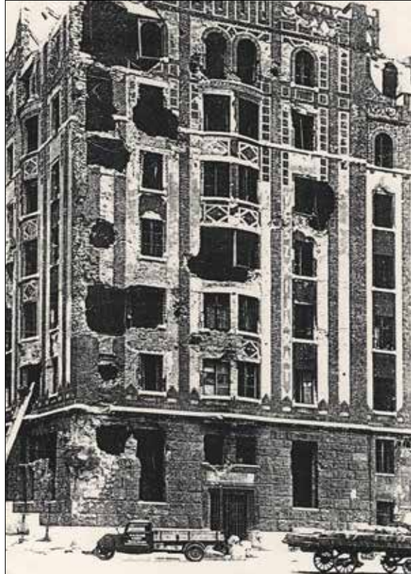
Szomorú látvány 1945-ből

A Csaba utcai sarok felőli épületrészen fél évszázadon át működtek a kerület máig hiányzó legnagyobb és legforgalmasabb postahivatala és a posta vezérigaz-