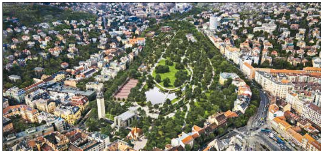
Az új Városmajor természetközeli pihenőkert és családbarát szabadidőpark lesz, zöld tisztásokkal

kutyáknak. Az élménypark helye a fogaskerekű telephely mellett, a pihenőparktól távolabb lesz, így biztosítva, hogy a kutyák jelenléte ne okozzon konfliktust a parkhasználók között.