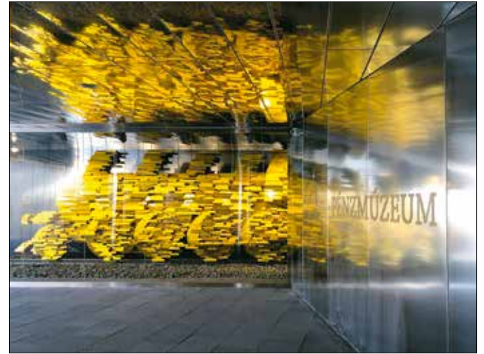
Szöke Gábor Miklós szobrászművész alkotása, az Aranyvonal

A nagyközönség számára viszont létrejött a Pénzmúzeum az egykori postahivatal tércsoportja helyén, a Csaba utca sarkán. Valószínűleg sokan jártak már annak