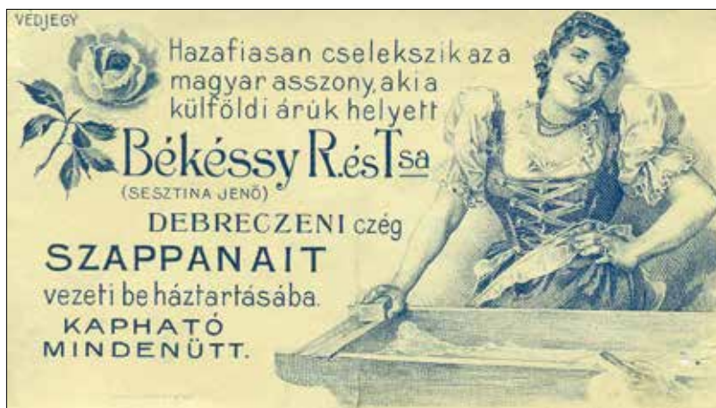
Szappanreklám a régmúltból

gozott. „Budának állandóan jó vize van, amely a pesti édes, bágyadt ízű kútvíznél határozottan jobb és a benne levő különböző ásványi anyagok következtében az egészségre hasznosabb is. A Király-kút és a Sváb-kút kemény vize ugyanis a