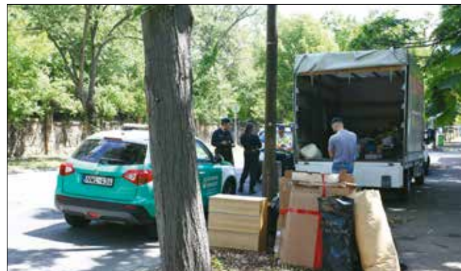
Illegális hulladéklerakást hiúsítottak meg a közterület-felügyelők

kaptak, a jármű ellenőrzésekre pedig kiderült, hogy a lomok tulajdonosai a szomszédos második kerületből jöttek. Úgy gondolták,