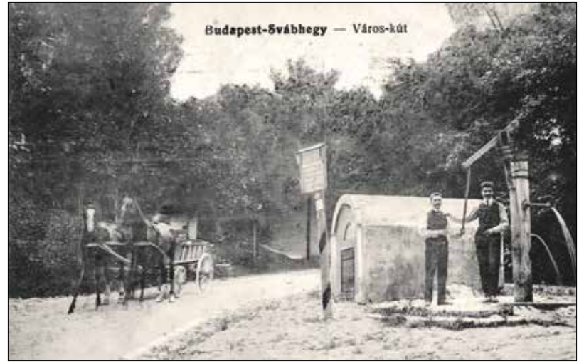
Az egyik legjelentősebb hegyvidéki kútház, a Város-kút a mai napig megtekinthető

A Hegyvidéki Helytörténeti Gyűjteményben „Hegyvidék 2 O – Egy csepp történelem” címmel június 1-jén megnyíló időszaki kiállítás megemlékezik a víz múltbéli hasznosításáról, a Duna-víz-árusokról (hosszabban lásd 2022. április 19-i lapszámunkban!), a víz- és a jégzállítás nehézségeiről. A Hegyvidéken számos nagyobb vendéglő és akár módosabb villa