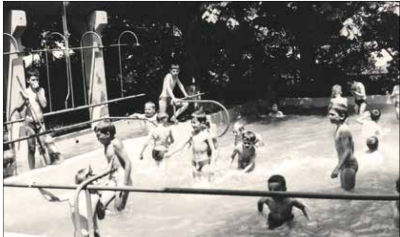
Számos fürdő, medence segítette a gyerekek fizikai és mentális gyógyulását

A kiállításon látható lesz egy hatalmas, 4 méteres térkép is, azokkal a forrásokkal, kutakkal, vízzel kapcsolatos épületekkel, amelyek a Hegyvidéken találhatóak, továbbá a vízművektől kölcsönzött svábhegyi víztorony makettje, valamint egy vízszállító kocsi is,