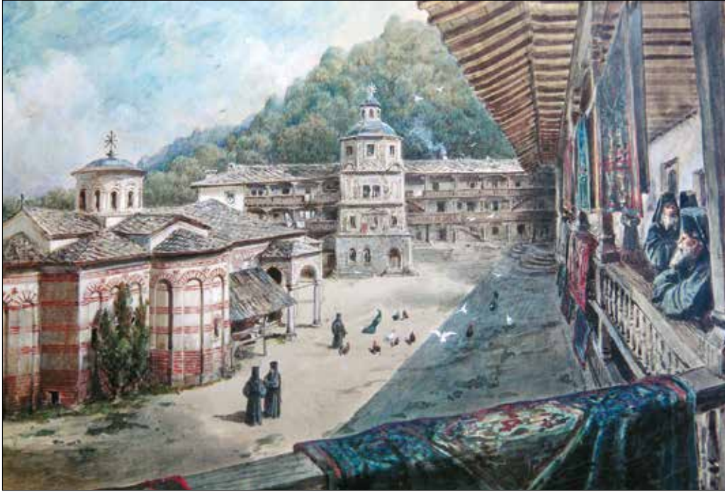
„Felix Kanitz utazásai a Balkánon: A bolgár föld a 19. században – illusztrációk” címmel látható a Hegyvidéki Önkormányzat és a Budapest XII. kerületi Bolgár Nemzetiségi Önkormányzat közös kiállítása a heggyvidéki polgármesteri hivatalban (Böszörményi út 23–25.). Megtekinthető: június 10-ig, ügyfélfogadási időben, hétfőn 13.00–17.30, szerdán 8.00–16.00, pénteken 8.00–12.00 óráig. (Képünkön: Trojani kolostor)