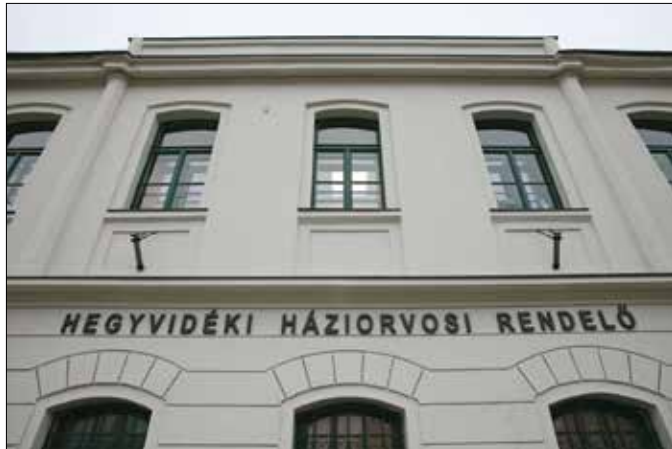
Az elmúlt hat évben tizenhat hegyvidéki háziorvosi rendelő újult meg