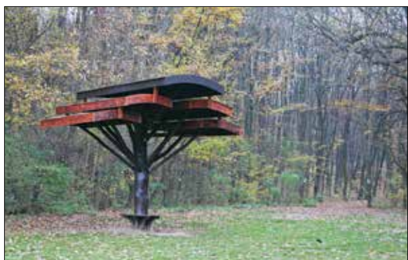
Megújult a Szilfa-tisztás egyedi esőbeállója

Új padok, asztalok, kerékpártárolók és mindezek mellett egy izgalmas, de biztonságos erdei játszótér is gazdagították az elmúlt években a Budai-hegység kedvelt kirándulóhelye, a Szilfa-tisztás infrastruktúráját. A fejlesztések mögött a Pilisi Parkerdő és a Magyar Természetjáró Szövetség közös erőfeszítései álltak. A felújítási program záróakordjaként nemrég, a Budakeszi Vadaspark jóvoltából, az eredetihez hasonló formájában újult meg a majdnem húsz éve épült, egyedi esőbeálló.