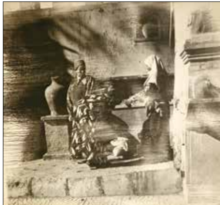
A kút (1997)

akkor még nehezen befogadható dolgot hozott létre. Technikai kalandjainak tapasztalata a mozaik, a zománc és a freskó után a fotó-