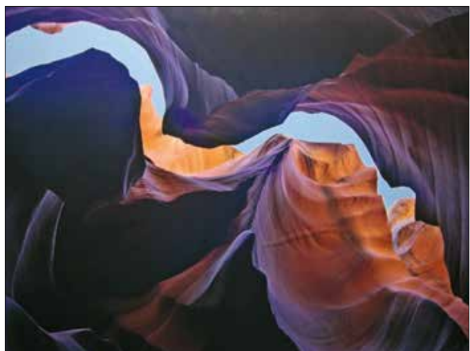
Antelope Canyon, Arizona

■ A „Tahin Gyula 1942” című kiállítás december 4-ig látható, szerda és vasárnap kivételével naponta 16.00–22.00 óráig. Cím: Galéria 12 Kávézó és Borbár, Hajnóczy József utca 21.