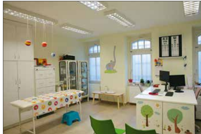
Vidám környezetbe érkezhettek a gyerekek