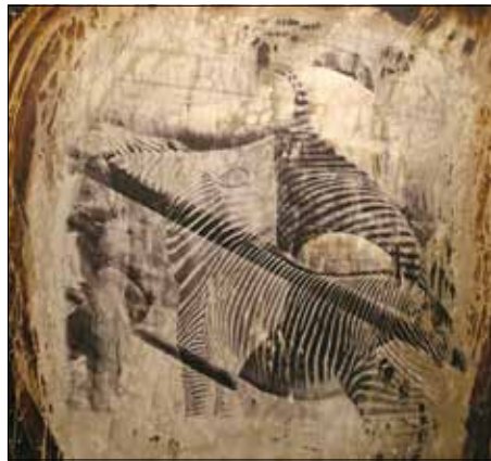
Braun Etelka metamorfózisa (1993)

Kezdetben a fotográfálás és a táblakép elkészítése két külön ere-