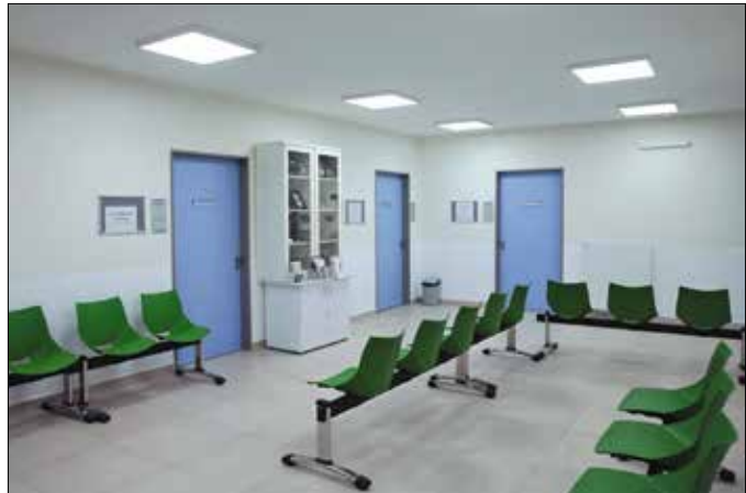
Az új rendelő is skandináv stílusú arculatot kapott

A 10. számú felnőtt háziorvosi egység új rendelője bruttó 379 723 319 forintból készült el, amit az önkormányzat saját forrásból, valamint az Egészséges Budapest Program során elnyert 300 millió forintból finanszírozott. A kivitelezés a Pannonterv Kft. tervei alapján valósult meg. (Folytatás a 3. oldalon)