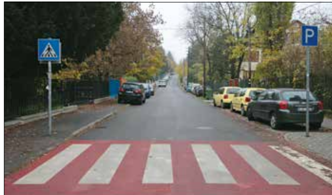
Az iskolák miatt sok autó jár és parkol a Virányos útnak ezen a részén

Kútvolgyi úti rendelő gyorsabb eléréséhez” – hívta fel a figyelmet Pokorni Zoltán, hozzátéve, hogy tizenöt éve nem volt itt komolyabb felújítás, amit már többször kértek az iskolák és a lakók.