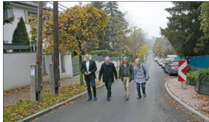
Önkormányzati forrásból és állami támogatással valósult meg a beruházás

négyzetméteren térkövet rakott le a kivitelező, emellett az Istenhegyi út előtt lévő sebességcsökkentő küszöböt is megújította.