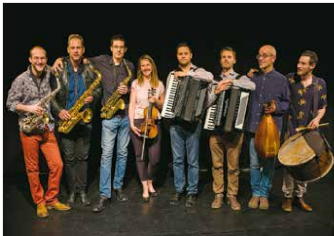
A Fanfara Complexa is fellép az adventi vásáron

■ Az adventi vásárhoz kapcsolódó további programokról következő lapszámunkban olvashatnak.