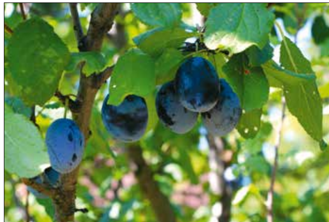
A szilvafák igénytelen, fagyűrő növények

A facsemeték átvételekor sokan érdeklődtek, kell-e komposztot, trágyát tenni a gyümölcsfák alá, az ültetődömböbe. Nos, elsődlegesen a fákkal kapott trágyát érdemes felhasználni, de általánosságban a szakemberek azt ajánlják,