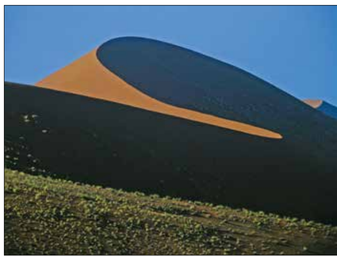
45. számú dűne, Namíbia

A nyolcvanadik születésnapját ünneplő Tahin Gyula a Lőrinczy György nevével fémjelzett generációval lépett színre, és a debreceni Műhely '67 kiállítással tekintette át a fotóművészet megújulásának lehetőségeit. A kiváló műtárgy-fotós sokat megjelenít a progresszív fotográfia tanulságaiból féltucatnyi városalbumának képeiben is, amelyek közül a Szentendre 1981-ben elnyerte a Magyar Fotóművészek Szövetsége különdíját és a „Szép Magyar Könyv díjat. Lenyűgöző precizitással megalkotott kompozíciói eredeti, mérnöki szakmájára utalnak. Monumentális hatást keltő, gondosan felépített struktúrájú képei gazdag tónusúak, leggyakrabban a természeti és az épített környezet jelenik meg rajtuk.