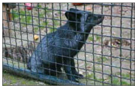
Új parklakó Gerry, a szemrevaló prémróka

Bár a kisvasút nem a park területén fut, állatokat azért lehet látni útközben. A mintegy 200 mé-