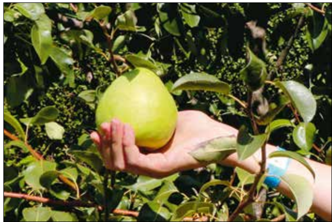
A körtefákat párban érdemes ültetni

A véralma, bár a naposabb déli országrészből származik, jól fejlődik a hegyvidék déli domboldalain is. Kissé gyanús hangzó elnevezését a magház körüli elszíne-