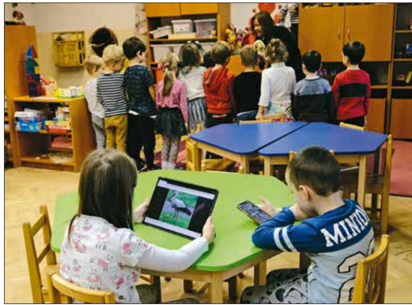
A digitális tér megkönnyíti a kapcsolattartást, de rombolhatja az emberi viszonyokat

szont sokan unalmasnak tartják ezeket a foglalatosságokat. Holott a közösen végzett alkotás közben egymással beszélgetnek, vitatkoznak, kompromisszumokat kötnek, fejlesztik a személyes kapcsolataikat, és ennek felnőttként jó hasznát vehetik.