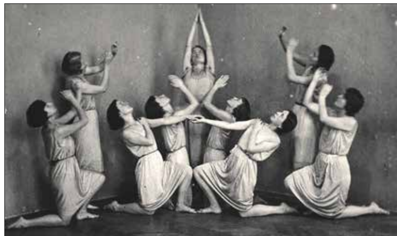
...amely improvizatív mozdulatokkal kiegészített színpadi produkciókat mutatott be

Később, külföldi hatásokra, a mozdulatpszichológiával kezdett el foglalkozni, és létrehozta Budapesten az Orkesztikai Iskolát, amelyet 1915-től 1944-ig vezetett.