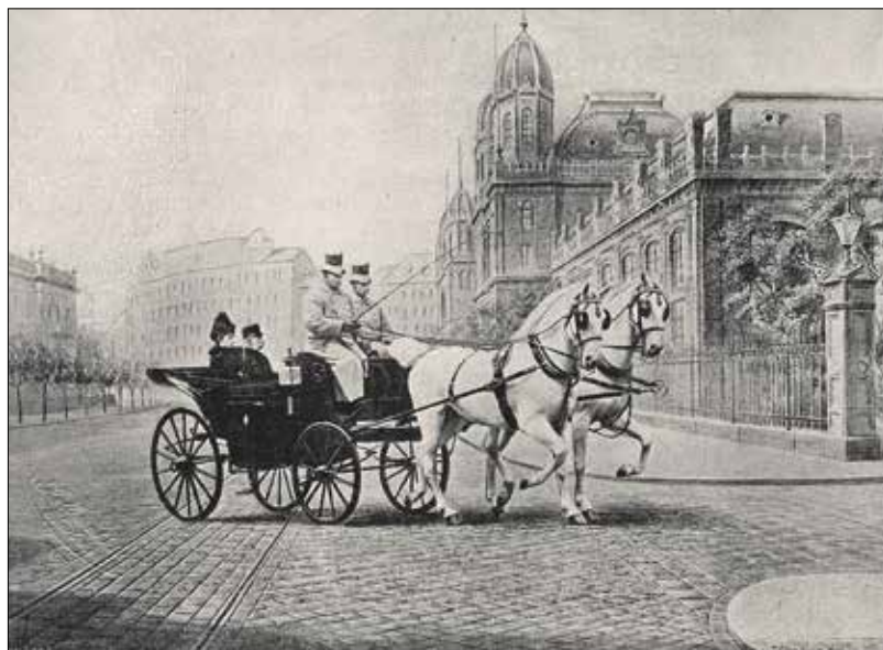
I. Ferenc József és Erzsébet királyné 1897-ben

A 19. század jelentős alakja volt Erzsébet királyné, akit sokan a magyarok legnagyobb barátjának tartottak. Sisi nem keveset tett ezért, mivel egyébként I. Ferenc József osztrák császár és magyar király feleségének lenni nem jelentett egyenes utat a szívekbe, sőt, érthető lett volna a