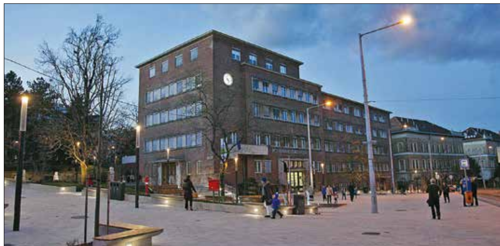
Az építészeti szakmai díjjal is elismert Városháza tér népszerű közösségi találkozóhellyé vált az elmúlt években

Amennyiben az egy főre jutó jövedelem nem éri el a 165 ezer forintot, az önkormányzat térítésmentesen végzi el a munkát, 165 ezer és 220 ezer forint közötti jövedelem esetén pedig a költségek 50%-át a pályázónak kell megfizetnie. Azok számára, akik a 220 ezer forint feletti jövedelemkategóriába esnek, az önkormányzat csak az átalakítási munkák tervezését végzi el térítésmentesen. Az idei pályázatok benyújtási határ-