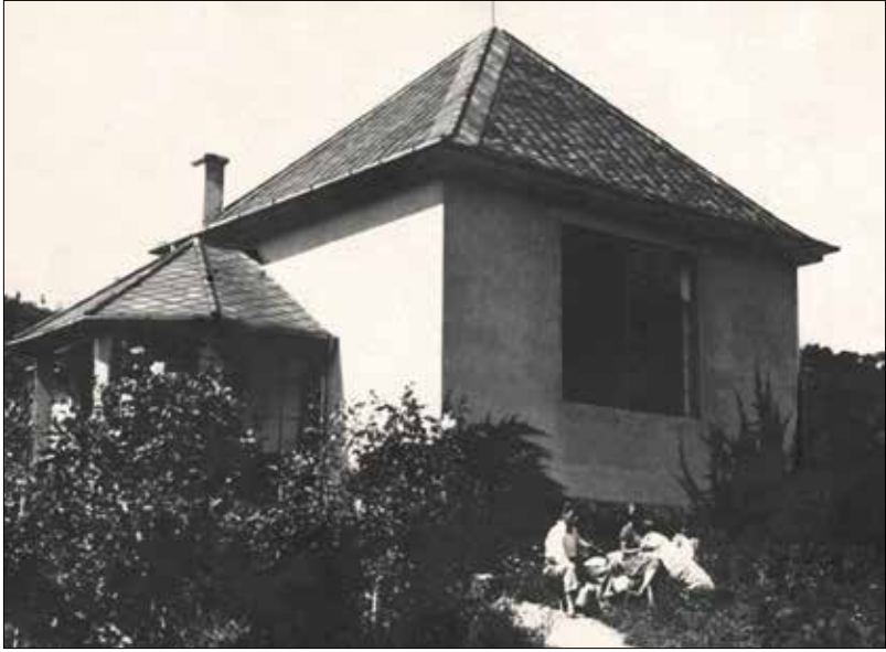
Csinszka és Márffy Ödön háza a Szamóca utcában

vele szemben érzett esetleges ellenszenv is. Erzsébet azonban jó politikai érzékével, kedves természetével és nagy adakozói, segítői szándékával hamar kivívta a magyarok tiszteletét.