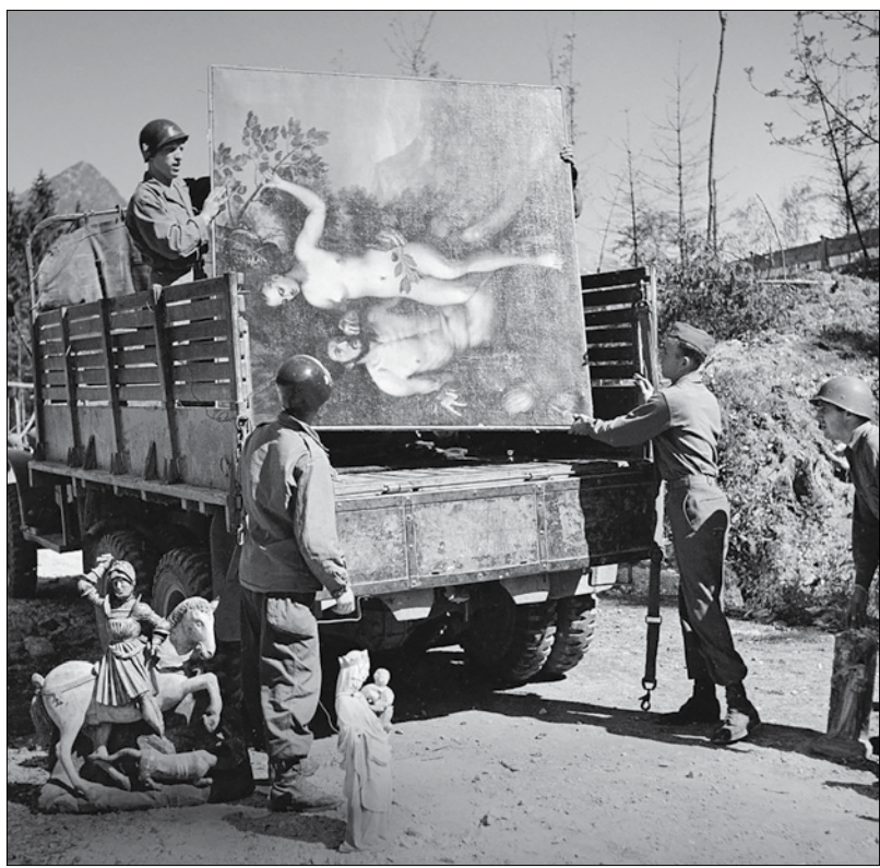
Göring műtárgyainak elszállítása Berchtesgadenből 1945 tavaszán

rális Szalonban, valamint a Lóvasút Kulturális és Rendezvényközpontban várta programsorozat a minőségi feltöltődésre vágyókat. Természetesen mi is bekapcsolódunk ebbe.