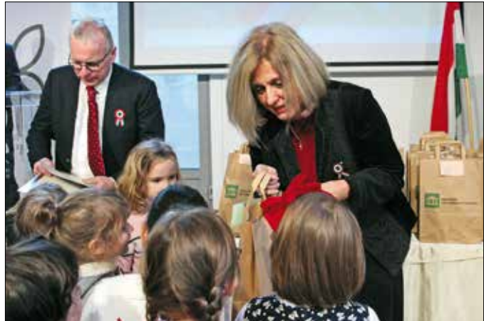
Óvodásokat és általános iskolásokat is díjazott az önkormányzat