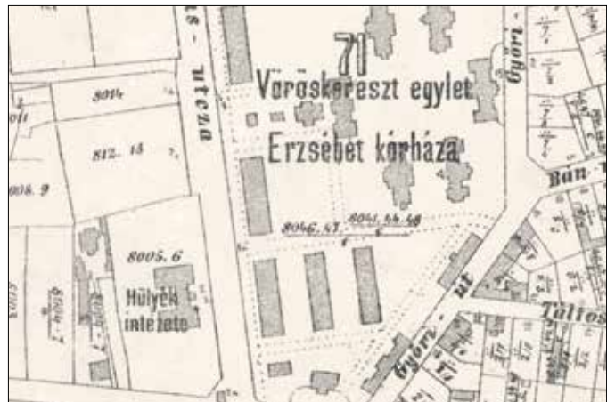
Az – akkori elnevezéssel – Hülyék intézete egy korabeli térképen

Annyi bizonyosan elmondható, hogy a fogyatékosok ma ismert gyűjtőfogalma az ókorban még nem létezett, a süketeket, vakokat, értelmi vagy testi fogyatékosokkal élőket nem illették azonos kifejezéssel, más-más társadalmi megítélés alá eshettek. A tehetséges látásérzékenyek az ókori Egyiptomban például zsenikkelént magas megbecsültséget örvendhettek. A fogyatékosokkal élőket a számér-asszír-babiloni kultúrában sem feltétlenül kerültek marginális helyzetbe.