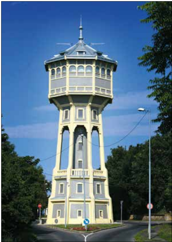
Az egyedülálló Eötvös úti víztározó még ma is működik

A Szentháromság téri egykori kút tetőjén Pallasz Athéné szobra díszítette, amely a bontás után kalandos körülmények között került egy hegyvidéki villa kertjébe. Onnan az azt karbantartó és a szomszédban lakó kertész kapta meg munkája ellenértékéért. A kőtövezés után sem jutott több megbecsülés a műalkotásnak, nem esztétikai, inkább gyakorlati hasznót hajtott: száradó ruhát teregettek a városvédő lándzsájá-