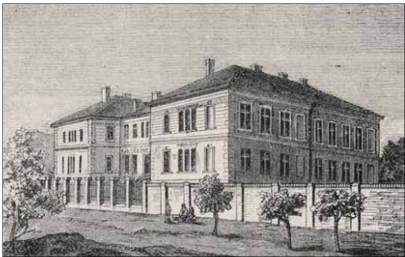
A Frim Jakab-féle intézet Alkotás utcai épülete 1888-ban...

A zsidó erkölcs kifejezetten tiltotta a hátrányos helyzetűekkel