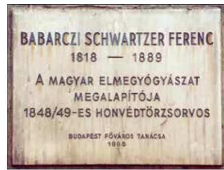
Emléktábla Schwartzter Ferenc tiszteletére

szerepet fejlesztését pedig történetek újramondásával segítette. Szerinte a nevelés alapja az engedelmesség, a rendre, a társas életre szokta-