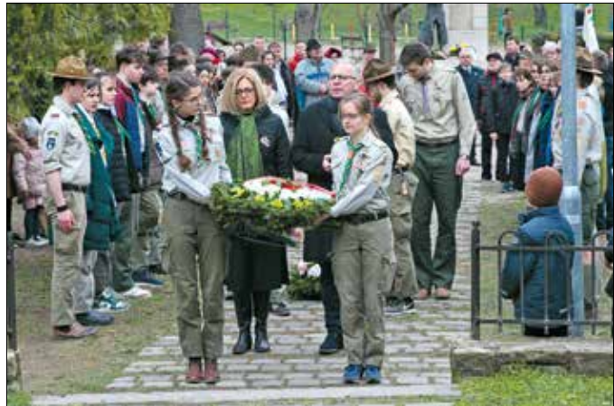
Koszorúzás a Gesztenyés kertben, a '48-as emlékoszlopnál

Ő maga sokkal szívesebben vágya „olyan unalmas országok történelmére, amelyek el tudták kerülni a forradalmat, mert szót tudtak érteni egymással a fent és lent lévők, meg tudtak állapodni, így jutottak előrébb, szemben azokkal, akiknek vérell, halállal kellett bármint is kikényszeríteni”. (Folytatás a 3. oldalon)