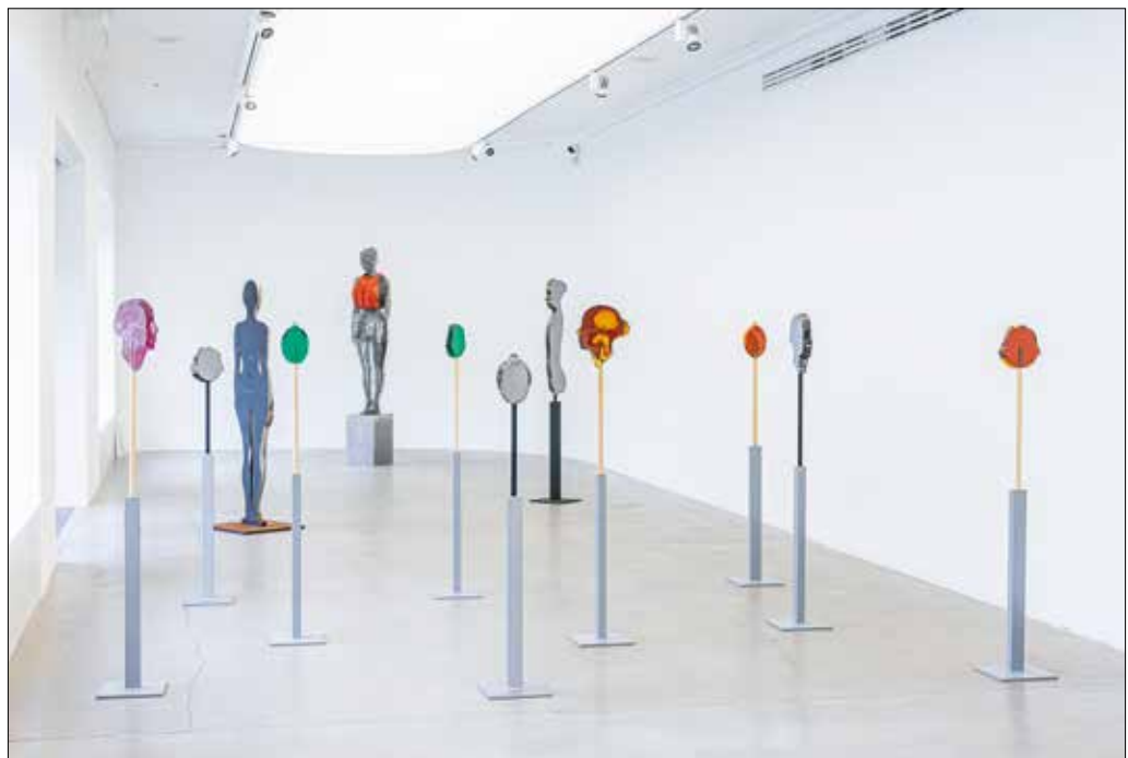
Majoros Áron Zolt: Influence / Hatás (kiállításenteriór)

– Minden idők legnagyobb műkincsrablásai kerülnek reflektorfénybe április 18-án. A téma napjainkban különösen érdekes, mivel a háborús sokszor nem csak a terület-szerzés eszközei, mindig voltak kulturális céljaik is, a legyőzött fél identitásának megsemmisítése kultúrájának elrablása által. A Hegyvidék Galéria kétrészes program-sorozata a valaha volt legnagyobb és legszervezettebb műkincsfosztogatással, a második világháború idején a német nemzetiszocialista vezérek által elkövetett műkincsrablásokkal, valamint az ellopott