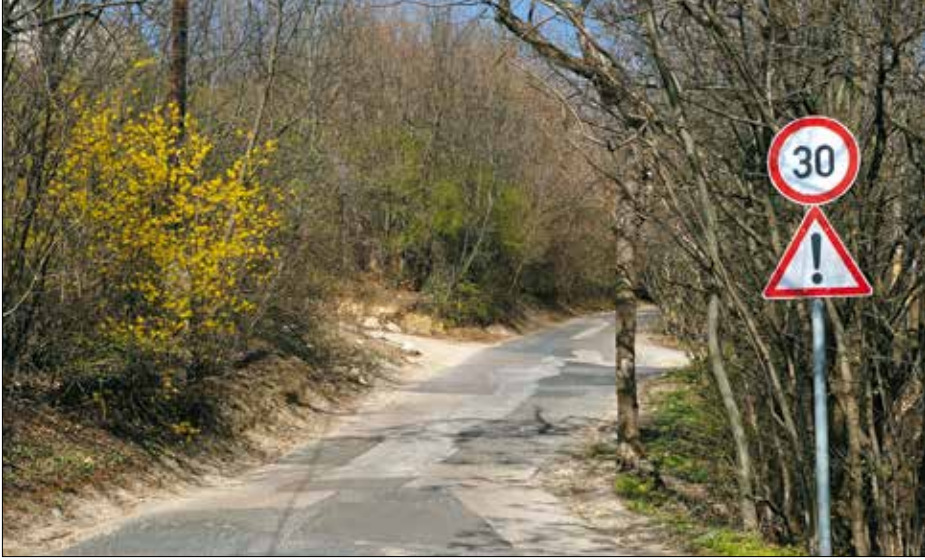
A Rác Aladár út legfelső szakasza jelenleg zöld területként szerepel a fővárosi tervekben

Megvalósul a Magasúti köz 200 méteres szakaszának felújítása a Lidérc utca és a Törökbálinti út között, továbbá szintén új aszfaltot és szegélyeket kap a Határőr út az Abos utcától a Goldmark Károly utcáig. Az előbbiekhöz hasonlóan ugyancsak állami támogatás felhasználásával szépülhet meg nyáron a Nárcisz utca a 2–26. között. Ott teljes kopóréteg-felújít-