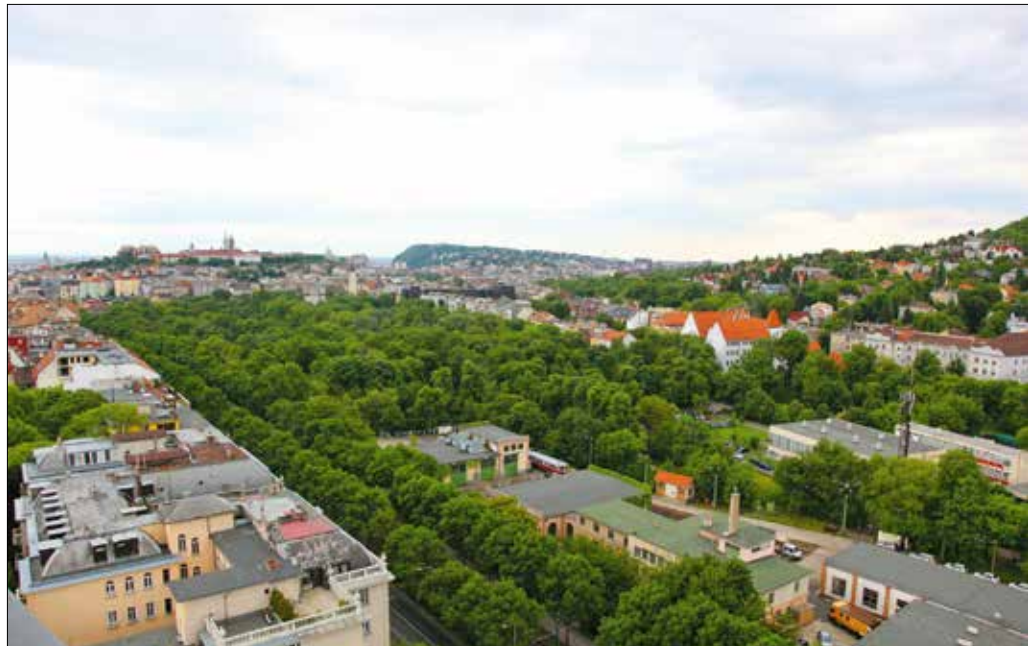
A Hegyvidék alsó, sűrűn lakott részének egyik legnagyobb „oxigéntermelője” a városmajori park

A sajtótájékoztatón elhangzottak szerint a főegyházmegye rövidesen lezárja a vállalkozók pályázatát, így várhatóan hűvös után megkezdődhet a kivitelezés. Erdő Péter bíboros abban bíz, hogy a szeptemberi Mária-ünnepre megnyílnak az új kápolna.