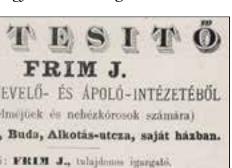
Magyar Pedagógiai Szemle, 1888

gokkal teli kertben sétálhatnak. A kezelteteket három osztályba sorolták be. Egy hónapi kezelés és ellátás első osztályon 80, másodikon 60, a harmadik osztályon pedig 40 pengő forintba került. A beteg ezért tisztalakt, egészséges ételmezt kapott, és az árban benne volt a mosás, a gyógyszer- és az orvosi kezelés költsége is. Mai szemmel nézve meglepően szigorú volt a fegyelem. A kapus harangszóval jelezte, hogy reggel mikor kötelező kikelni az ágyból, este pedig lefeküdni aludni. A nagy létszámú személyzet folyamatosan szemmel tartotta az itt élőket.”