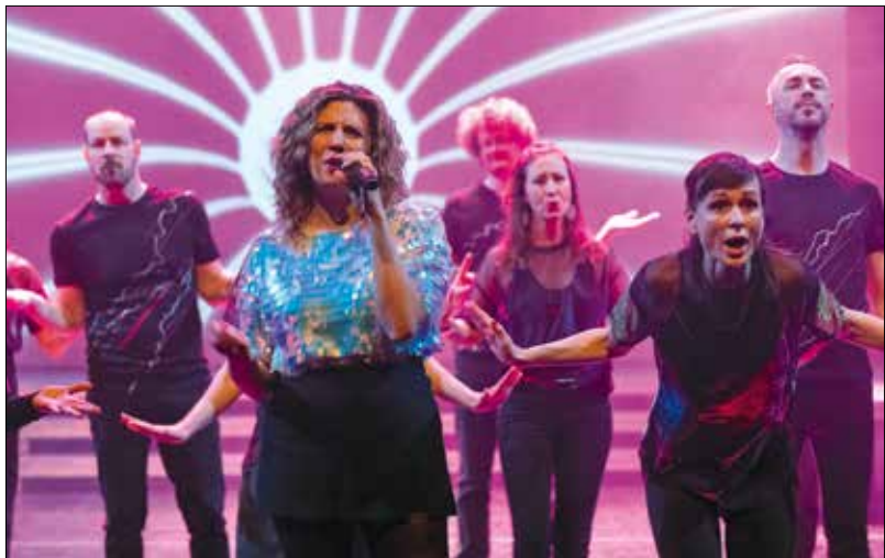
Személyes hangvételi koncerttel készül a Soharóza és a Jónás Vera Experiment

– A látogatók ezúttal sem maradtak kultúra nélkül, több hegyvidéki intézmény is befogadta a MOMkult és a Jókai Klub programjait. Milyen volt az együtt töltött három hónap?