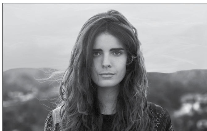
Zóra: „Tánc az indulat és az érzékiség határán”

– Igyekezünk minden program sorsát a legnagyobb odafigyeléssel kezelni, és megnyugtató