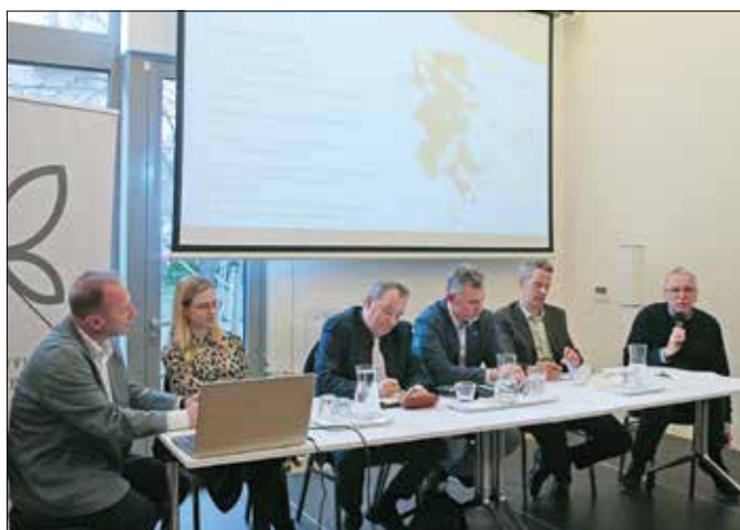
A fenntarthatóságról beszélgettek a legutóbbi fórum résztvevői

Az önkormányzat ingyenesen hívható zöldszáma: 06-80/200-907