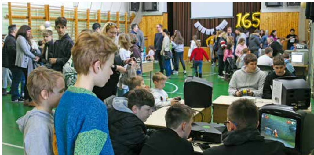
A fiatalok a régi gépeket megismerve tapasztalhatták meg az óriási technikai fejlődést

konzolforradalmának meghatározó darabjait.