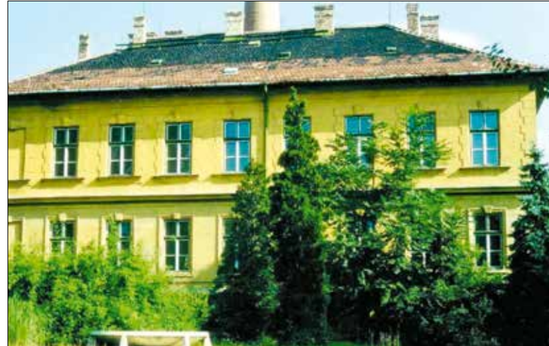
...és nem sokkal azelőtt, hogy a Magyar Optikai Művek épületeivel együtt lebontották