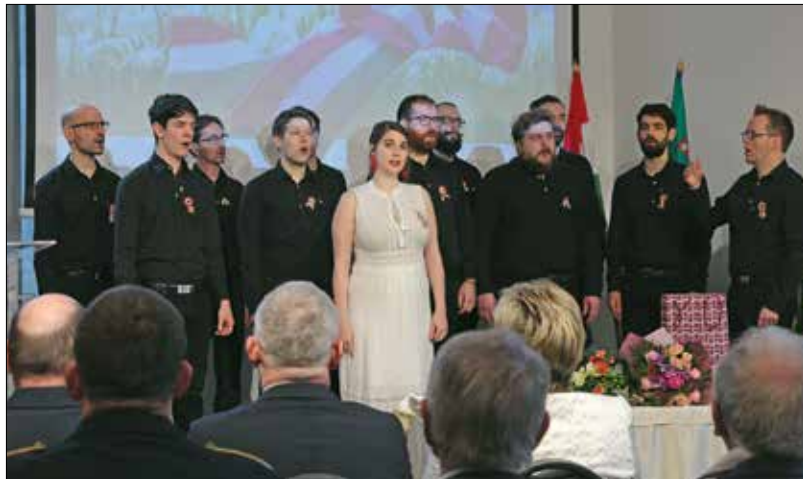
Az ünnepi műsor részeként az Oriolus kórus Kossuth-nótákat énekelt