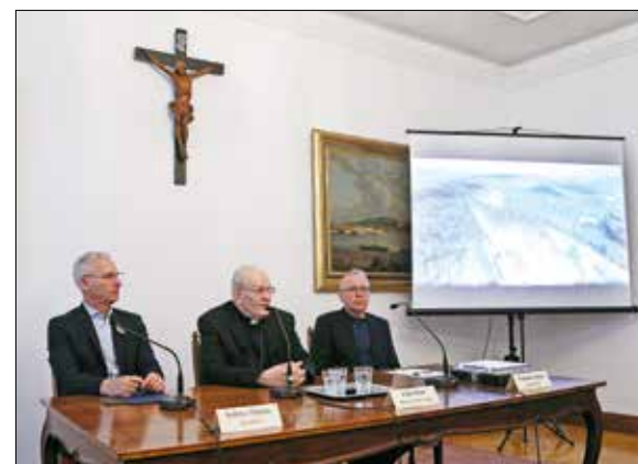
Soltész Miklós, Erdő Péter és Pokorni Zoltán a sajtótájékoztatóon

A Nemzeti Közfoglalkoztatási Egyetem Víz- és Környezetpolitikai Tanszékének vezetője szerint egy önkormányzatnak nincs elég forrása ahhoz, hogy kellő mértékben támogatást nyújtson a lakosság energetikai beruházásaihoz, ugyanakkor tanácsadó szerepet tölthet be, elősegítve azt, hogy a legoptimálisabb beruházások valósuljanak meg a lakóépületekben. (Folytatás a 3. oldalon)