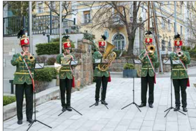
A Zenélő Budapest Huszár Rézfúvós Együttes a megemlékezésen