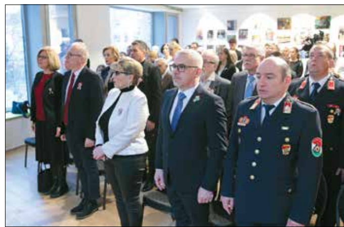
A Hegyvidéki Kulturális Szalonban tartott megemlékezés résztvevői