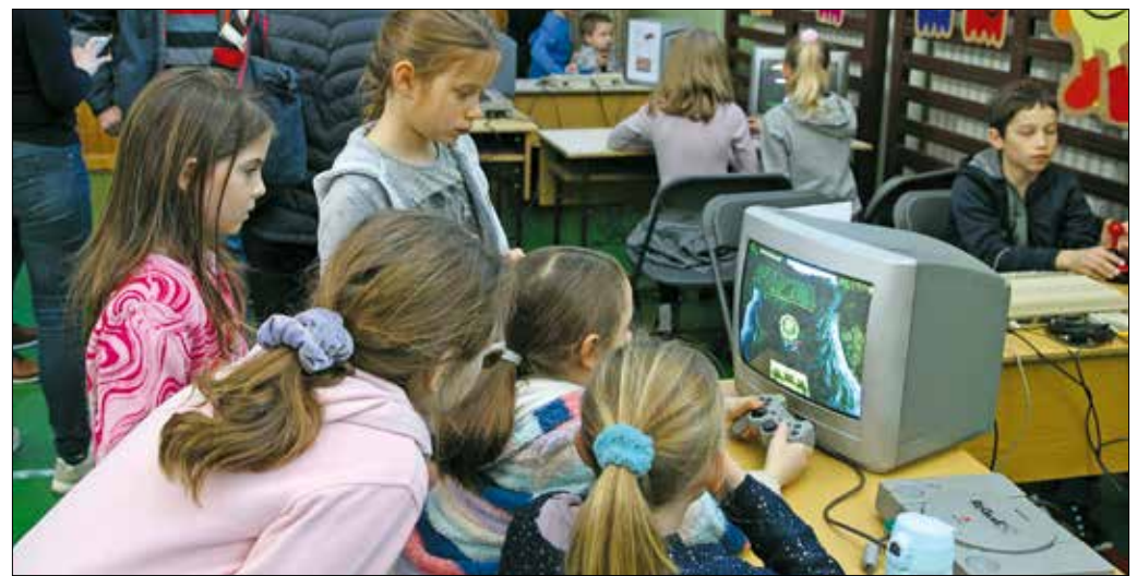
Hiába elavultak ezek az „ősi” számítógépek és monitorok, még mindig nagy élvezet játszani rajtuk!

A programszervezéshez sikerült megnyerni az ország egyik legjobb, régi számítógépekkel és konzolokkal foglalkozó szakemberét és az általa létrehozott ReGamEX céget. Ők biztosították a kompu-