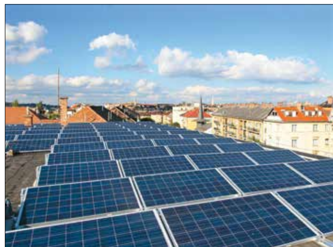
Jó megoldás lehet a közösségi napelemparkok létrehozása is