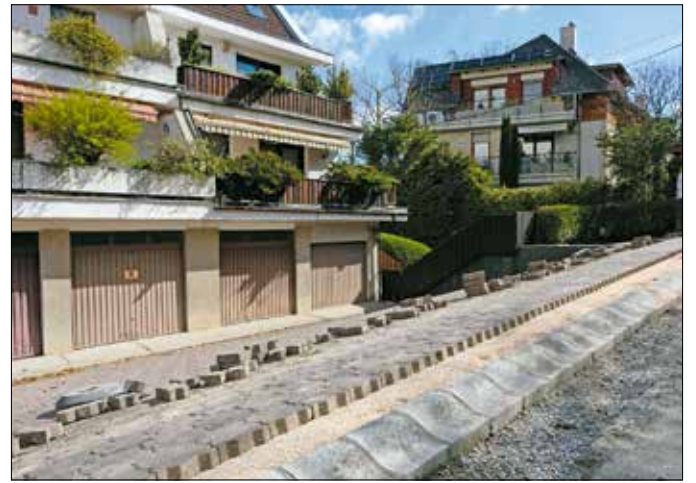
Megújul az Ada utca egy 150 méteres szakaszon

erősítését. Évekkel ezelőtt nagyjából a felég elkészült, ám egy magánépítkezés miatt megakadt a munka, most viszont hamarosan teljes hosszában megújulhat az utca.