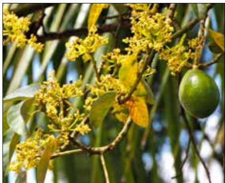
Virág és termés

Pedig az avokádó nemcsak értékes, telítetlen növényi zsírokat nagy mennyiségben tar-