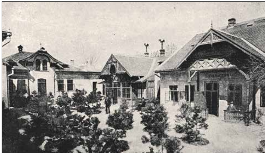
Schwartzter Ferenc magántébolydája 1852-ben költözött a mai Kék Golyó utcába

szerepet fejlesztését pedig történetek újramondásával segítette. Szerinte a nevelés alapja az engedelmesség, a rendre, a társas életre szokta-