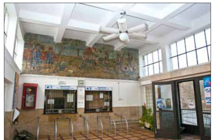
Korabeli neves művészek festették az állomások freskóit

Az 1980-as évek végére igen rossz állapotba kerültek a sínek,