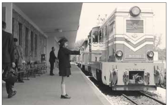
A mai napig csak jó tanulók jelentkezhetnek gyermekvasutasnak

Az úttörők mellett eleinte cserkészek, egyetemisták és munkások is önkéntes munkában vettek részt az építésben. Az első szakasz végállomása a terveken még Szent Anna kápolna megállóként szerepelt, ám végül Előre állomás lett a neve. Az első szakasz alig négy