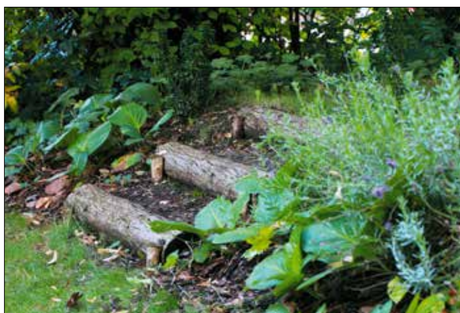
Kerti lépcső természetes anyagból

Társasházak, lakásszövetkezetek jelentkezését várja a Hegyvidéki Önkormányzat az összesen 10 millió forintos keretösszegű udvarzöldítési pályázatára a XII. kerület sűrűn lakott részéről, a Városmajor utca–Kék Golyó utca–Németvölgyi út–Stromfeld Aurél út–Csörsz utca által határolt területről. Az elnyerhető forrás szerteágazó módon felhasználható az épületekkel körülvárt belső udvarok kialakítása, beültetése és szépítése során: a tervezéstől akár a csúnya betonburkolatok bontá-