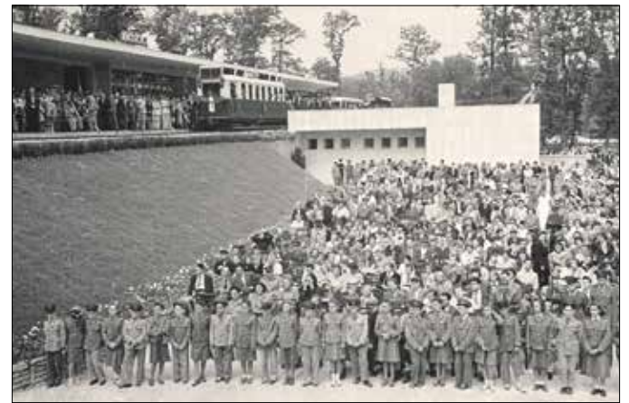
Nagy tömeg ünnepelte a teljes vonal átadását 1950-ben

Amint a vers is érzékelteti, kizárólag jó tanulmányi átlaggal rendelkező úttörők nyerhettek felvételt a Széchenyi-hegyi vasútra, emiatt komoly presztízt jelentett odakerülni. Közepes tanulók vagy rossz magaviseletűek elől az út el volt