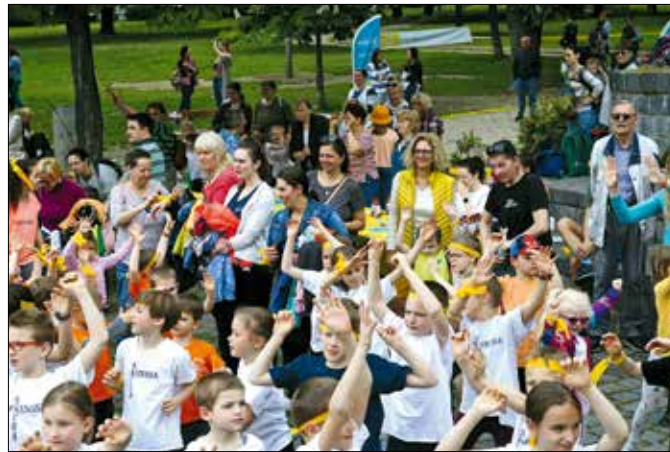
A résztvevők a futással azt üzenik a betegeknek, hogy nincsenek egyedül

A szervezők szerint a sport az a terület, amivel a legkönnyebben lehet megértetni a kicsikkel, hogy nemcsak a győzelemről szól az élet, hanem a vereséget is el kell fogadni. Gondoljunk erre, amikor betegségekkel vagy szeretteink elvesztésével szembesülünk! – tanítja az alapítvány, abban bízva, hogy az így megszólított gyerekek felnőttként cselekvő együttérzéssel viszonyulnak majd a segítségre szorulókhöz, és könnyebben szembenéz-