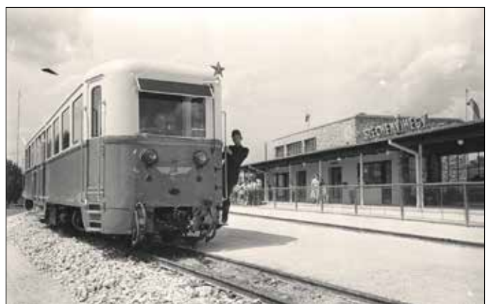
A Széchenyi-hegy lett a kisvasút egyik végállomása

Ezzel egy időben a Csillebércen kialakítandó Úttörővárosról is