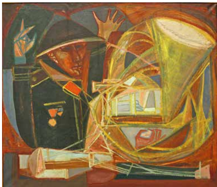
Kondor Béla: Katonazene