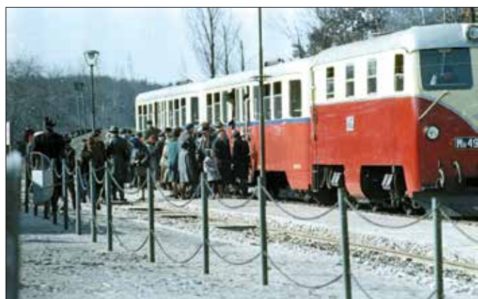
Hívhatják bárhogy, a kezdetek óta rendkívül népszerű

A mai Magyarország területén az első személyforgalmat is lebonyolító kisvasutak az első világháborút követően álltak üzembe. Lillafüreden és Debreczenben 1923-tól, a Mátrában 1926-tól utazhatott a közönség keskeny nyomtávú vasúton.