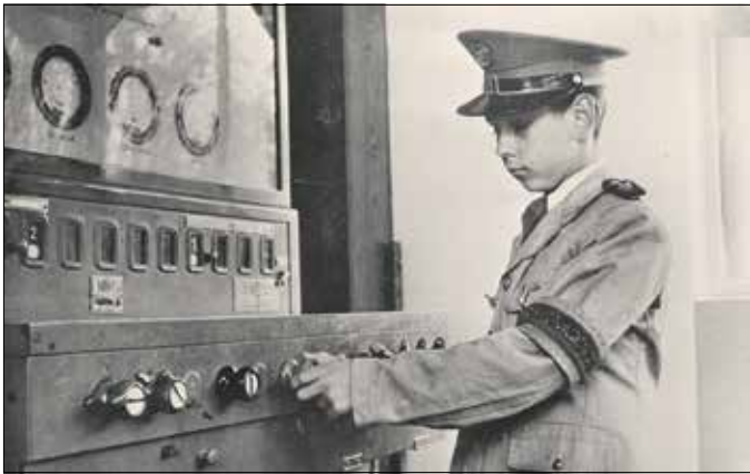
Úttörővasutasnak lenni komoly presztízt jelentett

Ezzel egy időben a Csillebércen kialakítandó Úttörővárosról is