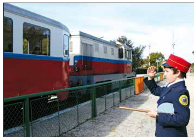
A teljes vonalon kizárólag gyerekek végzik a forgalmi feladatokat

A miniszter ígéretének megfelelően a vasút további szakaszai is elkészültek a következő években, és 1950. augusztus 20-án a teljes vonalon elindult a forgalom. Azt, hogy az ötvenes években milyen népszerű volt, jól reprezentálja a Kossuth-díjas költő, Kónya Lajos 1953-ban született Úttörővasút című verse. Ebből egy részlet: