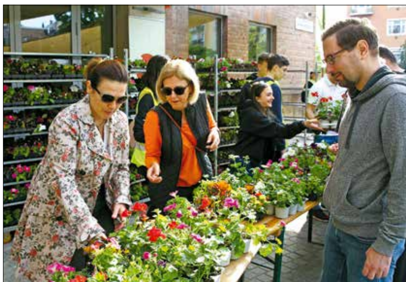
Önkormányzati képviselők is segítettek a virágok átadásában

Sok ezer növény talált gazdára, és juthat ezután a kerület különböző pontjain lévő ablakpárkányokra, virágládákba vagy szabadföldi ágyásokba, hogy egész nyáron gyönyörködtesse a környékieket. A polgármesteri hivatal melletti helyszínen kívül további négy helyen lehetett átvenni a palántákat tartalmazó tálcákat: a városmajori templom előtt, a Zalai úti bölcsődénél, a Fodor utca és Pagony utca sarkán,