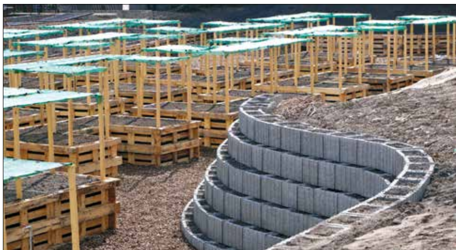
A fenntarthatóságot megvalósító raklapokból épülnek a magaságúak a Böszörményben

Az oltalmazó lombkoronát nevelő fák hiányából az is következik, hogy semmi sem állja útját a nyári, perzselő napsugaraknak, azaz az épületekkel körülvett, katlanszerű városi parkban minden valószínűség szerint embernek és növénynek is melege lesz. A kedvezőtlen hatások mérséklésére a közteret magaságúait árnyékoló védik a naptól, amely-