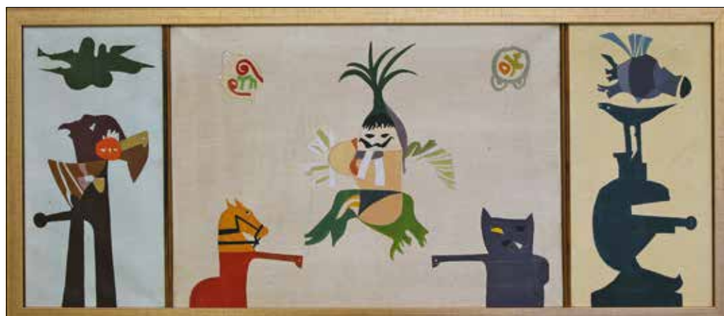
Bálint Endre: Allegro Barbaro I.

■ A kiállítás június 3-ig, keddtől péntekig 10.00–18.00, szombaton 10.00–14.00 óráig látogatható a Hegyvidék Galériában (Királyhágó tér 10.).