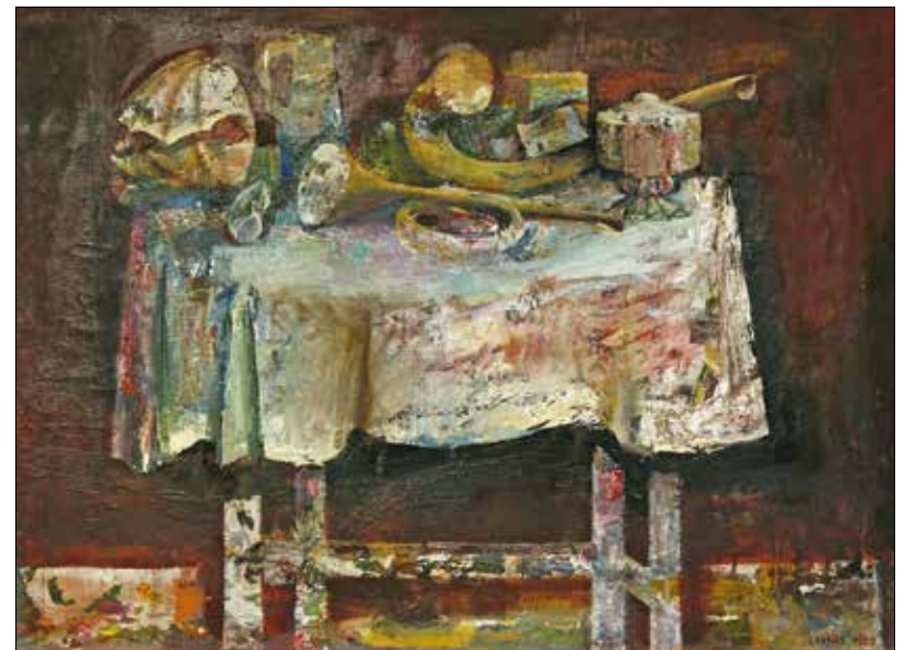
Lakner László: Csendélet kagylóval és trombitával

Úgy hozta a sors, hogy az olasz karmestert meghívták a Magyar Állami Operaházba, ahol neki köszönhetően eljártak a fából faragott királyfit, majd egy