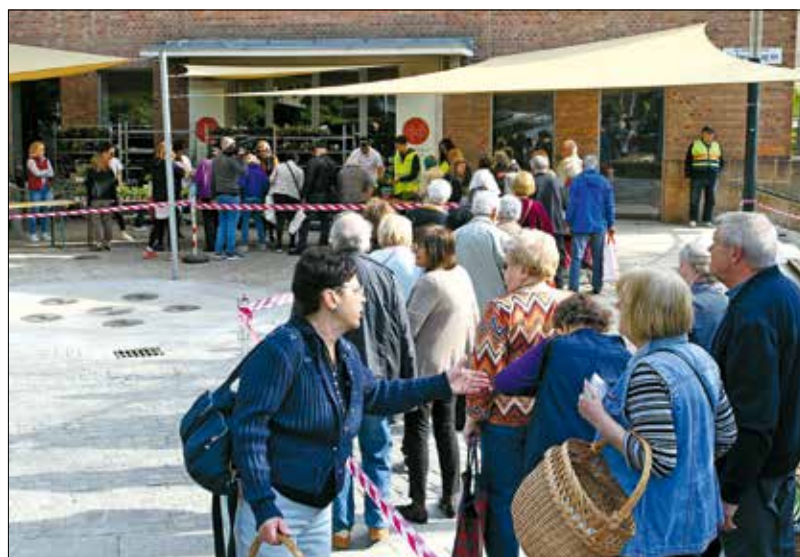
Ezúttal is óriási volt az érdeklődés a virágosztáson

játssza”, mert majd a hosszú sorokban várakozó hegyvidékiek biztosítják a földet és az edényt az ültetéshez, utána pedig ők ápolják egész szezonzban a virágokat. A virágok átadásában tevélegesen