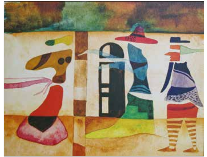
Lázár Ervin könyvborító (1989)

– Rendkívül fontos öt év volt! Először is a saját lábamra álltam, elszakadtam a szülői háztól, megéreztem, hogyan tudok önálló életet élni. Persze ez mindenféle