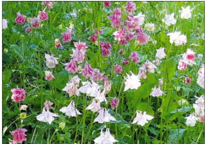
Ahol jól érzi magát, ott nagyon gyorsan elterjed

Nevelése nem okoz nehézséget, korai fejlődése miatt mire a kártevők elszaporodnának rajta, a növény már vissza is húzódik. Szereti a nedves talajt, elviseli a félárnyékos is. Április végétől május közepéig bontja fehér, lila, rózsaszín és bordó árnyalatú virágait,