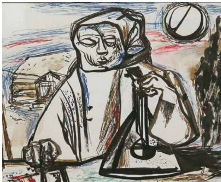
Ámos Imre: Figura hangszerral