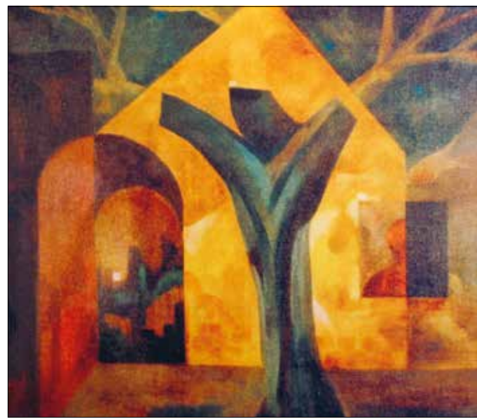
Fa a házunk előtt