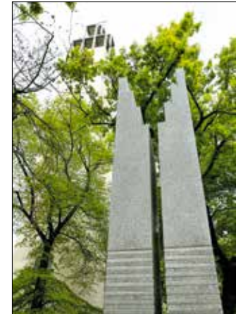
Egy éve áll a városmajori emlékmű

„A szellemi teret azonban tudjuk alakítani” – tette hozzá, megemlítve, hogy egy táblát állítottak a szobor elé. Ez arról szól, hogy 2005-től ez volt a XII. kerületi áldozatok második világháborús emlékműve, aztán 2020-ban, kegyeleti okokból, a képviselő-testü-