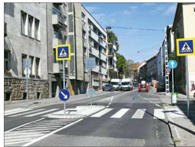
Elkészült a gyalogátkelőhely a Városmajor utcában, a Szamos utcánál

Szintén befejeződött a Kopp Mária sétány – azaz az Eötvös út felső szakasza – átépítésének kö-