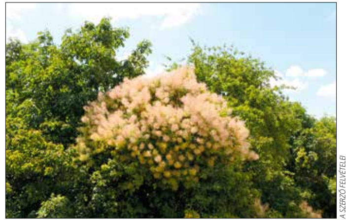
A Kis-Sváb-hegy díszes virító csereszömörce

A cserjék és bokrok közül jól viselik a meleget a csereszömörécék, amelyek őshonosak, és kora nyári