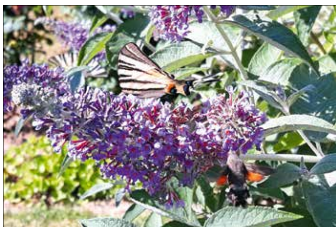
Kardoslepke és szender a nyáriorgonán

A sziklagyepek csupasz köfelszínein tányérméretű párnákat nevel a sziklai, vagy szirti ternye. Tavasszal nyíló, ötszirmú virágjaival ez a növény a kertben is megállja a helyét. A sziklakertekben talajtakaróként ültetve alacsony, örökzöld lombzatot nevel, ezt sárga szőnyegként borítják virágai. Gondozása nem okoz nehézséget, szereti a gyenge minőségű, köves talajt, és a nyári forróság sem árt