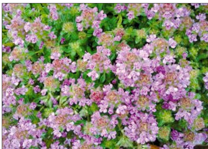
A konyhakertben akár friss fűszerként is használhatjuk a kakukkfűvet

nak, és néhány év alatt teljesen eltűnnek, ami vélhetőleg nem a hobbikertész, vagy a talajadottságok hibája. A kertészek és ökológusok egybehangzó véleménye szerint egyre inkább csak azok a fajok fejlődnek szépen és virágznak gazdagon a kertekben, amelyek a Hegyvidék szűkebb és tágabb természetközeli részein is otthon érzik magukat.