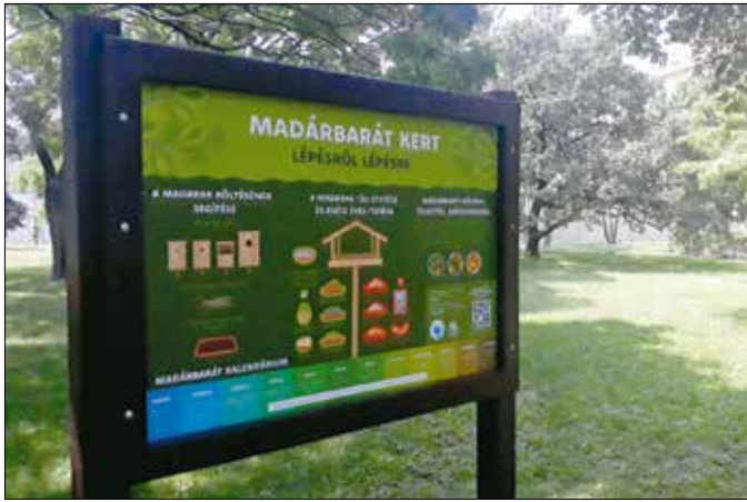
A környék madarairól és a madárvédelemről is olvashatunk a táblákon

Van például veréblakótelep, amiben egymás társaságát élvezve három család is költöhet párhuzamosan. Helyet kapott az egyik fa