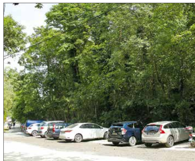
Már üzemel az új parkoló a Zugligeti Libegő közelében

munkáinak elvégzését kérhetik. Az önkormányzat eddig azoknál a 70. életévüket betöltő időseknek végeztette el térítésmentesen az átalakítási munkákat, akiknek az egy főre eső havi jövedelme nem haladta meg a 165 ezer forintot. E feletti jövedelem esetén, havi 220 ezer forintos bevétel 50%-os támogatás mellett igényelhetők a segítséget az érintettek, 220 ezer forintos jövedelem fölött pedig az átalakítások tervezését vállalta ingyen az önkormányzat. Most ezek a jövedelemhatárok emelkedtek 200 ezer és 250 ezer forintra.