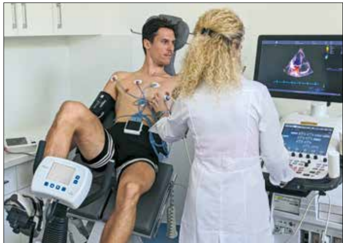
Terhelési vizsgálat fekvőkerékpárral

szívritmuszavarok katéteres beavatkozásait, a fő mellkasi és hasi ütőér-operációkat, valamint a nyitott, vágással járó érműtéteket. Magyarországon eddig is itt történt a legtöbb hibrid érműtét,