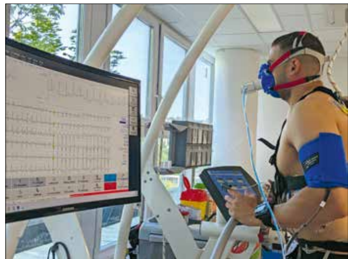
Futópádon végzett terhelési vizsgálat

Az új sportkardiológiai központban a többi között terhelési méréseket