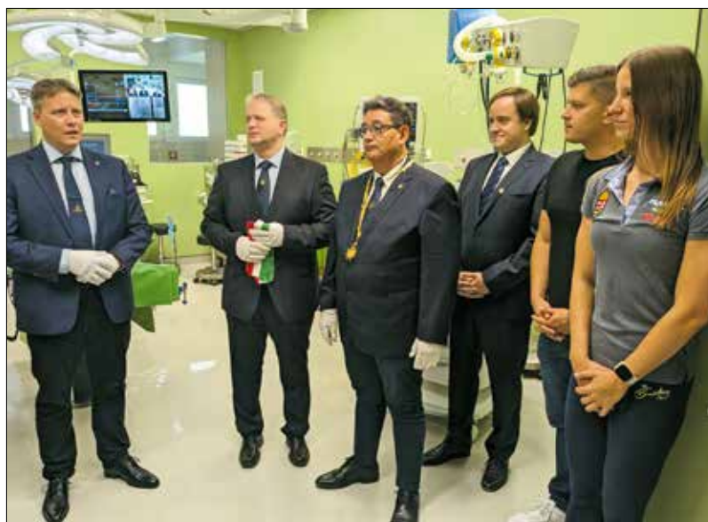
A klinika vezetői olimpikon sportolókkal közösen avatták fel az új műtőket

ként valósultak meg. Az összességében több mint hatmilliárd forintos állami és egyetemi forrás mintegy harmadát fordították a most átadott új központok beszerzésére és az érintett épületek felújítására.