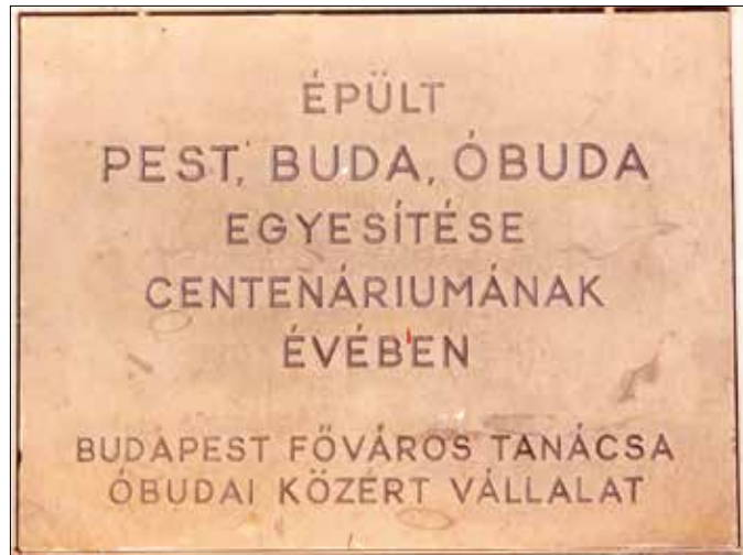
A Zalai úti centenáriumi emléktábla már rég eltűnt

Érdekes emlékek az egykori magyarzó utcanévtáblák is. Rá-