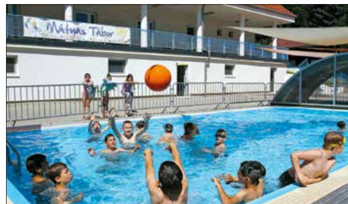
Mindenhol jó, de a legjobb a szabadtéri medencében!

■ További részletek a táborozásról: hegyvideki-matyas-tabor.hu