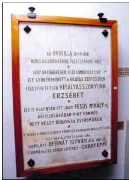
Az Óra-villa emléktábláját is megrongálták