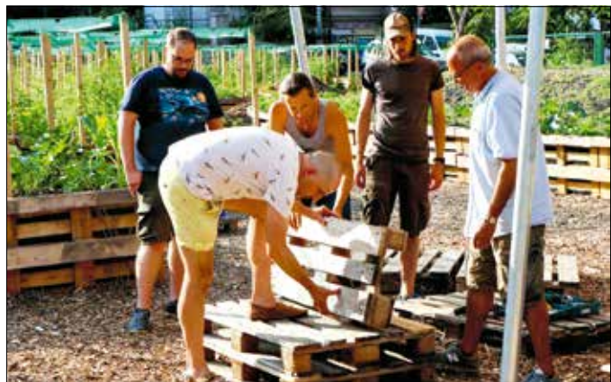
A vállalkozó kedvű kertészek pár nap alatt megépítették a bútorokat

bútorok építésére a világhálón, először ezek közül kellett kiválasztani, hogy mennyi és milyen típusú bútor darab szolgálna legjobban a Hegyvidék első közösségi kertjében időzők igényeit.