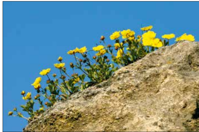
Szirti ternye a Hunyad-órom szikláin

virágzásuk mellett őszi, élénk lombszíneződésükkel is vonzzák a tekintetet. A Kis-Sváb-hegyen több tetszetős példányuk is megállásra készíti az arra járókat.