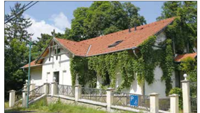
Az önkormányzat kifizeti, így újra lesz posta a Normafa körzetében

„A bezárást követően azonnal lépéseket tettünk annak érdekében, hogy a posta mielőbb újra megnyisson. Hónapokig tartó egyeztetések következtek, számos konstrukció felmerült, ezeket alaposan megvizsgáltuk. Végül arra jutottunk, hogy a legjobb, ha az önkormányzat üzleti alapon köt