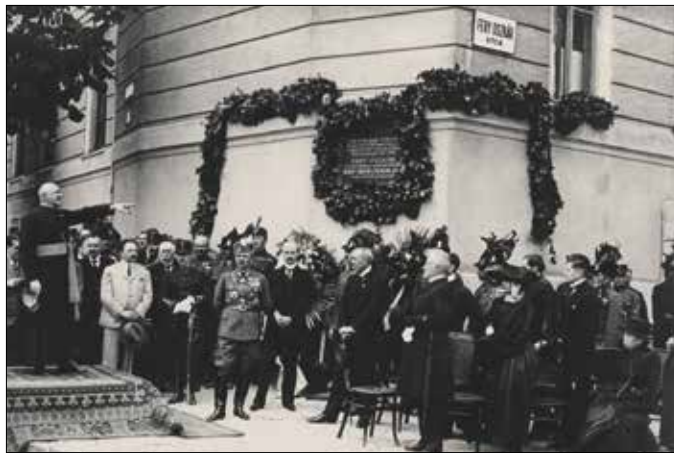
...és a három évvel korábban állított régi emléktábla átadónapsége