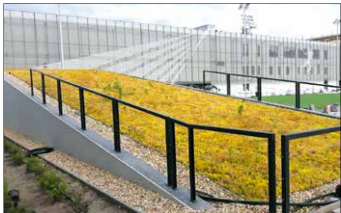
Szép és az épületet is óvja a némileg szokatlan színvilágú tetőkert