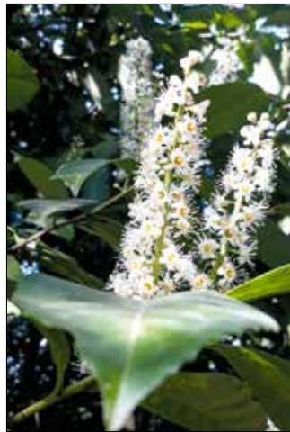
Egyre elterjedtebb a babérmeggy

A hazai, középhegységi, száraz gyepes jellegzetes növénye az árvacsalánfélék családjába tartozó