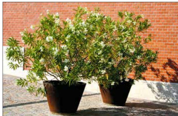
A dézsában növekedő növények jó hatással vannak a mikroklímára

A mintegy kéthetesre tervezett szavazást követően – lakossági támogatás esetén – megkezdődhet a konkrét igények felmérése, hogy az őszi ültetési időszakra készenlétben