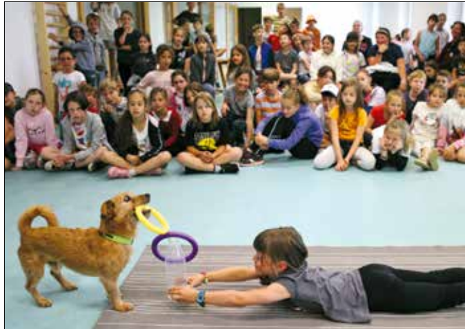
Minden évben az egyik legkedveltebb program a kutyás bemutató