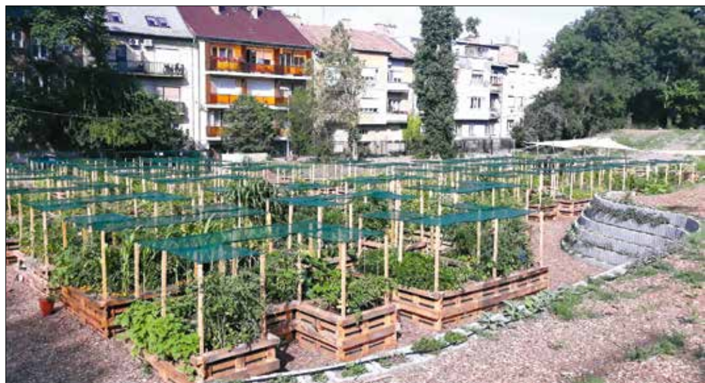
Egyre szebb arcát mutatja a Hegyvidék első közösségi kertje a Böszörményi úton

A tervezőasztal körül megálmodott bútorok kivitelezése a vállalkozó kedvű kertészekre várt, akik mértek, töprengtek, majd három este alatt megépítették a kerti bútorokat. Több raklap megmaradt, amelyeket kár lett volna veszni hagyni, így egy praktikus ötlet megvalósítására is lehetőség nyílt. A feleslegesnek tűnő maradékból hasznos polc vagy pad készült, ezek az egyes magasságúakba illesztve segíthetik a kert művelését, a szerszámok és anya-