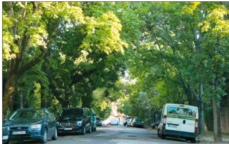
Szerencsére sok ilyen „zöld alagút” van a Hegyvidéken, de már kevés a hely új fának