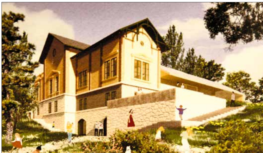
Régen vendéglátóhely is volt, most másfajta hasznosításra vár az épület (részlet az első díjas pályázatból)

meghirdetett Árkay pályázaton ezúttal nemcsak a MOME mesterszakos építészhallgatói vehettek részt, hanem a Magyar Agrár- és Élettudományi Egyetem tájépítészeit is bevonták a munkába. Ez azért volt indokolt, mert a kiírók most az Istenszeme fogadó funkcióváltására vártak megvalósítható építészeti ötleteket, és ebbe nemcsak az épületnek, hanem az erdei környezetének a megújítása is beletartozik.