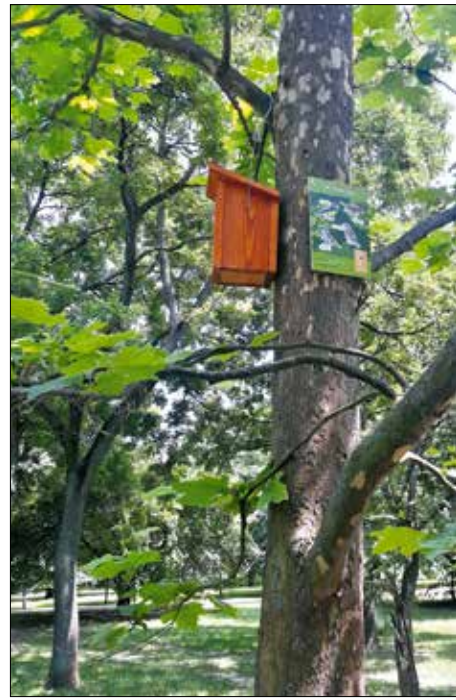
Odú a madaraknak, információs tábla mellett

A bemutatókertben minden fészkelőhely mellett információs tábla tájékoztat a lehetséges lakókról és a legfontosabb tudnivalókról. A sétány melletti két nagy táblán lehet megismerkedni a környék madaraival és a legfonto-