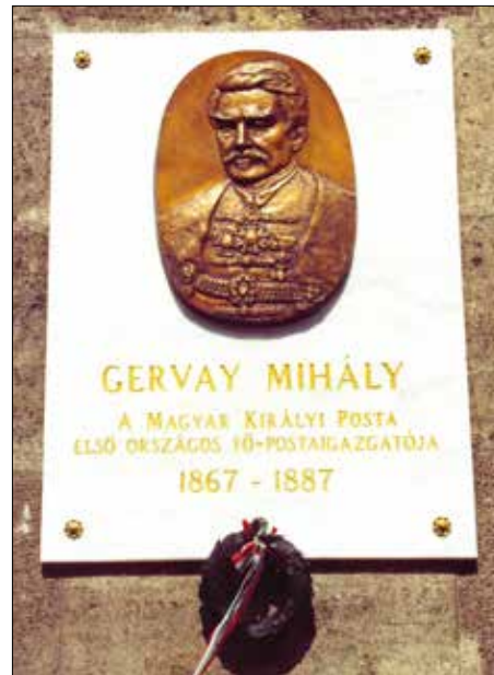
A Postapalota falát díszítette ez a tábla

day Mihályt idézzük: „ Jogszabály írja elő Budapesten, hogy minden – valakiről elnevezett – utca elején ott kell lennie egy táblának, amely