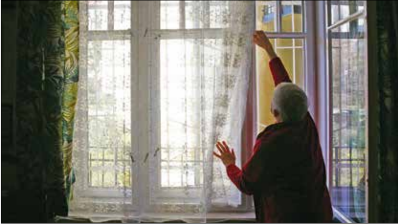
Kedvezőbbé tette az önkormányzat az „Otthon megöregedni” pályázat feltételeit

hallgatók számára kiírt Árkay-pályázat témája is ehhez a feladathoz kapcsolódott. (Erről szóló cikkünk a 3. oldalon olvasható – a szerk.)