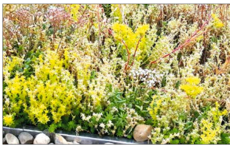
A pozsgások láthatóan jól érzik magukat a helyükön, gyorsan virágozni kezdtek

Az Óvilágban, azaz nálunk őshonos pozsgások nem a törzsükben, hanem húsos leveleikben tárolják a csapadékvizet, de kinézetüktől eltérően pontosan úgy működnek, mint a vadnyugati rokonok, és sikeresen átveszik a