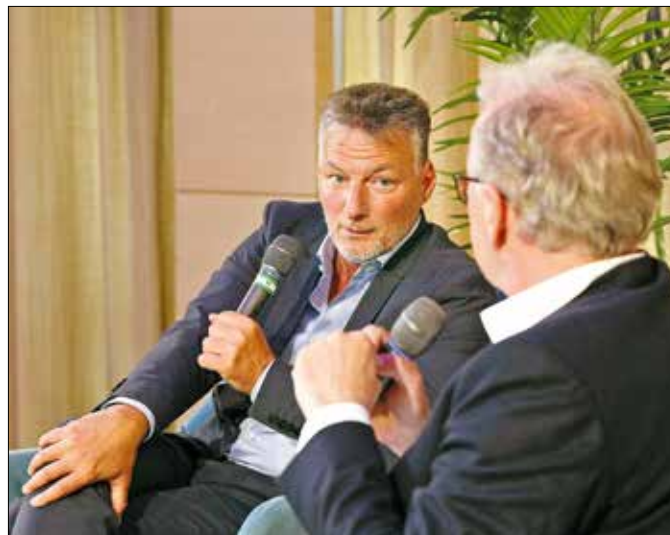
A Hegyvidék új díszpolgára a polgármesterrel beszélgetett az ünnepségen

sem gyógyít jobban, mint a mosoly, ami mindig ott ül a professzor arcán, aki a példájával arra is megtanította: a világ attól függ, mi magunk milyenek vagyunk benne.