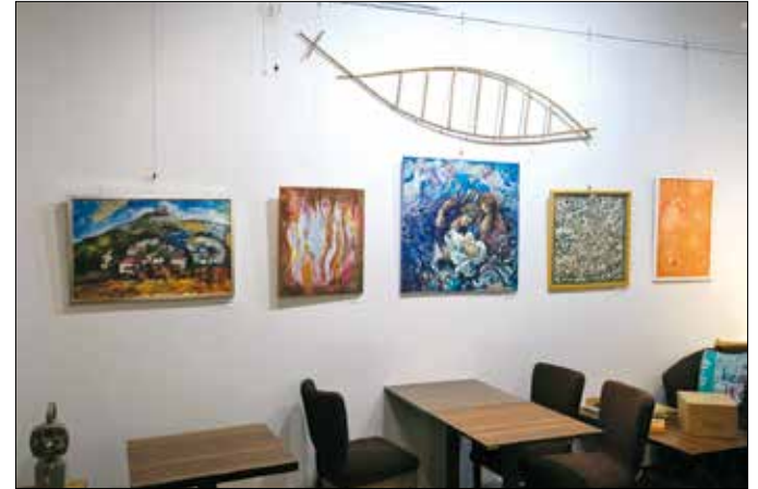
Január elejéig lehet megtekinteni a tárlatot a Galéria 12 kiállítóhelyén

Meg kell tanulni tisztán, őszintén, önzetlenül szeretni a másik embert, és akkor talán – Ady versére utalva – a szeretet feloldana mindent, nem lennének háborúk... „Hál’ Istennek, ezen a kis szigeten együtt vagyunk békében,