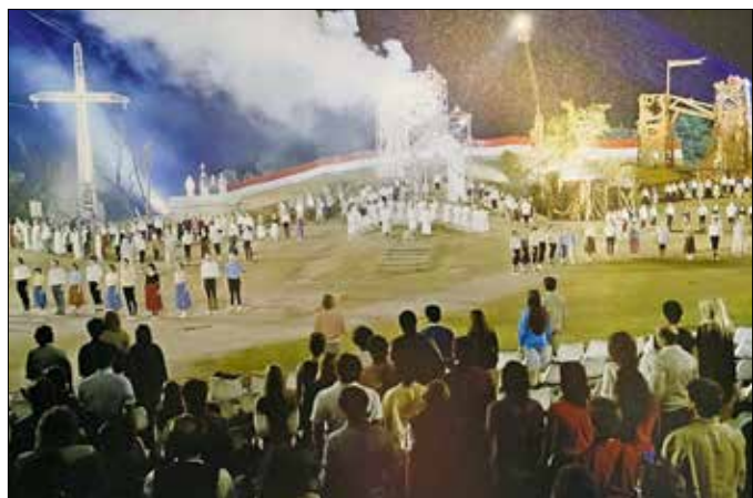
Szőrenyi Levente–Bródy János: István, a király (Királydomb, 1983)

turális életének részeként méltatta a kiállítást Fonti Krisztina alpolgármester. Köszöntőjében a színház, a színpad csodájáról beszélt, arról