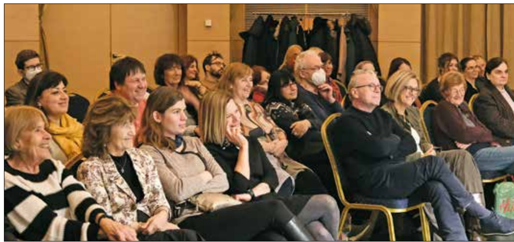
Az izgalmas és szórakoztató pódiumműsorra megtelt a MOM Kulturális Központ Kupolaterme

czot említették – hozzátéve, hogy a műalkotás egy teremtett világ, ami az alkotó tapasztalatából táplálkozik, és az olvasó tapasztalati világával találkozáskor jöhet létre a megérintettség, a katarzisz.