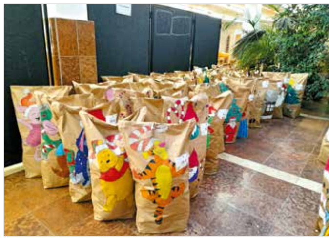
Tartós élelmiszereket és édességeket gyűjtöttek a BGSZC tanulói

ban élő moldvai csángó gyerekek ünnepéhez járultak hozzá, cipődobozokba rejtett ajándékokkal kedveskedtek.