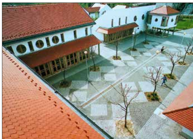
Egyik legjelentősebb munkája a közepi SOS Gyermekfaló megtervezése volt

– Mindig megadtuk a módját a karácsonynak. Három fiam van, a szentestéket természetesen mindig együtt töltöttük. A feleségem tradicionális ételeket készített: halászlévet, rántott halat, székelykáposztát. A koreográfia hasonló volt, mint az én gyerekkoromban: huszonegyedikén este általában elmentem sétálni a fiúkkal, eközben a feleségem feldíszítette a fát. Abba a szobába nem volt szabad belépniük a gyerekeknek egészen addig, amíg nem szólalt meg a kisharang. Gyertyafény, csillagszóró, Mennyből az angyal – ezeket a tradíciókat megőriztük. Ahogy