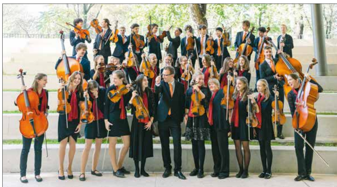
A vonószekar sikereinek titka elsősorban a jó közösség; egy-egy mosoly, összepillantás elegendő egymás megértéséhez

– Számtalan tanulmány született már arról, hogy a zenetanulásnak milyen jótékony hatásai vannak. A zene csodákra képes, olyan nemzetközi nyelv, amit mindenki megért. A legfőbb célom, hogy a műveken keresztül a növendékek is megismerjék a közös zenélés élményét – ami energiával képes feltölteni őket –, valamint az egymásra figyelés fontosságát.