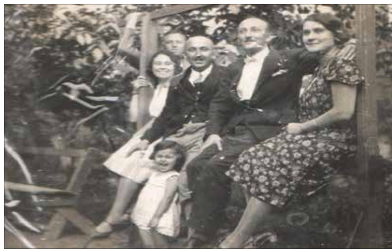
Kisgyerekként a családjával

szemben magam, hogy Magyarországon a nyugati nyelvek helyett kizárólag az orosz lesz tanítható.