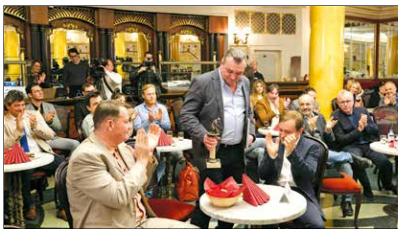
Az idei átadóünnepség színhelye a Vígyszínház volt