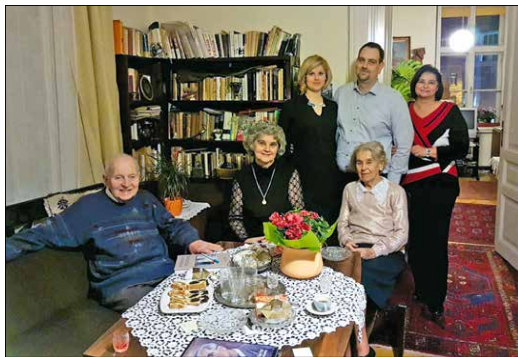
„A szereteteimmel leszek. Számomra ez a legszebb karácsonyi ajándék”

la működött. A mi feladatunk viszont az volt, hogy szervezzük meg az új intézmény közismereti oktatását, legalább középfokú műveltséget adva a leendő balett-növendékeknek. A munkához nem kaptunk helyiségeket, kerü-