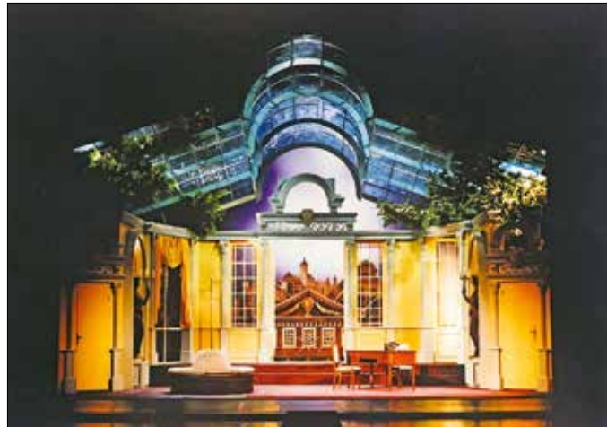
Ray Cooney: Ne most, drágám! (Madách Színház, 1995)