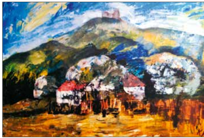
Kecskeméti Kálmán: Szigliget

hogya szeretnének/S lennék valakié, /Lennék valakié” – idézte a művet az előadóművész, hozzátéve, hogy Ady istenes verseivel kapcsolatban úgy érzi, a költő valóban találkozott Istennel. A Karácsony című meghitt költeményt is elszavalta Meskó Bánc, amelynek sorai, különösen a vége – „ Karácsonyi regel/Ha valóra válna, / Igazi boldogság/Szállna a világ-