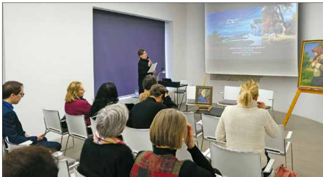
A Hegyvidékhez kötődő képzőművészeket mutatják be a konferenciasorozat előadói

A harmadik szekció az 1945 után a kerületben letelepedő képzőművészeket tárgyalta. Az előadó betegsége miatt a Fekete Nagy Bé-