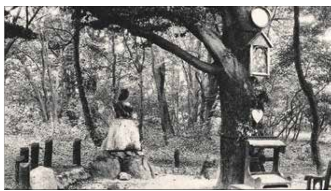
Az egykori Erzsébet királyné-emlékhely a János-hegyen

A Jánoshegyi út déli oldalán, az egykori síugró sánccal áttelenszerűen található az Erzsébet-térdeplő. Az emlékhely története a 19. századba nyúlik vissza, amikor Erzsébet királyné (Sisi) magyarországi tartózkodása alatt szívesen járt fel a normafai hegygerincre, az erdei Mária-zarándokhelyhez, a százszentendősnél idősebb fára helyezett Madonnaképhez imádkozni – kísérője általában id. Erber János fővárosi erdész volt. A krónikák három látogatását meg is örökítették (1882. április 30., május 16., október 9.). A budakeszi svábok is rendszeresen zárandokoltak az emlékhelyhez.