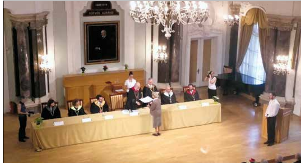
A Vasdiplomaosztón - azóta már a Rubindiplomáját is átvehette