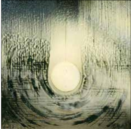
Orient Enikő: Közelebb-közelebb

Példaként hozta fel kedvenc szobrása, Francesco Queirolo