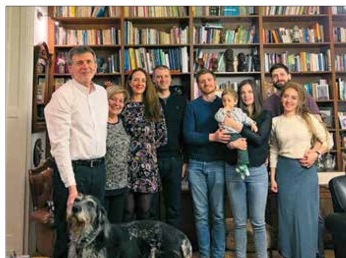
Otthon, családi körben

– Most hétvégén (a beszélgetés december 11-én készült – a szerk.) nem mentem fel, pont azért, mert múlt hét pénteken alig találtam parkolóhelyet, olyan sokan vol-