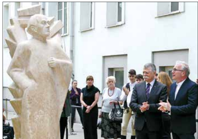
Az első egész alakos köztéri Tamási Áron-szobor a fővárosban

Tamási Áron 1966. május 26-án hunyt el. A Farkasréti temetőben végezték el a temetési szertartást, de végrendelete alapján hamvait később szülőfalujában, Farkaslakán helyezték örök nyugalomra. Emlékét eddig az Alkotás utcai lakóháza falán elhelyezett tábla, valamint a róla elnevezett utca és iskola őrizte a Heggyvidéken, most pedig már itt áll az első budapesti, egész alakos köztéri szobra is.