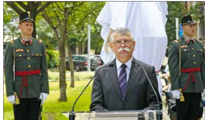
Kövér László, az Országgyűlés elnöke, a Tamási-emlékév fővédnöke

„Jó dolog tudni a történelmi adatokat, évszámokat, a fájdalmas tényeket, de ezek mind információk, amiket egy gyerek hamar elfelejt. Ellenben ha átélte élménytel gazdagszik, hozzá hasonló, vele egykorú gyerekekkel találkozik, azt élete végéig megjegyzi” – mondta a polgármester. Megemlékezett, hogy az elmúlt években, pályázati támogatással, harminc-