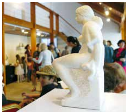
Női varázs a Barabás Villában

történelem és a művészvilág is nagyra tartja Kós Károlyt. Mert nem csak szobrokból, festményekből és grafikákból áll a művészet. Van másfajta művészet is. Ő akkor