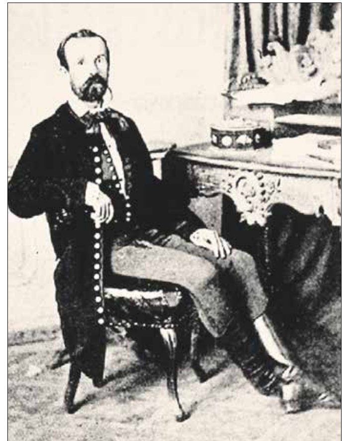
Madách már nem élhette meg Az ember tragédiája színpadi sikereit

jövőbe vetett hitét jelezve. Ádám az úrjelenetben elborzadva rájön, hogy: „A cél halál, az élet küzdelem, /S az ember célja a küzdelem maga.”