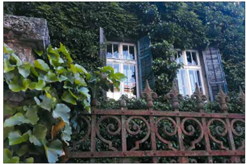
Kellemes, megnyugtató látvány (zöld fal a Törpe utcában)

A levelek azonban nem csak a meleg ellen nyújtanak védelmet. A csapadék a legtöbb esetben a leveleken folyik le, úgy, hogy a