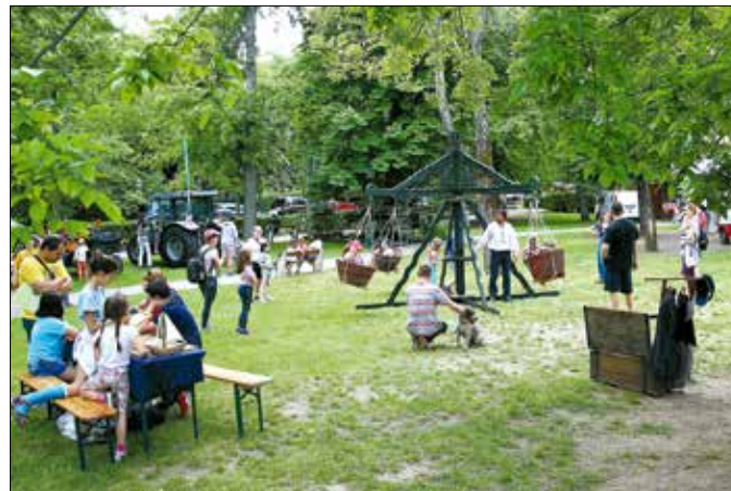
Igazi közösségi, családi rendezvény helyszíne volt a Diana park

A gyerekeknek játszott a Kalamajka Bábszínház és a Zabszalma együttes is. Persze az elmaradha-