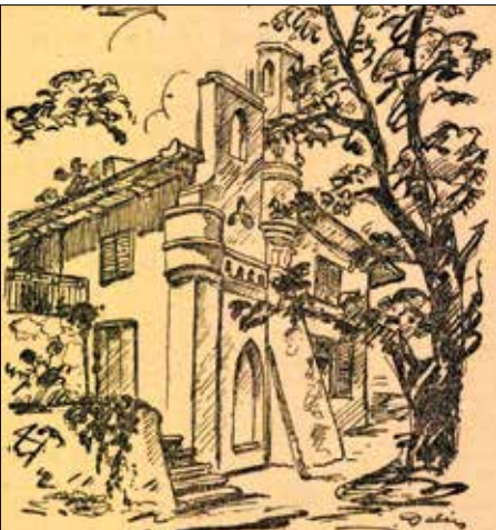
Állítólag egy lengyel menekült építette

„Nem kell sokat menni, a következő házban ismét érdekes dolgokat látunk. Ez itten közösségek lakóháza, s ha megkerüljük, és a kert alsó feléről nézzük: kápolna.