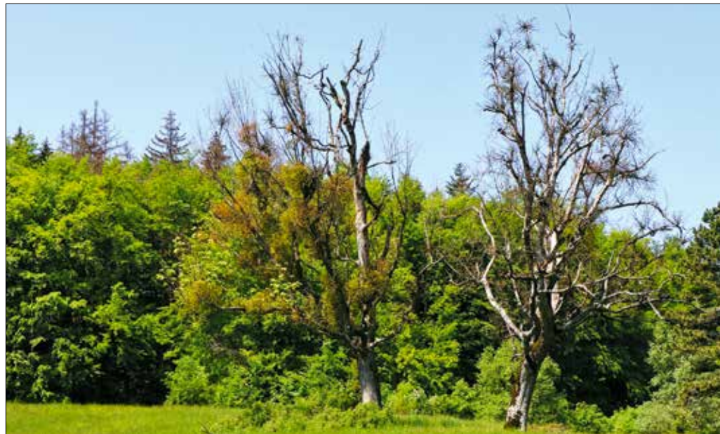
A természetben is kiszárad sok fa, miért történne ez másképpen a kertekben?

A favágás és a romok eltakarítása után a következő lépés az újratervezés, hiszen semmi értelme ugyanazokkal a fajokkal pótolni a foghíjas sövényeket, különösen ha belegondolunk, hogy az eddigi túlélők kilátásai sem túl perspektivikusak. Sajnos a korábban egyszerűen zöldellő gyep sem vészelte át a nyári meleget károsodás nélkül, tehát a kert e leggyakoribb komponensének fenntartásán is törhetjük a fejünket. Az újratervezés egyébként nemcsak a fent leírt kertekben válik szükségessé, ha-