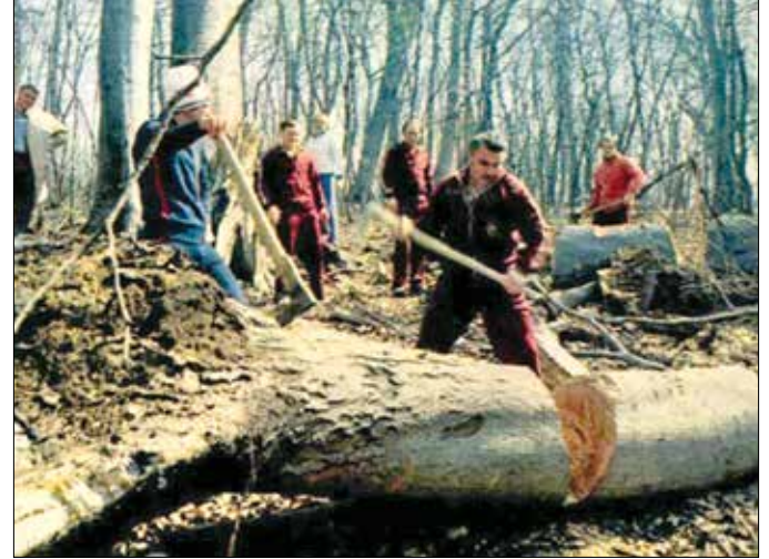
A Papp Laci-féle edzőmódszer: favágás az erdőben

Papp László háromszoros olimpiai bajnok ökölvívó számtalan-szor futott a Normafánál, sőt, ott gyakorolta híres edzőmódszerét, a farönkök aprítását is, amiről így beszélt egy alkalommal: „Hasonló mechanizmust fedeztem fel a favágás és az ökölvívás között. Ahogy a