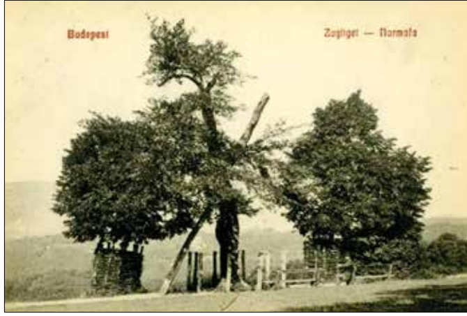
Korábban Viharbükként emlegették, a mai neve: Normafa