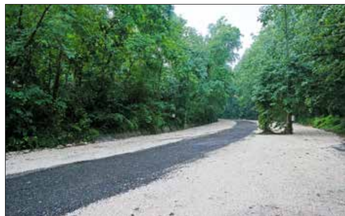
Hamarosan megtelik az új parkoló a Zugligeti Libegőnél

Mivel egyre gyakrabban fordul elő a Norma-fánál, hogy a látogatók nem a kijelölt helyeken gyűjtanak tüzet – ami sokszor tűzveszélyes, zavarja a többi kirándulót, és együtt jár a környezet károsításával –, az önkormányzat kiegészítette a közösségi együttélés szabályairól szóló rendeletét. A továbbiakban ez a szabálysértés akár 50 ezer forintos helyszíni bírsággal, valamint 200 ezer forintig