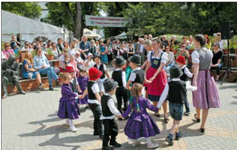
A Normafa Óvodába járó gyerekek is bemutatták tánc tudásukat