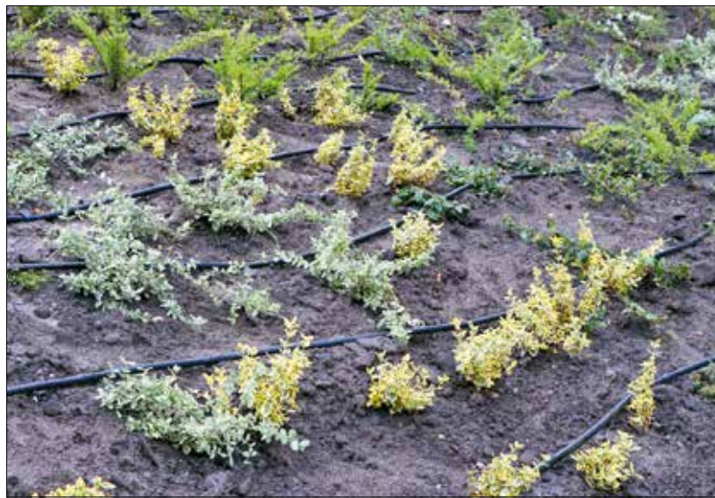
Cserjék között kanyargó az öntözőcső a rézsűn

A Böszikert tervezésekor a víztakarékosság egyike volt a legfontosabb szempontoknak, ezért a bejárás során a szakemberek csepegtetőcső beépítésére tettek javaslatot. A kertben tekerő, kétszáz méteres „csókió” óránként 1,2 köbméter víz kijuttatására alkalmas, de a támfalakat takaró betonkosarakba ülte-