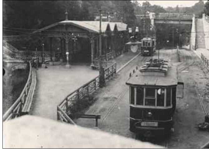
A legendás zugligeti villamos végállomása 1909-ben

1900. június 4-én történt az első szerencsétlenség, az akkori végállomástól, amely korábban a lóvasút végállomása is volt, uta-