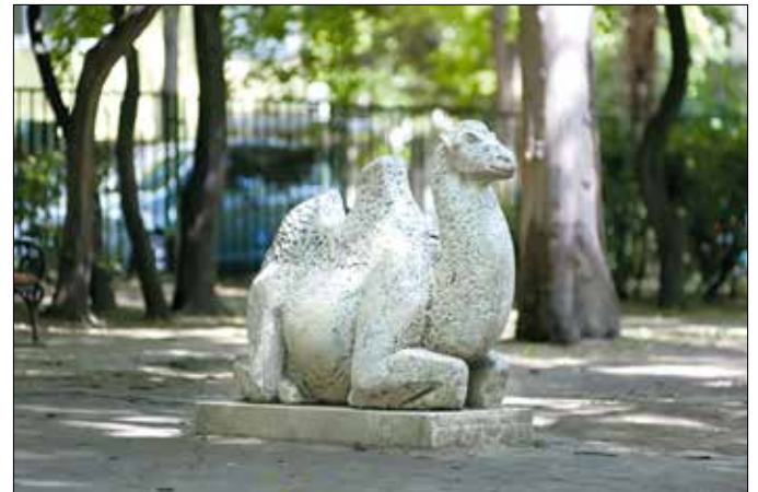
Nagy István János teveszobra a Hollós Simon utcai játszótéren

Az állatkert igazgatója arra kérte a közönséget, hogy „gyűjtsön minél több vadgesztenyét az elefántok, bölények, szarvasok, antilopok és a többi állatok részére s az igazgatóság két három mázsás vadgesztenyéért már elküldi a teherhordó tevét, de csak szeptemberben és októberben, mert később nem bírják a hideget. Egy-egy teve egyébként három-négy métermázsát tud elvinni a púpjára akasztott nagy zsákokban.” (Budapesti Hírlap, 1918. augusztus 30.)