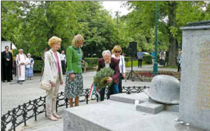
Koszorúzás a Hősök emlékművénél

„A pünkösdi az egyház születésének ünnepe, egyben a közösségek ünnepe. Kicsit forradalmi világunkban pedig különösen