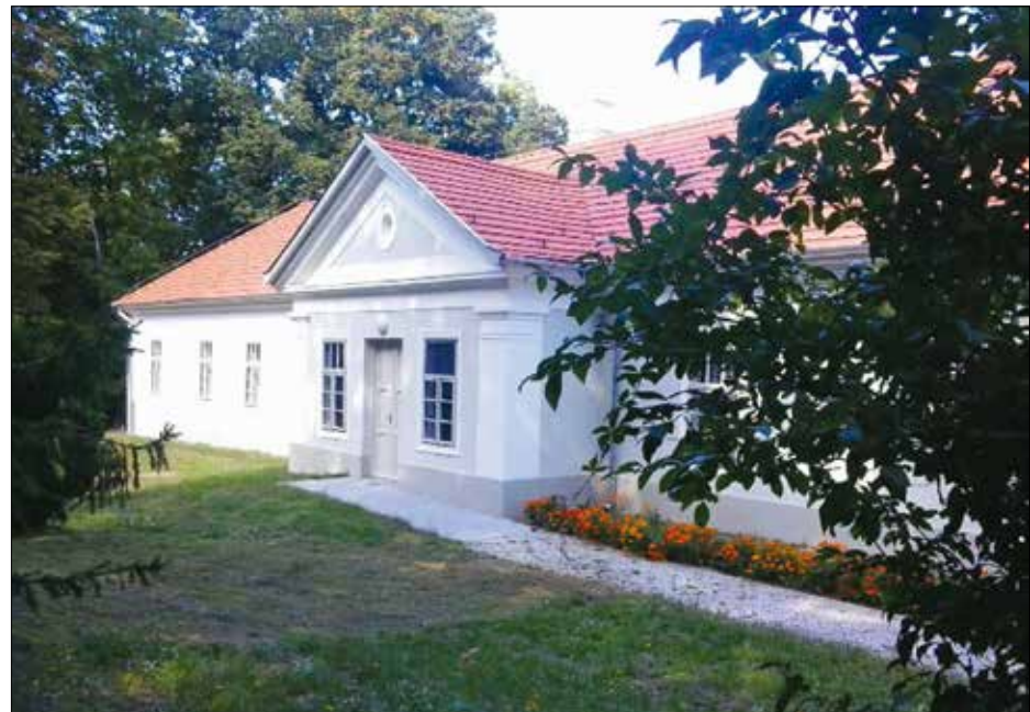
A Madách Imre Emlékház Csesztvén, itt lakott feleségével az író

ra. Európai gondolkodó volt, Hegel dialektikája nyomán szintetizálta a különböző karakterek nézőpontjait. Lucifer Hegel, Ádám Rousseau szócsöve, de mindket-