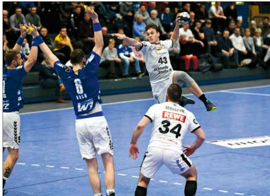
Már a Bundesligában is bemutatkozott, sőt, gólt is dobott

– Nagyon, hiszen sok olyan szituáció adódik, amikor emiatt könnyebben hozok meg döntéseket. Sokkal több lehetőség közül választhatok. A védők nem tudják biztosan, éppen melyik kezemmel lövök, vagy passzolok majd. Az biztos, hogy az ellenfél játékosainak mindig demoralizáló érzés,