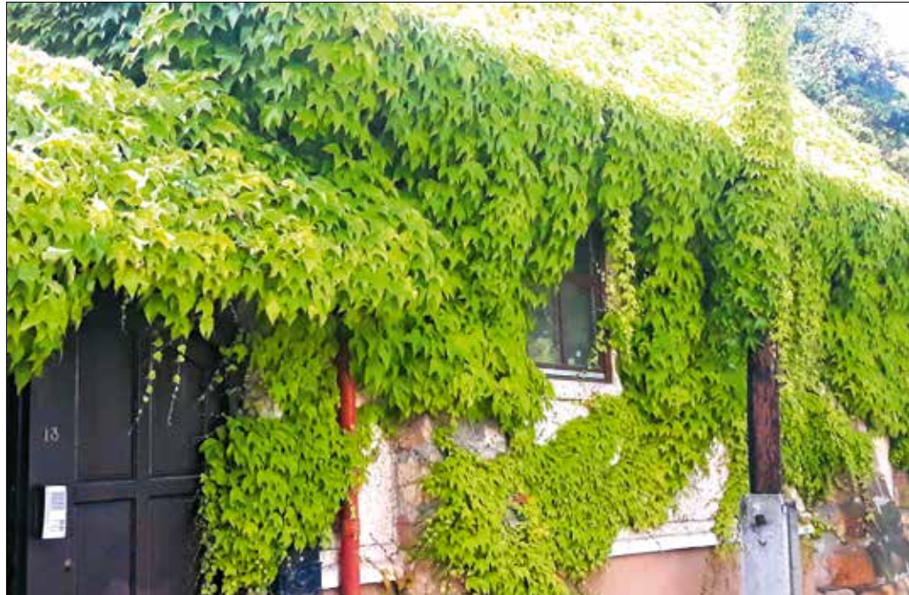
Vadszőlővel befuttatott épület a Költő utcában

kus hangulatúak, hanem a benne lakók életminősége szempontjából is kedvezők voltak.