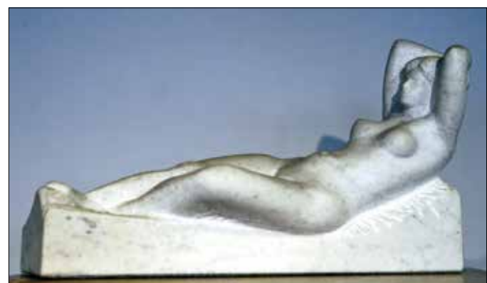
„A nő egyszerűen szép”

– Nyolcvanöt éves vagyok. Annak idején bácsinak tekintetem az ilyen idős férfiakat. Erre, tessék, én is annyi vagyok! A szobrászat fizikálisan nem egyszerű, mostanában kicsit lustának is érzem magam hozzá. Jelenleg félbe-