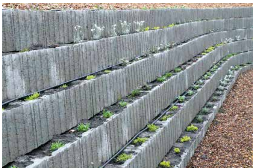
Az öntözőrendszer a flórkosarakban fejlődő évelőkről is gondoskodik

éppen a Hegyvidéken. A XII. kerület nem volt ismeretlen az öntözéstechnikai vállalkozó előtt, a cége korábban többször