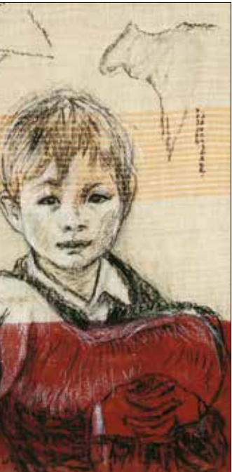
Uray-Szépfalvi Ágnes: Fiú pásztor

benne. Azt szoktam mondani, számomra sokkal fontosabb az újságokban való megjelenés, mint a kiállítás, mert ha valaki az újságot megveszi, hazaviszi, és ott van