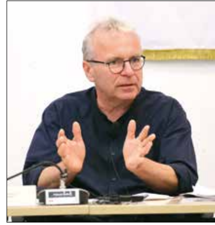
Pokorni Zoltán polgármester

– Többször elmondtuk, hogy a keretközbeszerzésben azért a keretközbeszerzést nyert cégeket versenyeztetjük a konkrét munkákra,