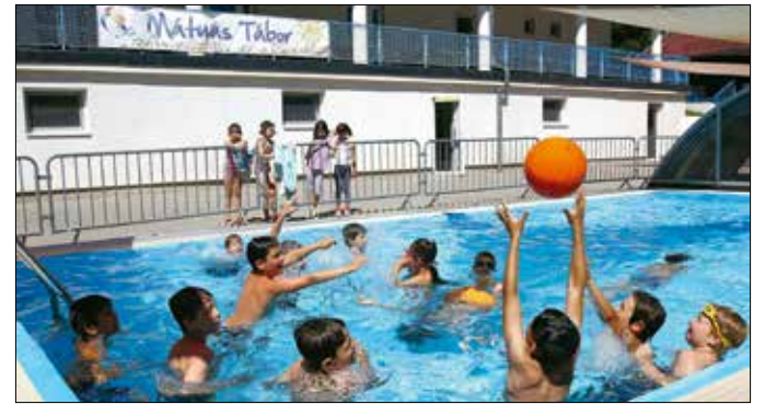
Minden adott a felhőtlen kikapcsolódáshoz

gyerekeket a táborba, ahol a bőséges reggelit követően kezdetét veszi a játék. A tábor területén minden adott a felhőtlen kikapcsolódáshoz