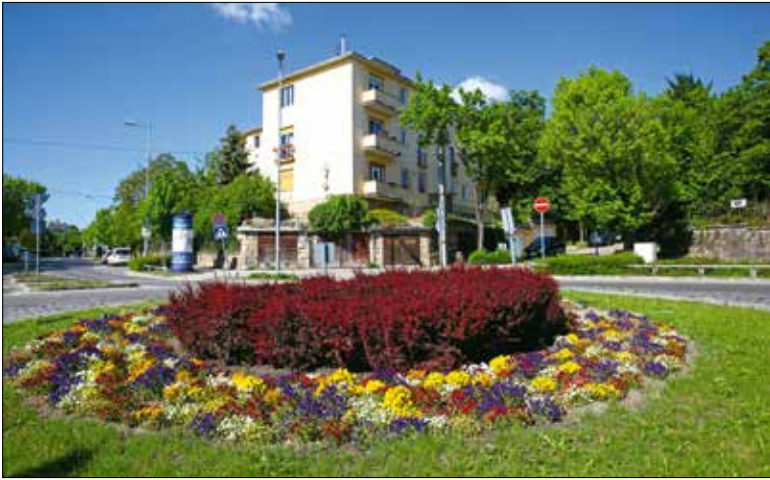
A parkok, zöld területek sem maradhatnak gondozás nélkül októberig