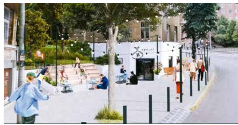
Részlet az Árkay-pályázat első díjas munkájából („Látvány az utcakapcsolatról”)

Közel áll az önkormányzathoz a – helyiségek átmeneti hasznosításaként javasolt – pop-up workshopok szervezése is, mert bár ilyen típusú kézműves foglalkozásoknak helyet ad a Hegyvidéki Kulturális Szalon, de lenne igény továbbiakra is. Számos civil közösség valósíthatná meg így az elképzeléseit az új helyen. Negyedik ötletként ott van a játék, ami magától értető módon közösségépítő tevékenység. „Remek gondolat, hogy a játék kiköltözik a Bösör-