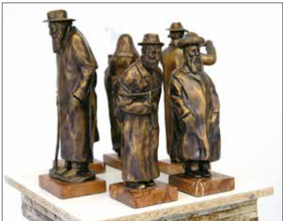
Babusa János bronzszobrai

pein az új generáció rendkívül erőteljes expresszivitása mutatkozik meg. A művein látható horizontálisban és vertikálisban tudatosság, konstruktív gondolkodás munkál. Pelles Róbert, aki animációs filmesből, grafikus dizájnerből lett nemzetközi sikerekkel elismert festő, szintén hasonló indíttatásból készíti elvont képeket, de ő mindig lírai elemekkel telített absztrakt festőnek számított. Szín- és tónusgazdag triptichonját szemlélve átérezzük a születés misztériumát.