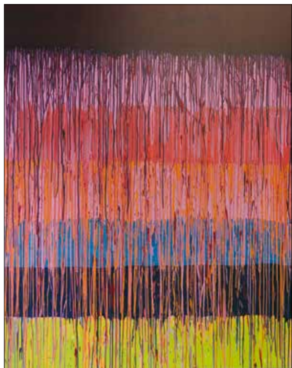
Bánki Ákos: Cím nélkül

– A kiállítás július 20-ig, keddtől péntekig 10.00–18.00, szombaton 10.00–14.00 óráig tekinthető meg a Hegyvidék Galériában (Királyhágó tér 10.).