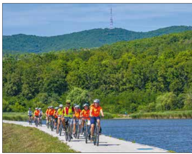
Se szeri, se száma a változatos bringázási lehetőségeknek

A maketusz.hu honlapon a projektek fül alatt is elérhető tekerjazzolde.hu oldalon nemcsak a meghirdetett kirándulások kö-