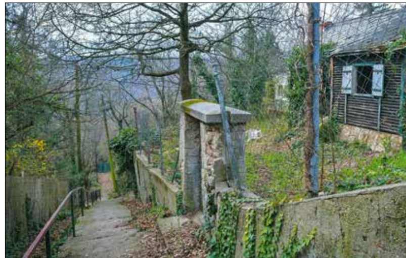
Folytatódik a csillebérci üdülőterület tulajdoni viszonyainak rendezése