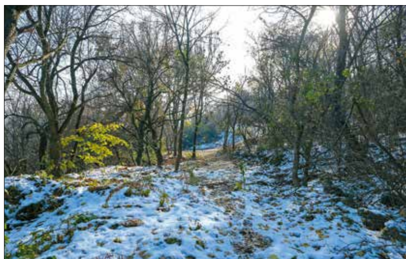
Nagyjából 8000 négyzetméter erdő maradhat meg a Rác Aladár út mentén