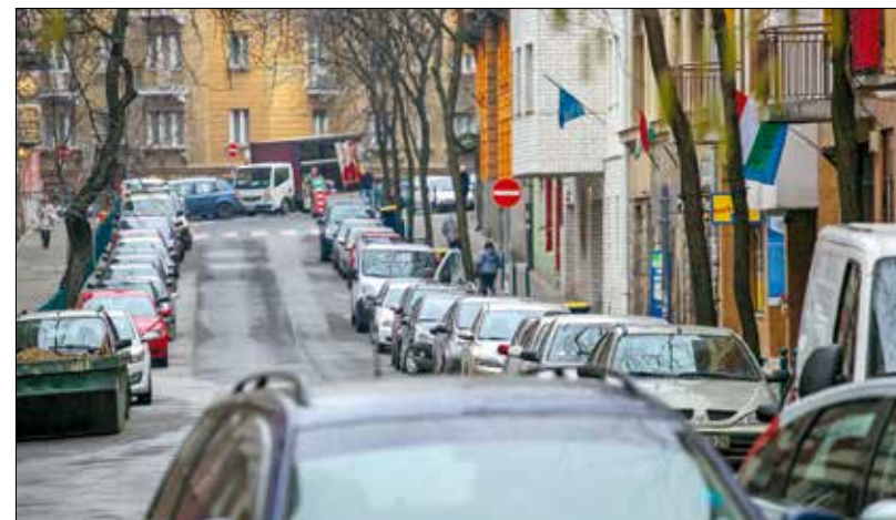
Jóval több a kiadott lakossági várakozási engedély, mint amennyi parkolóhely van