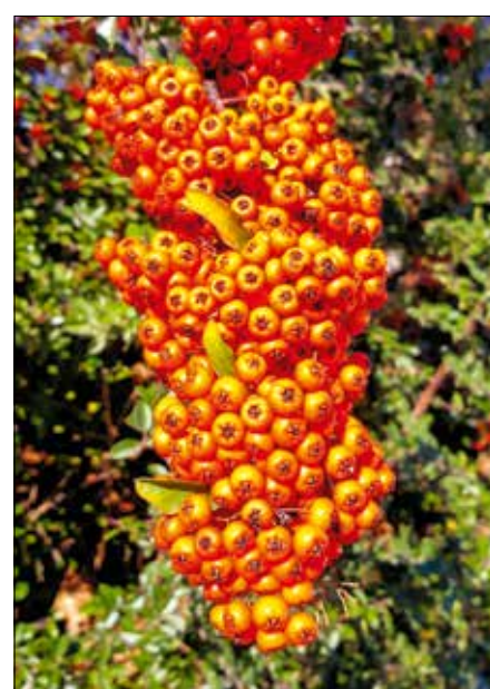
Akár a szennyezett városi levegőt is elviseli

Gondozását a metszés jelenti, amit bátran végezhetünk, nem teszünk kárt a növényben, amely erőteljes növekedésével gyorsan pótolja a levágott ágakat. Ügyeljünk azonban arra, hogy ha a friss hajtásokat tavasszal levágjuk, akkor elmarad a virágzás és a termés, ezért inkább késő ősszel, vagy az elhajtás előtt alakítsuk bokrainkat. Bár nem futónövény, mégis lehet találgatni házfalakat, kerítéseket beborító példányokkal, erőteljes növekedésüket kihasználva alakították ezeket kúszónövényé.