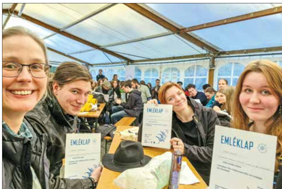
A jókedvű Arany-csapat