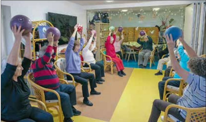
A gyógytorna az egyik legnépszerűbb közös foglalkozás az idősklubban

Amikor valaki távozik a közösségből, azt nemcsak nekem és a kollégáimnak, hanem a klubtagoknak is nehéz feldolgozni. Én senkinek sem akarom egyből kizárni az emléket. A szép, jóra emlékezem – a többiekkel együtt meg szoktuk nézni a képeket arról, aki eltávozott közülünk, beszélünk róla, emlegetjük őt. Leginkább az idő segít a veszteség feldolgozásában. Akárhány éve dolgozom is a szakmában, az emberek elvesztéséhez nem lehet hozzá szokni. A szociális munkát, az egész ittlétünket sem lehet csak munkaként kezelni. Én az életem részének tekintem a klub vezetését, a szabadidőmben sem tudok teljesen megelégedni a közösségtől. De ez nem teher, hanem jó érzés számomra. A klubunk nem gondozókról és gondozottakról