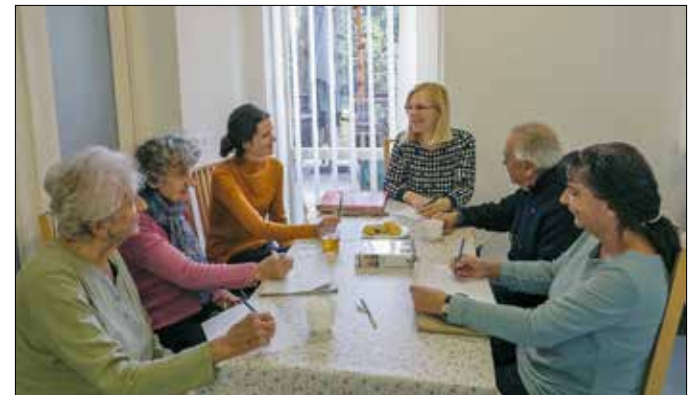
A különböző társasjátékok is segítenek a közösség összekovácsolásában

amikor azt kérdezték tőlem gyerekként, mi szeretnék lenni, mindig azt válaszoltam, hogy