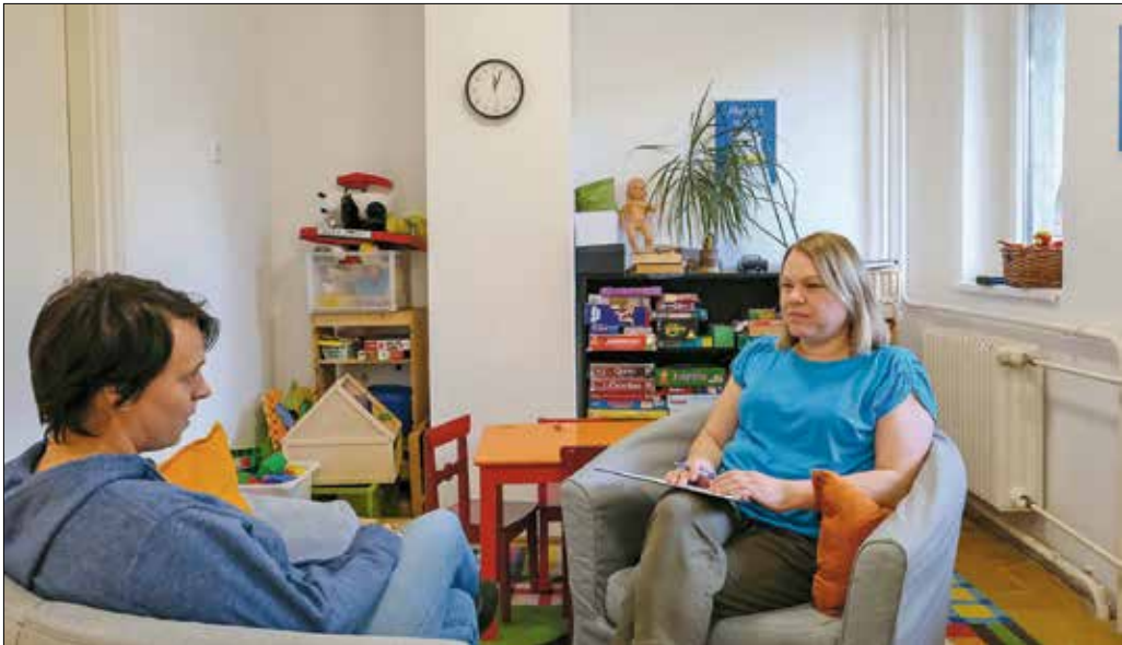
Ami az embernek segít, az a családjára javára is válik, és ez fordítva is igaz

port megtalálható itt: fogyatékos gyereket nevelő egyedülálló anya, egy demens idős szülővel élő középkorú családtag, egy mentális érintettségű család vagy egy anorexiás gyerek a családban. Ezeket a problémátípusokat nem a család anyagi helyzete határozza meg. Igaz, a minőségi ellátáshoz