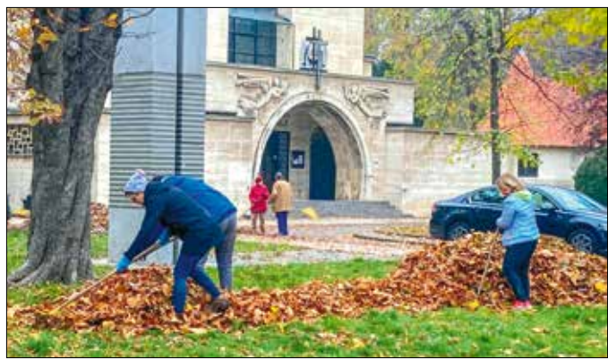
A nagy, sárgásbarna levélkucpacok jelezték a munka sikerességét

Emellett a szervezők fontosnak tartják hangsúlyozni, hogy közösségépítő alkalomnak is kitűnő az önkéntes munka. A környéken lakó résztvevők – és a munkavégzés alatt erre vetődő járókelők – számára is fontos üzenete a prog-