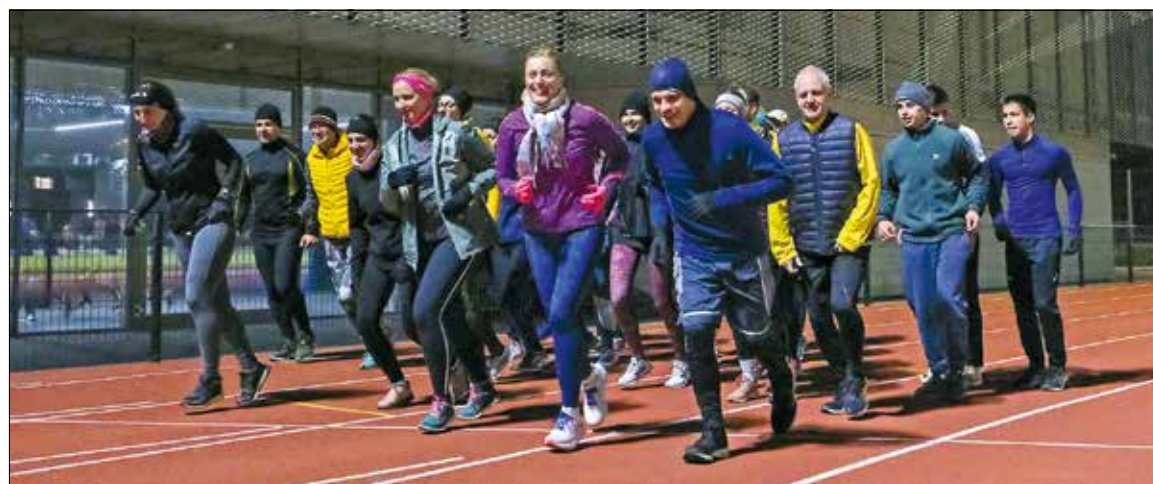
Ha egyedül nem megy, próbáljuk meg másokkal együtt!

kat igénylő futókat irányítja. Azt is hozzátette, hogy a teljesen kezdők sem érezhetik rosszul magukat, mert az edzők maximálisan figyelembe veszik az egyéni igényeket.