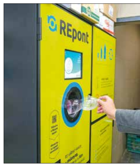
Jöhetnek a nonstop, 0–24 órás REpontok

Gyakorlattá vált ugyanis, hogy a nehéz körülmények között élők a kukákat felforgatva „vadásznak” az 50 forintot érő palackokra, eközben pedig sokszor szétdobálják a hulladékot az utcán. Ezt előzné meg a főváros a palacktartók kihelyezésével, aminek van még egy előnye: ez az egyszerű megoldás az újrahasznosítást is szolgálja. Működő példák jócskán vannak Európá-