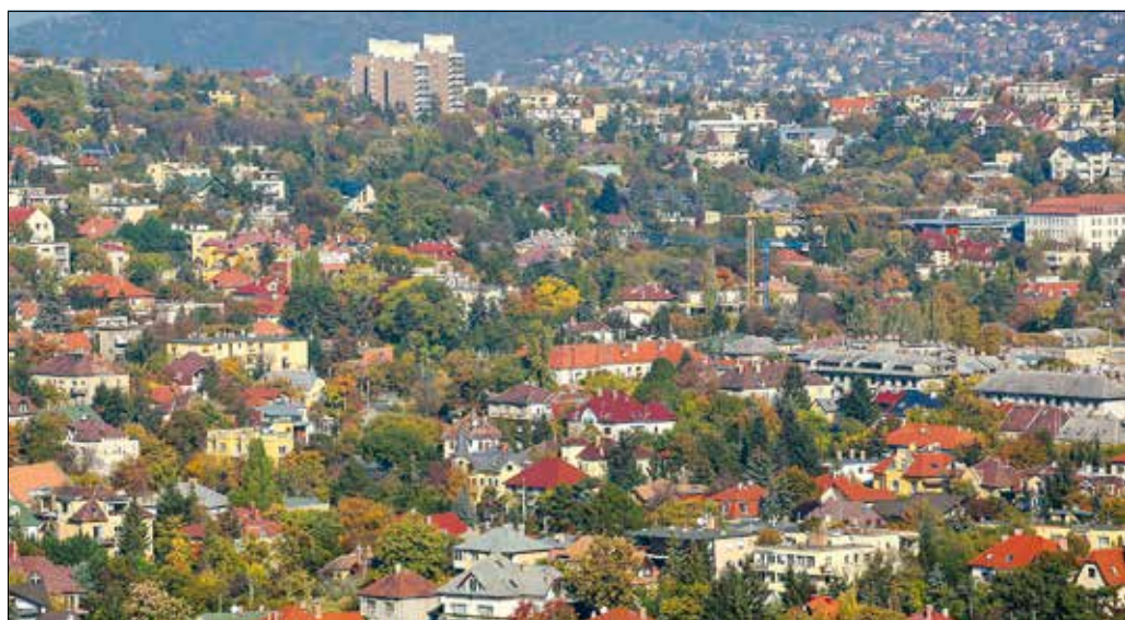
Megszűnik a rövidtávú bérbeadással érintett lakások építményadó-mentessége és -kedvezménye

nos mértéke jelenleg 2190 Ft/m 2 , ami 2025-től 2900 Ft/m 2 -re emelkedik.