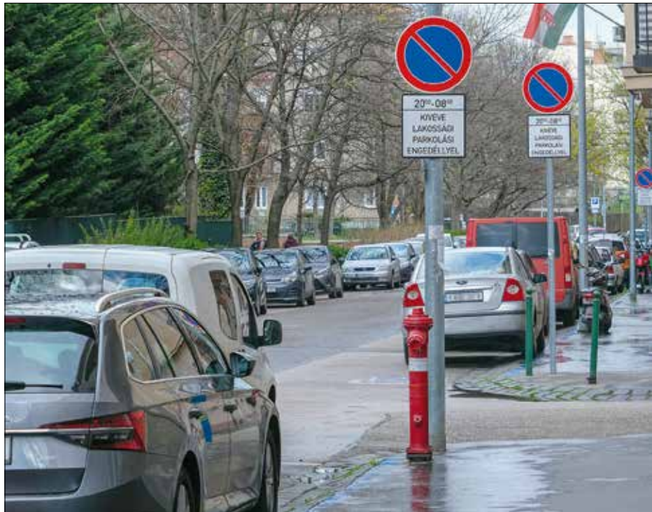
Az önkormányzat növelné a közterületeken a kizárólagos lakossági parkolóhelyek számát

• A csillebérci üdülőterület tulajdoni viszonyainak rendezése kapcsán folyamatban lévő társadalmi egyeztetés már véget ért, ám a 2024. június 15-i határidőt most 2025. március 31-ig meghosszabbította a testület, mivel újabb egyeztetésekre, majd pedig egy lakossági fórum lebonyolítására van szükség. A rendezéshez szük-