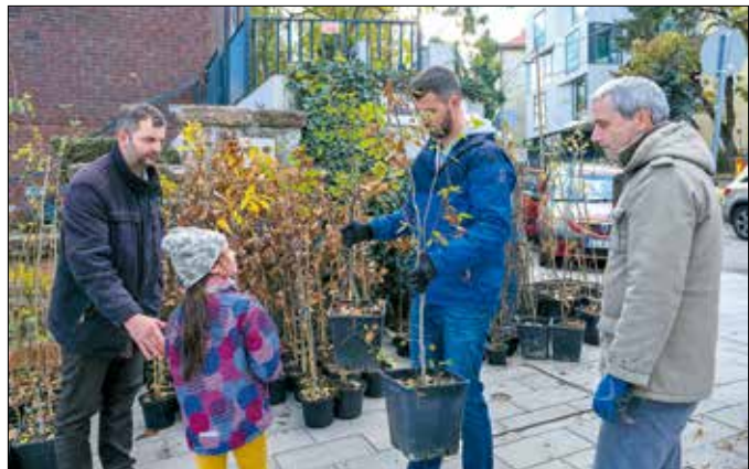
Ezúttal kilenc fajfajból lehetett választani

Zöld Iroda honlapján közzétett fajleírások adtak szakmai segítséget. Itt ismerkedhettek az érdeklődők a körisekkel is, amelyekből szintén szép számban vittek a kertbarátok. A legnépszerűbb magas köris mellett a pannon és a