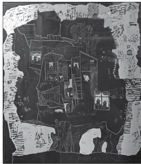
Bakonyi Mihály: Békés falu

■ A Mester és tanítványai című kiállítás megtekinthető: december 18-ig, ügyfélfogadási időben, hétfőn 13.00–17.30, szerdán 8.00–16.00, pénteken 8.00–12.00 óráig. Helyszín: polgármesteri hivatal, I. emeleti folyosógaléria, Böszörményi út 23–25.