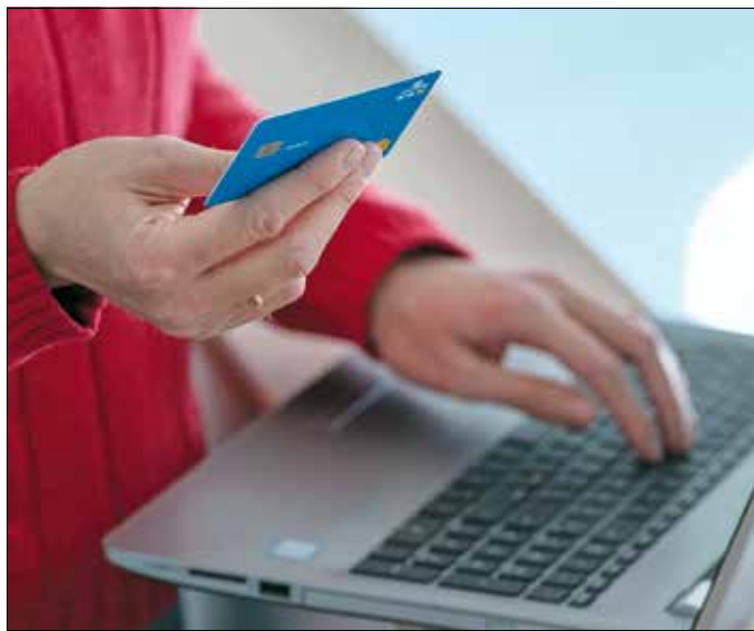
Semmiképpen se adjuk meg idegeneknek a bankkártyaadatainkat!

A Hegyvidéki Önkormányzat honlapjának címe: www.hegyvidek.hu