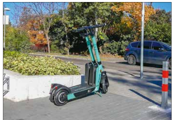
A XII. kerületben is szabályozva lesz a bérrollerek utcai elhelyezése