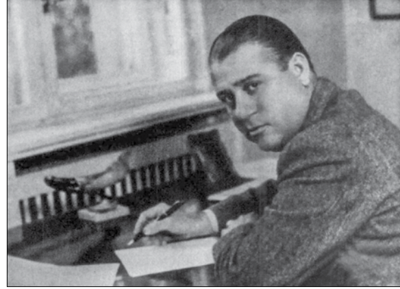
Fekete István író

Feleségem ma reggel kenyeret süttött a katonák konyháján. Reggel ő takarított, utána mosogatott,