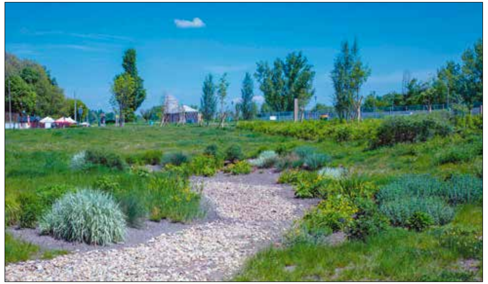
Az esőkert semmivel sem igényel több odafigyelést, gondozást, mint egy hagyományos virágágyás

Osszuk a kiválasztott területet zónákra, és a legkülső, száraz résztől a legbelső, leggyakrabban elárasztott mag felé haladva válogassuk a növényeket vízigényük