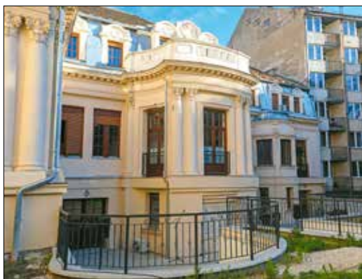
A Maros utcai egykori zsidó kórház épülete

„csak” ezeket a gyilkosságokat követték el. A háború után tömegsirt tártak fel a szervezet Városmajor utca 37. szám alatti központjánál is, ahol 1944 novemberétől