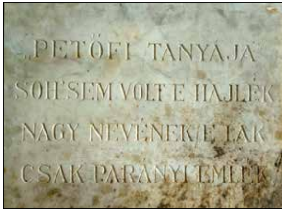
Szerencsésen megmaradt a vicces feliratú tábla