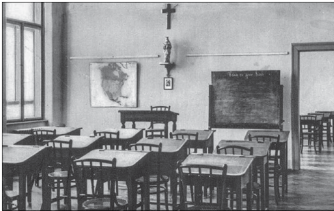
...és az egyik tanterme az 1940-es években

Hát folytassuk. Akármilyen nehezen. Kis gyertyám tart még, s mintha biztatna: – Írj... írj! Két nap megint elmúlt, s ennek a két napnak eseményei úgy összekeverednek bennem, hogy