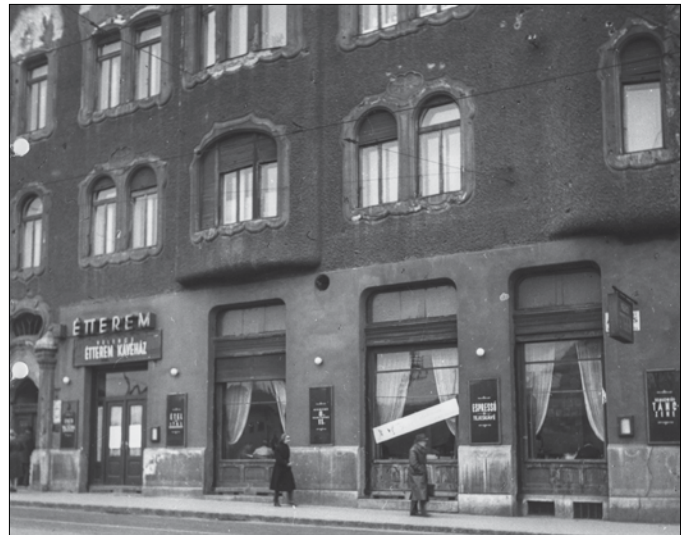
Ady törzshelye, a Délivasút kávéház egyik utódja, a Velence étterem

■ Az Emléktáblák a Hegyvidéken című könyv megvásárolható a Budapesti Városvédő Egyesület Böszörményi út 13. szám alatti irodájában és a varosvedo.hu weboldalon.