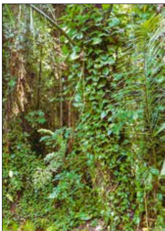
Futóka az őshazájában

Viszonylag könnyű beszerezni, mert az új év elején sok helyen árúsítják, még szupermarketekben is. Választhatunk egészen kis példányokat vagy méteres szárazakat, egyével vagy csoportba ültetve. A fajták tekintetében is széles a kínálat, bár nem minden változat kö-