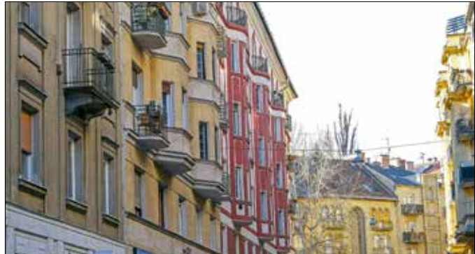
10%-kal emelkedik az önkormányzati lakások bérleti díja

hivatalban, így – a korábbi időszak gyakorlatával szakítva – a továbbiakban nem külsős cégek, hanem a hivatal munkatársai látják el az önkormányzat közbeszerzéseivel, beszerzéseivel kapcsolatos feladatokat. További változás, hogy a jövőben a jogi és ügyrendi bizottság is véleményezi majd a közbe-