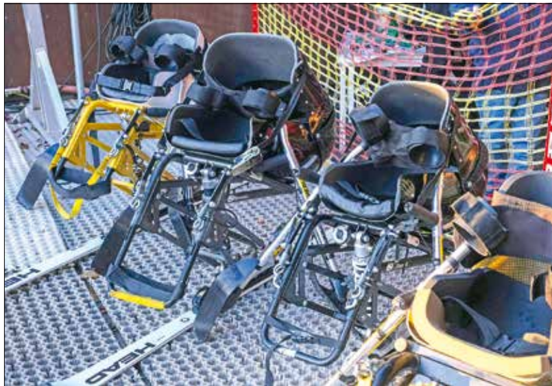
Bárki használhatja az új sporteszközöket, nem kell hozzá előképzettség

mostanra annyira népszerű lett, hogy a meglévő eszközpark már nem volt elegendő, ám bíznak abban, hogy a mostani fejlesztéssel ki tudják elégíteni az igényeket –