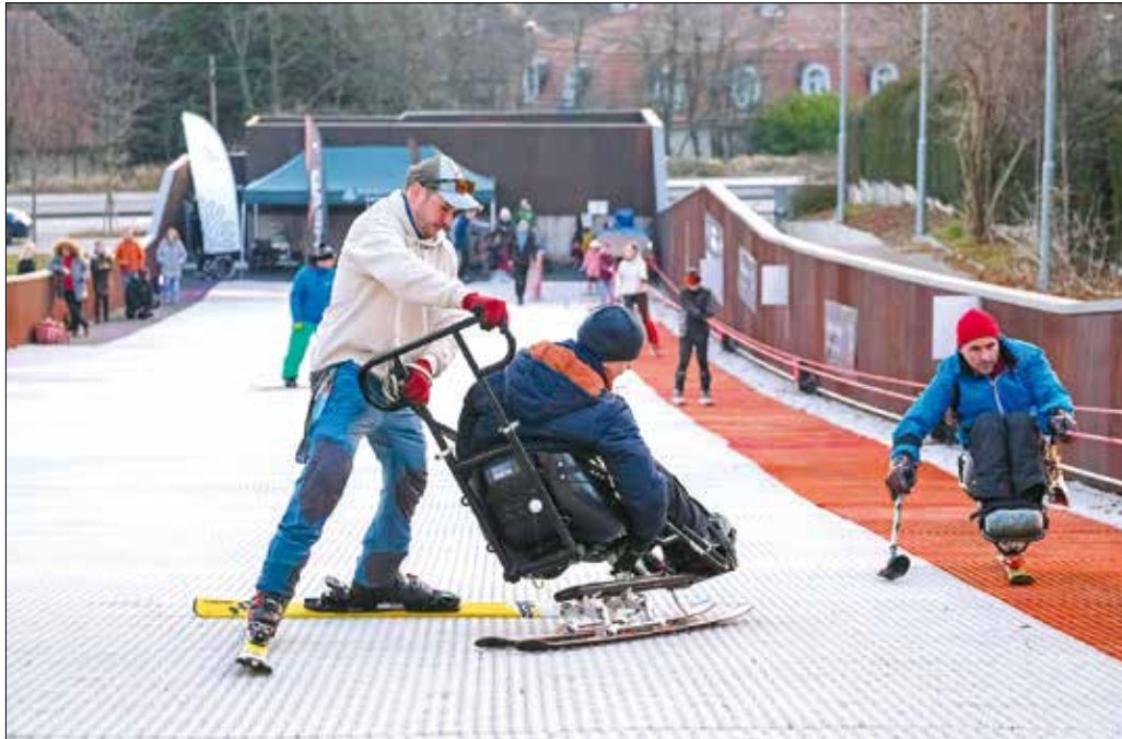
Akik egyedül nem tudnak végigmenni a pályán, azokat oktató kíséri

2024-ben 150 millió forint jutott a népegészségügyi termékadóból eszközvásárlásra, míg 50 millió a programok lebonyolítására – hívta fel a figyelmet Révész Máriausz, a Miniszterelnökség Aktív Magyarországért felelős államtitkára. Ez az összeg