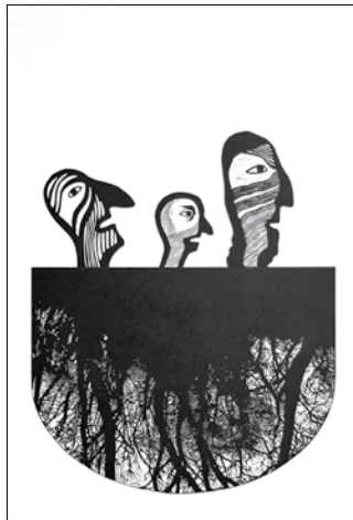
Elsüllyedt a horgászcsónak

Néhány műről külön is szólt a művészeti író. A Birodalom című munkánál a glóbusz tetején, mint a szemétdombon, kakas kukorékol, és ebben az aggodalomban van némi ironia – ami egyébként jellemző Patóra. Érzékelhetjük ezt az Elsüllyedt a horgászcsónak és a Dagonya című munkáin, valamint a Hűbériségnél, amin a kiszáradt, minden értékét elvesztett