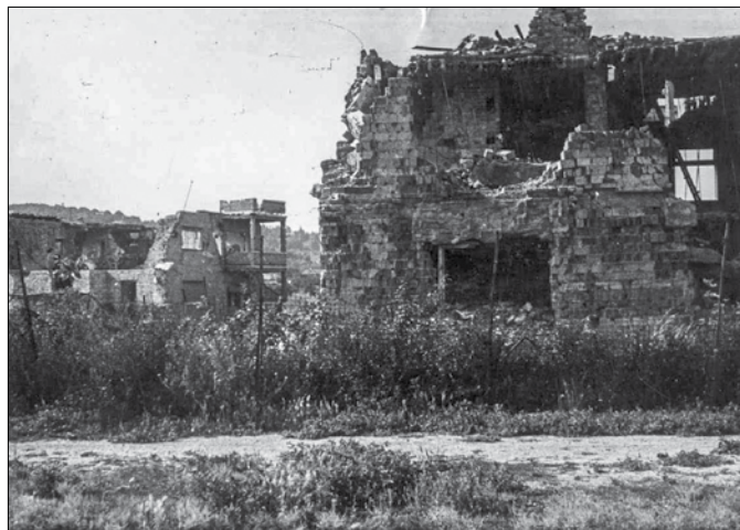
Háborús károk a Notre Dame de Sion utcájában, a Meredek úton (1945)

Egy pap és négy vagy öt apáca is itt maradt, és úgy járnak-kelnek milliós drága otthonukban, mint a kísértetek. Halványan, szó nélkül, és arcukon látszik, hogy arra gondolnak, ami volt, ó, nem a melege, a kényelemre az ételekre és szőnyegekre, hanem a vidám nevetésre, a gyermekzajra, ragyogó tisztaságra, fegyelmre, elszéledt kislányokra, akik úgy indultak innét el, mint a jövődő anyák tiszta ígérete. És most a társalgóban csonka, véres halottak