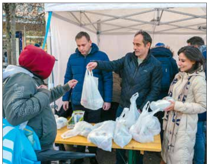
Meleg étel, tartós élelmiszerek és édességek voltak a csomagokban