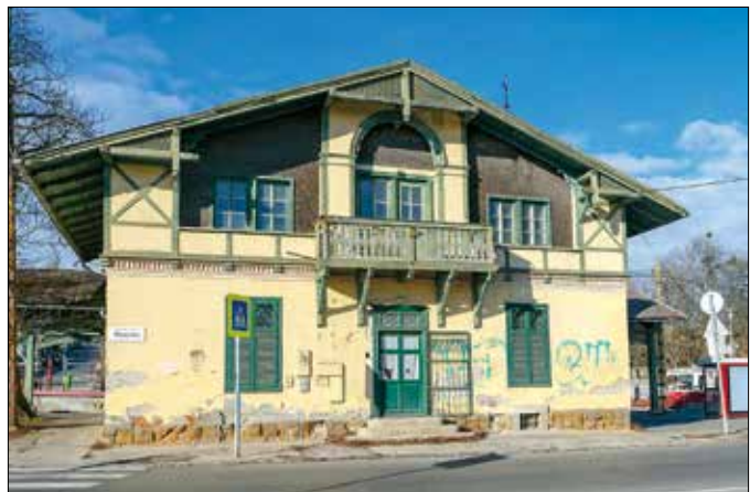
Az önkormányzat felújítaná a fogaskerekű elhanyagolt állomásépületét

A polgármester arról is beszélt, hogy a Böszörményi úti, egykori irodaházak helyén létrejövő üres telken parkot és közösségi teret hozna létre az önkormányzat, míg a lakóházak közti „foghíjat” egy szűk épülettel zárna le. Ehhez a