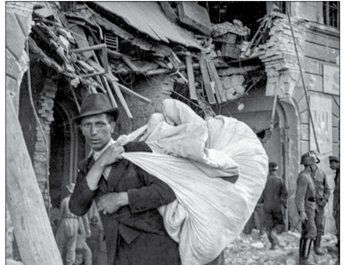
Egy hajléktalanná vált ember költözködik Budapest ostroma idején

Tegnap nem írtam semmit, mert csak ismételttem volna magamat. Bomba, akna, gránát, géppuska... nagy füst Pest felett, és minden este temetés.