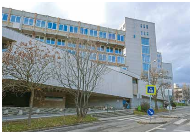
Újabb eszközbeszerzéssel segíti az önkormányzat a Kútvolgyi szakrendelő működését

• A MOM Sportot üzemeltető önkormányzati cég, a Hegyvidéki Sportszarnok és Sportközpont Kft. 2025 első negyedévében is az