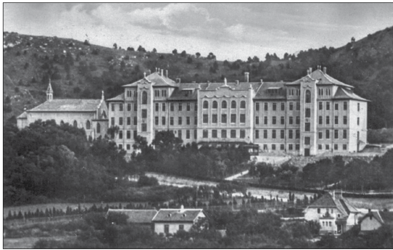
A Notre Dame de Sion épülete...

Szóval elindultunk hazulról. Egy tarisznya, két hátizsák, négy nagy bugyor, s ideát voltunk. Leírni persze ezt nem könnyű, a valóság azonban jajkeserves nehéz volt. Az asszonyokat – mások is vannak a házban – úgy kellett áthúzni. Az út körülbelül háromszáz méter, de ugyanannyi kilométerre való izgalom sűrűsödött benne össze.