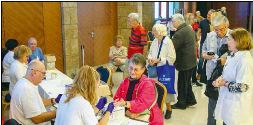
Az új önkormányzat folytatja a Hegyvidéki Egészségnapok hagyományát

ahol nincs betöltetlen praxis, az egyik a miénk. Ám mi sem dőlhetünk hátra, mivel két házi orvos is jelezte, hogy a közeljövőben befejezi a működését. Az egyik helyen megoldódni látszik a probléma, a másik esetben lehet, hogy az önkormányzatnak kell majd működtetnie a praxist. Emellett nálunk is sok idősebb házi orvos dolgozik,