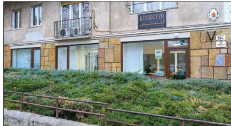
Fontos az átláthatóság: az iroda bejárata az utcára nyílik, bárki betérhet oda

Az új önkormányzati iroda feladata lesz az is, hogy egy-egy konkrét cél megvalósítása érde-