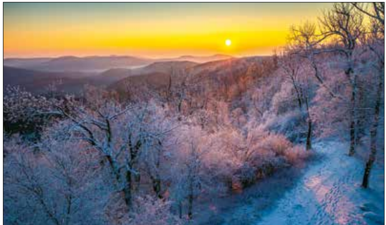
Az erdő kulcsfontosságú tényezője a klímavédelem szempontjából

Erdészeti szempontból jelentős előrelépés, hogy a kitermelt ipari és tűzifa egyre nagyobb része az