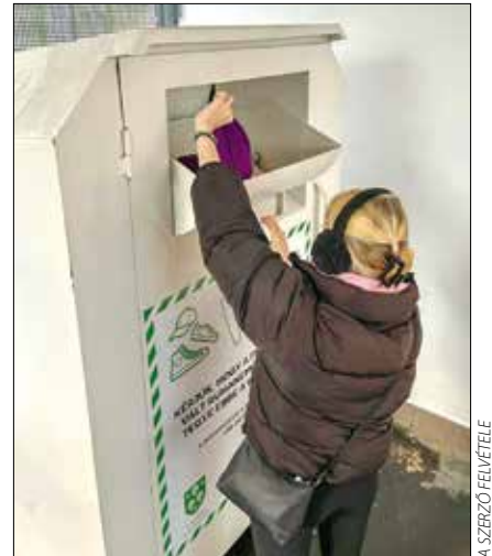
Textilgyűjtő konténer a Fény utcai piacon

Az összegyűlt ruházati cikket, cipőket és lakástextil-hulladékot a MOHU válogatja, és amennyiben lehetséges, újrahasználatra átadja, a gyengébb minőségű például géprongyként hasznosítja újra, a legrosszabb állapotúakat pedig aprítással vagy égetéssel semlegesíti. A társaság eddig országosan ezer textilgyűjtő konténert helyezett üzembe, és további kétezer telepítést ígéri a következő három évben. Jelenleg tehát a helyszínek keresése zajlik, de a XII. kerületben – a Testnevelési Egyetemen – és a kerület közelében – a Fény utcai piacon – már most is található egy-egy gyűjtőpont.