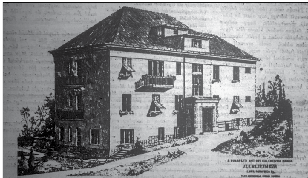
Az Alma utcai szeretetotthon épülete és (a fenti képen) a belső kertjében 1996-ban állított emléktábla

Korábban a Nemzetközi Vöröskereszt mellett őt semleges állam – Svédország, Svájc, Spanyolország, Portugália és a Vatikán – diplomáciai képviselői megállá-