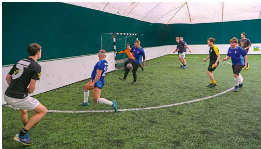
Szép megoldások, sok gól – minden biznnyal lesz folytatása az első városmajori fedett pályás focitornának

„Láttuk, hogy van igény ezekre az egynapos bajnokságokra, a csapatok jelezték, hogy szívesen