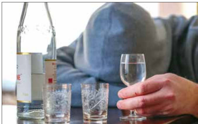
A fiatalok legtöbbször töményt isznak, ami komoly veszélyt jelent rájuk

látzatát. A gyerek például egy idő után egyetlen barátját sem hívja el az otthonába, vagy ha az apa nem megy el iskolai programokra, az anya azzal menti ki őt, hogy sokat dolgozik. Ez a helyzet borzasztóan megerőltető az egész család számára, mégis rendszerint mindenki bevonódik ebbe a kis „játékba”, az egész család e köré kezd szerveződni.