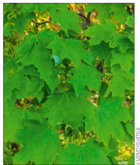
Leveli nagyok, jellegzetesek

A XII. kerület kifejezetten jelentős koraijuhar-állománnyal rendelkezik. A Németszőlgyi út Hegyalja út és Istenhegyi út kö-