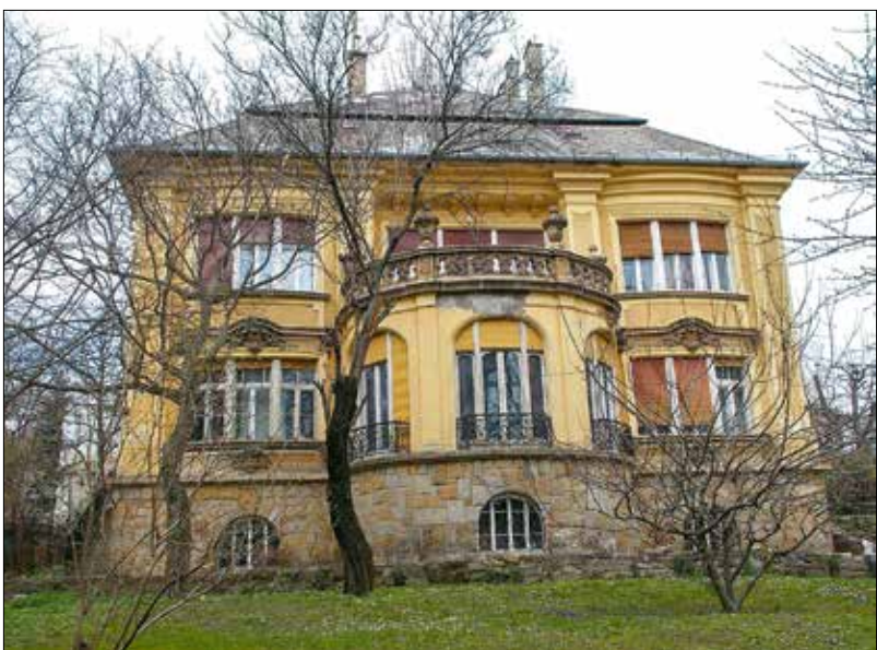
Németszőlgyi út 5.: ide költöztek be a nyilasok 1945 januárjában

szállóból irányította az eseményeket Adolf Eichmann és stábjá, a magyar közigazgatási szervekkel együttműködve.