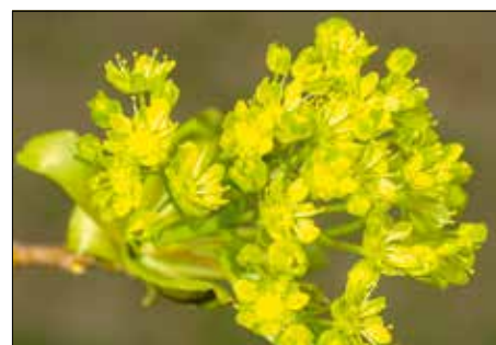
A korai juhar virága mézben gazdag

bükkök között. Virágzás idején az erdőben hallani is lehet, merre vannak a korai juharok, mert zöldessárga, jellegtelen, de mézben gazdag virágai a beporzók tömegét