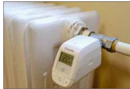
Egy gombnyomással állítható a fűtés

Az elavult kazánokat és bojler modern, kis fogyasztású, környezetbarát eszközökre cserélték a szakemberek. Beépítettek egy hőszivattyús rendszert és egy