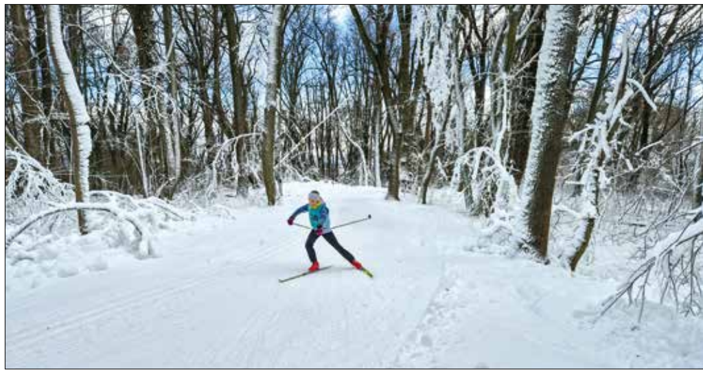
A sífutás fejleszti az erőnlétet, a légzési és a keringési rendszert, jó hatással van a közérzetre és az immunrendszerre