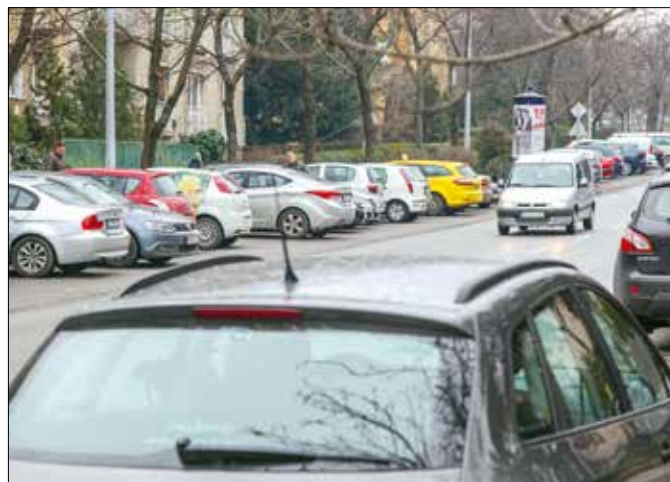
További parkolási kedvezményeket vehetnek igénybe a nagycsaládosok

A Zsolna utca 4. számú telket érintően, ahol a nemrég bővített Budapest British International School működik, módosította a