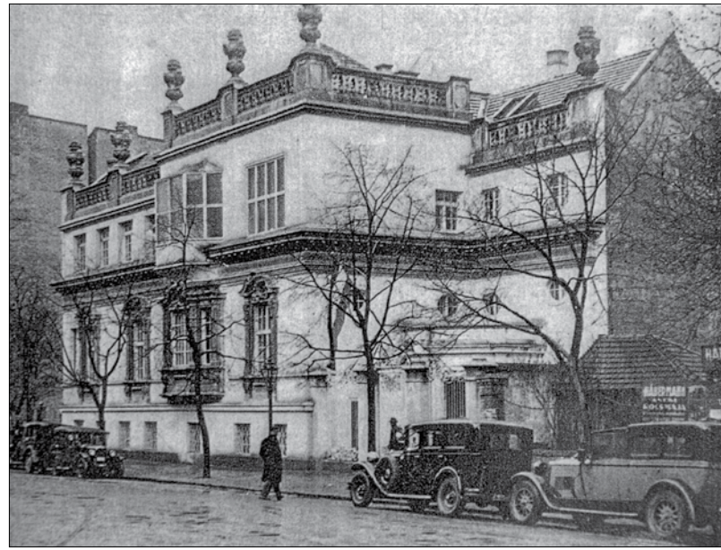
A Maros utcai Chevra Kadisa kórház, az első városmajori tömeggyilkosság helyszíne

Az Alma utca 2/b alatti Orthodox Szeretetotthon volt a harmadik tömegszárlás helyszí-