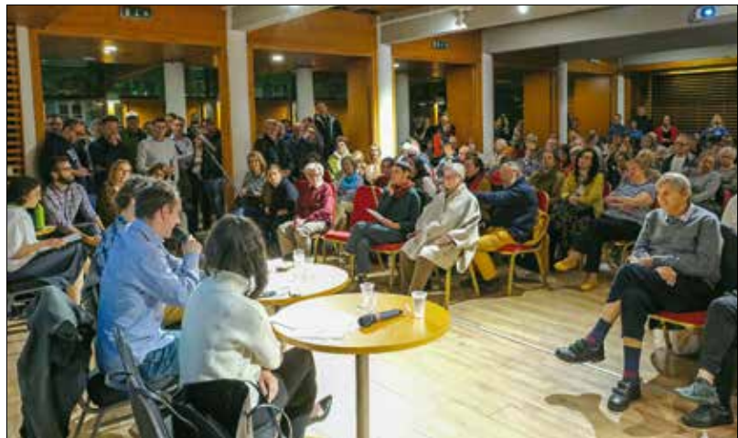
A „Találkozz a polgármesterrel!” fórumokat is az új iroda szervezi mostantól