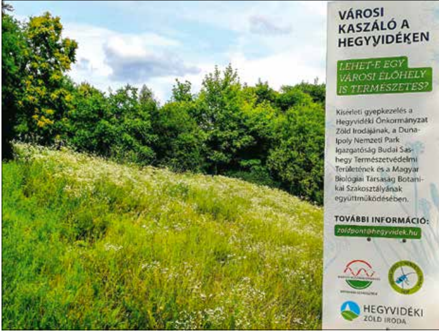
Örömteli, hogy visszaszorultak az egyényári fűfélék, és tavaly nem jelent meg itt a parlagfű

A természetesség szempontjából szintén örömteli az egyényári fűfélék további visszaszorulása. Ezeket az egyszerű fajokat is az egyre jobban megerősödő őshonos