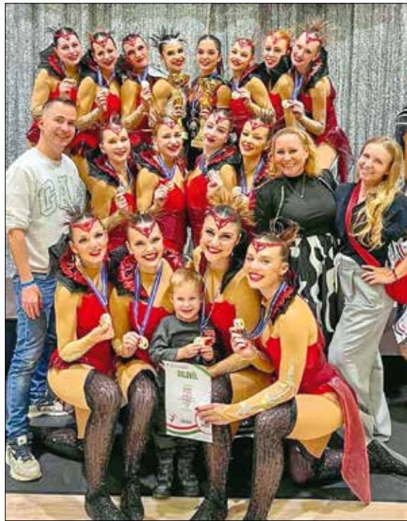
Sikert sikerre halmoznak a Rock and Magic SE versenyzői

– A sport rendszerességre és kitartásra tanít, amit nagyon jól tudok hasznosítani a tanulás terén is. Szoros az időbeosztásom, így mindig folyamatosan készülök az órákra. Arra töreksem, hogy mindenhol kihozzam magamból a legjobbat. Az iskolában a tanáraim is maximálisan támogatnak, elfogadják, hogy a versenyzés egyben sok utazással is jár. Nagy örömet jelent, de rengeteg munka áll amögött, hogy háromszor voltam „Magyarország jó tanulója, jó sportolója”, tavaly pedig