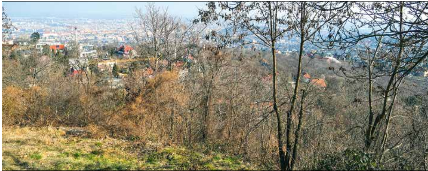
A mostani döntés után összesen több mint 30 ezer négyzetméterrel lehet nagyobb az erdőterület mérete a XII. kerületben

kemping erdő helyett rekreációs övezetbe, míg a Gaál József út 21/a szám alatt egy helyi védelem alatt álló épület és az ahhoz csatlakozó út a szomszédos lakóterülethez hasonló övezetbe kerülne.