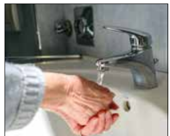
Hazaérkezéskor mossunk kezet!

Az influenzavírus cseppfertőzéssel, a levegőben, testi érintkezéssel és tárgyakon keresztül terjed. Főbb tünetei: láz, izomfájdalom, hidegrázás, levertség, torokfájás, fejfájás. A láz nagyjából 1-5 napig tart, közben megjelenhet a száraz köhögés, ezt követően