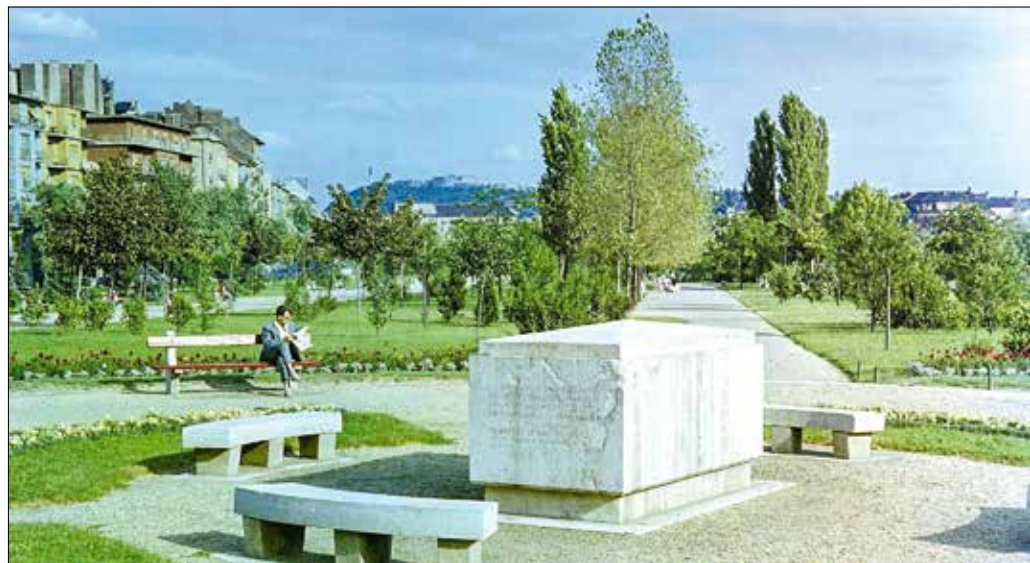
A magyar jakobinus mozgalom emlékére emelt kőkoporsó a Vérmezőn (1964)

egyfajta felvonulási területnek tartották fenn, a 20. században több bemutató, lovas gyakorlat, verseny zajlott a téren. A két világháború között felvonulások, eskütevételek és nagyszabású események helyszíne volt, sőt még a nemzeti stadion ideépítése is felmerült, ám ez végül nem valósult meg.