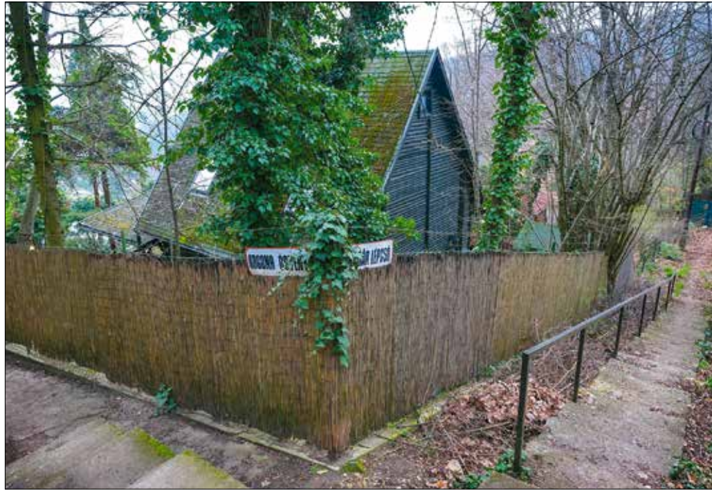
Az üdülőterület útjainak többsége semmilyen szabványnak nem felel meg

halad keresztül. Az önkormányzat tárgyalásokat kezdeményezett az erdőgazdasággal, hogy a tulajdonában lévő, erdőként