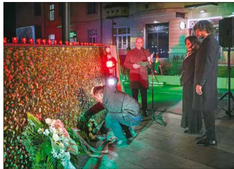
A XII. kerület vezetői is részt vettek a közös megemlékezésen

„A mindennapos harcok, a folyamatos légitámadások pokoli valóságot teremtettek mindenki számára az addig nyugodtnak hitt Buda életében is. A Városmajor, a Széll Kálmán tér és a Vérmező környéke kegyetlen harcok színhelyévé vált, ahol a németeknek és az őket támogató magyar csapatoknak óriási áldozatok árán sem sikerült feltartani a szovjetek előrenyomulását. Mindeközben a nyilasok a Városmajorban több mint háromszáz embert gyilkoltak meg brutális módon. A gyűlölet és az erőszak legsötétebb pillanatai közé tartozik ez a ma-