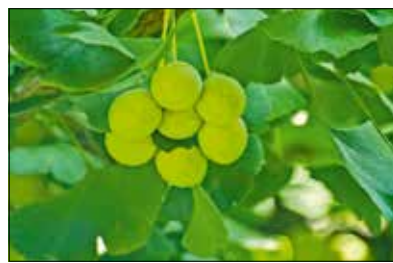
A termésnek intenzív „macskaszaga” van

A növény egyedülálló, legyezőszerű levelei szinte változatlanul vészelték át a földtörténeti korokat, hogy ma ker-