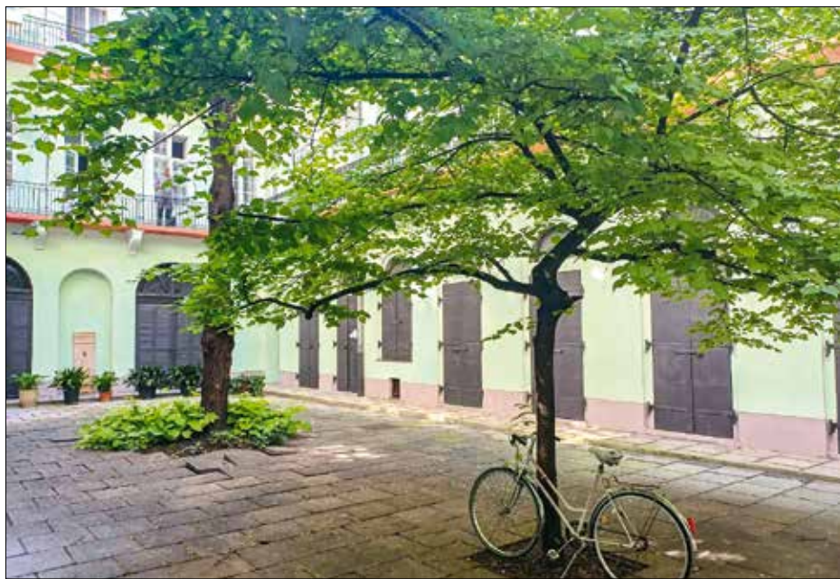
Az egyre forróbb nyarak miatt felértékelődött a lakóházak belső udvarainak rekreációs szerepe

zajlik a vita a felek között a szolidaritási hozzájárulási adó miatt, amit Budapest jogtalanul tartott, mondván, a vonatkozó törvények értelmében nem lehet elvonni az önkormányzatok saját bevételeit. Arról nem is