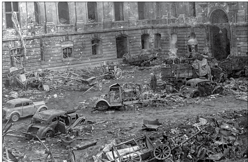
A háború idején a mai Budavári Palota és környezete is csatatérre vált