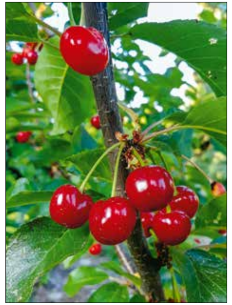
A meggyet augusztusban kell metszeni!

A metszés időzítésével kapcsolatban a szakember azt javasolta, hogy a fiatal fákat lehetőleg tavasszal metszünk, mert ez növekedést indukál, azaz gyors-