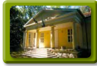
LÍVIA-VILLA Költő utca 1/a 06-1/395-8284 liviavilla.hu

első padnál. Információ: 06-30/306-0760, meszaroslaszlon@t-online.hu.