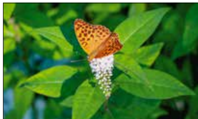
Gyakori vendég a kertekben

A pókhálós lepkének ( Araschnia levana ) ítélte oda az „Év lepkéje” címet az idén a Magyar Madártani és Természetvédelmi Egyesület Lepkevédelmi Szakosztálya a hazánk természeti kincsei és az ezeket fenyegető természetvédelmi problémák bemutatásának szándékával indított programjában. A tarkalepkék-