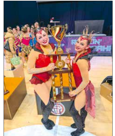
A 2024-es világbajnoki tróféával

„Magyarország tehetsége” díjazott, ezek mellett kitüntetett a XII. kerület, ahová gimnáziumba járok, a XI. kerület, ahol élek, és a főpolgármester úrtól is megkaptam az „Élen a tanulásban, élen a sportban” elismerést.