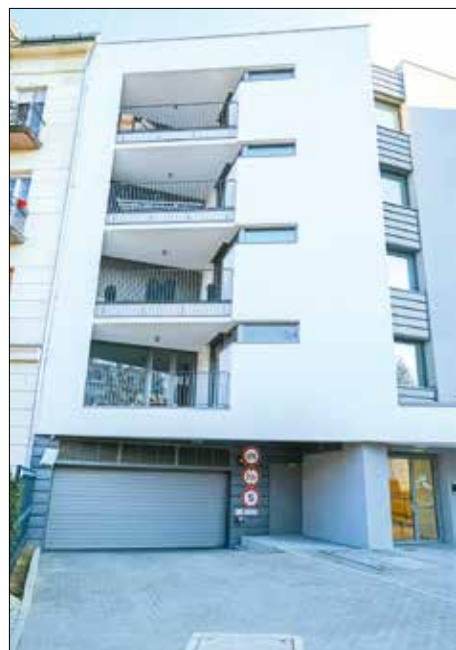
Többet pályázhatnak a kiadó parkolóhelyekre

szabályok megváltoztatásával nyilváníthatók beépítésre nem szánt erdőövezetté a XII. kerületi építési szabályzatban. A képviselő-testület ezért javaslatokat tett a készülő új fővárosi településtervezéshez, hogy végrehajthatók legyenek az önkormányzat által szükségesnek vélt átsorolások.