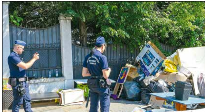
A közeljövőben végleg megszűnik a „kipakolás” jellegű lomtalanítás

hálózata: minden városi lakóhelytől 800 méter távolságon belül lesz legalább egy ilyen hely. Az összetett elvárásrendszer és a városstruktúra sajátosságai miatt a gyűjtőpontok kialakítása nehézségekbe ütközik a Hegyvidék védelmet igénylő zöld területeinek szomszédságában és a sűrűn beépített, városias részén is, így mind a helyszínek kijelölése, mind az egyéb szervezési feladatok végrehajtása részletesebb egyeztetést igényel.