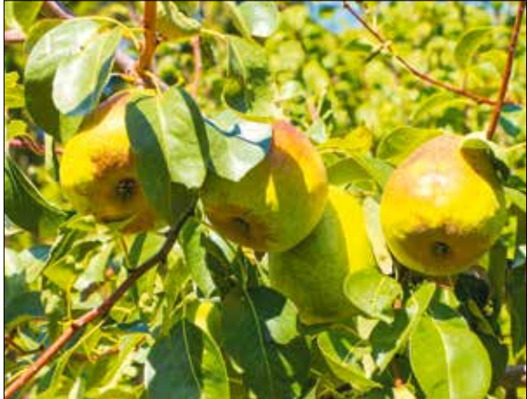
A körtefáknak központi tengelyes a koronaformájuk

A kertész szakma egyik alapvetése is megingott a közelmúltban. Sokáig azt vallották a szak-