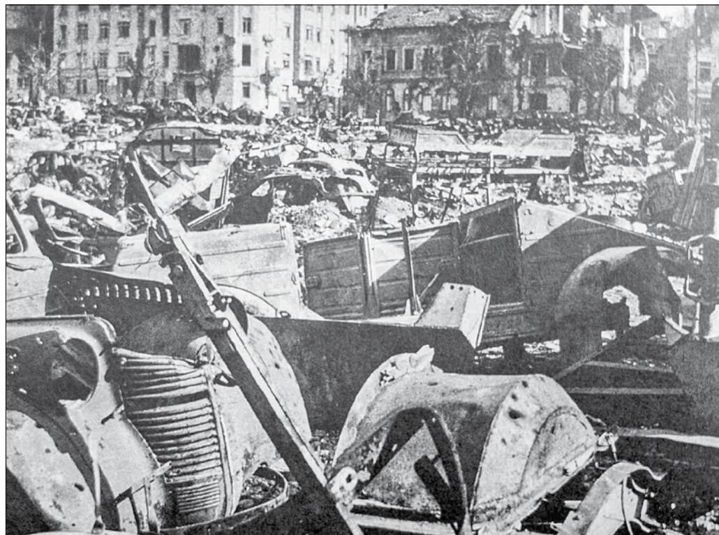
A háború után hatalmas mennyiségű járműronccsal, törmelékkel, betontömbbel töltötték fel a Vérmezőt