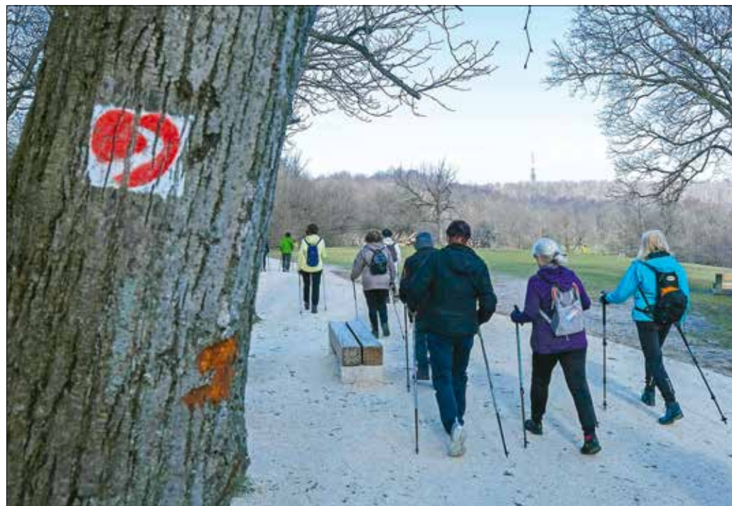
A rendszeres mozgás jó hatással van a cukorbetegségre, a kösvényre és az ízületi problémákra is

pont kardiológus főorvosa elmondta, hogy magas vérnyomásos krízis, stressz hatására az érbelen mikroszkopikus repedések alakulnak ki, amelyekben felhal-