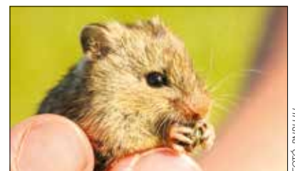
A magyar szöcskeegér márpedig létezik!

A Borsodban megtalált törekeny populáció mellett még Kolozsvár térségében