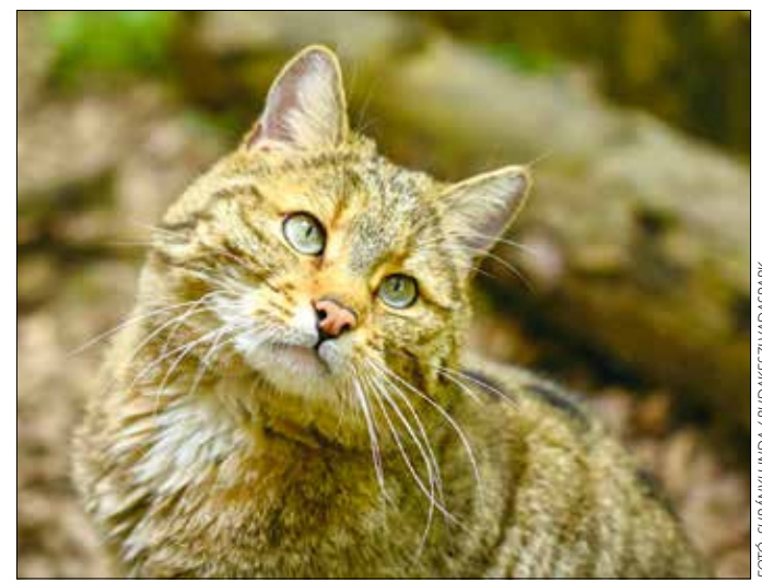
Néha szinte lehetetlen megkülönböztetni a vadmacskát a házitól

Persze a vadmacskavédelmén túl is van élet a Budakeszi Vadasparkban, amit több rendezvény is bizonyít a közeljövőben. A beporzók napja alkalmából március 8-án izgalmas programokban lehet részt venni, a méhekstól a méhecskés társasjátékokon át a beporzókról szóló előadásokig. A legbátrabban kézbe vehetik a méhészközöket, sőt egy valódi méhészközhöz is felbárályozhatunk, és betekinthetünk a kaptárok ismeretlen, nyüzsgő világába. Aznap