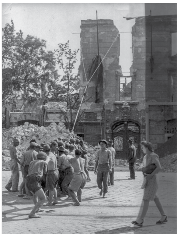
A romos fővárosban csak lassan indult meg az élet (1945)

A cikkben egy másik újságíró az első szerelvény megérkezéséről adott helyzetjelentést: „A vonat indul, a kis mozdony túlköl és a riporter felkapaszkodik az első szerelvényre. Húsz csille indul, tartalma tizenöt köbméter, súlya közel három tonna. Megnyomom a stoppert. A Vár romhalmazának első küldeménye 9 perc és 56 másodperc alatt érkezik el az újjáépítés jegyében új állomáshelyére. A csillében, amelyen állók, egy halom szemét. Por, téglatörmelék, elégett családi otthonok üszke és egy megfeketedett Bergmann-cső, amelyen keresztül talán egy tudósnak vagy művésznek vitte a világyáradót a fényt. A csille megérkezik és pillanatok alatt kidobja