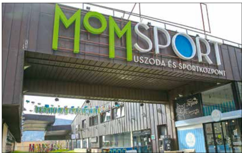
A MOM Sport felújítási munkáira is közbeszerzést ír ki az önkormányzat

szervezetét is kizárnák. Azt is hangsúlyozta, hogy pártok és pártokhoz kötődő egyéb szervezetek nem indulhatnak a pályázatokon.