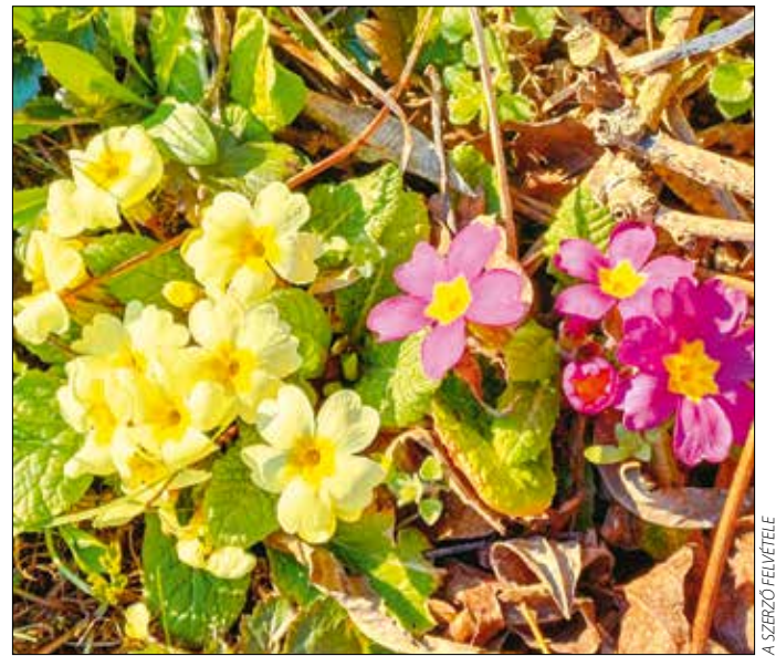
Szerencsések vagyunk, a XII. kerületben gyakori látvány ez a kedves virág

A virága gyulladáscsökkentő hatású, gyökerének főzetét pedig köhögéscsillapításra használták