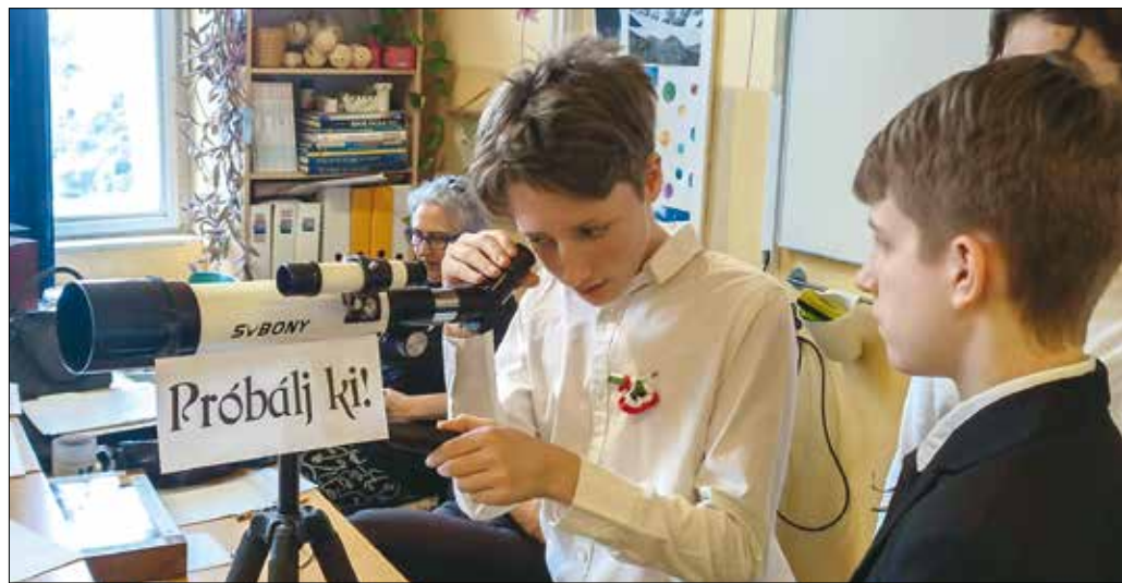
És mégis mozog a föld (minden állomáson egy-egy Jókai-regény elevegedett meg)

Az alsósok a hagyományos helytörténeti vetélkedőn és kézműves foglalkozásokon vettek részt, karkardát és zászlót készítettek, míg a felsősöket a második emeleti, szabadulósobává átalakított terem várták, sok-sok rejtélytel és feladattal. Az osztályok tagjai állomásról állomásra haladtak, mindenhol egy-egy