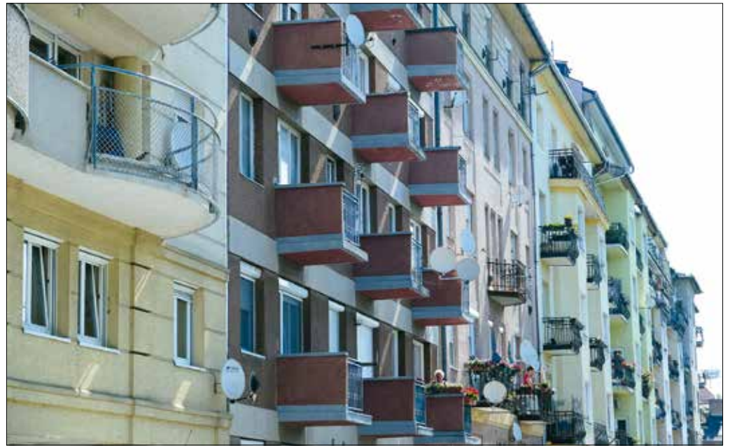
Az épület új színének kiválasztásakor alkalmazkodni kell a környezet színvilágához

Kötelező a bejelentés a műemléki környezetben vagy műemléki jelentőségű területen álló, egyébként nem védett ingatlanokon végzett homlokzatfelújítások esetében is. Arról, hogy az érintett ingatlan ebbe a kategóriába esik-e, a helyrajzi szám ismeretében az önkormányzat honlapján (hegyvidek.hu) elérhető Minerva térinformatikai rendszerben kaphatunk információt. Amennyiben ilyen