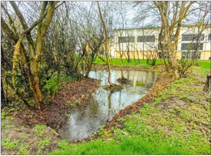
Gyűlik az esővíz egy intézmény udvarán kialakított esőkertben

■ Az új kiadvány – a sorozat többi füzetével együtt – a budapest.hu/zold-budapest/zoldfeluletek/tervezoknek-internetes-cimrol-toltheto-le .