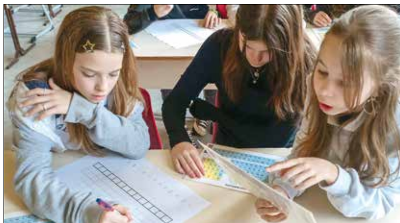
A Fekete gyémántok történetét is ismerni kellett a feladatok megoldásához

keresgéltek a térképen, a Fekete gyémántok történetét felidézve gipszöntvényekből bányásztak ki rejtett titkokat, sőt A cigány-