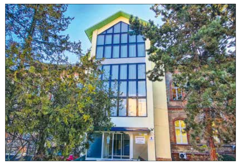
Az egykori Budai Meddősegi Centrum ma az egyik legjobban felszerelt intézet

Az orvosigazgató szerint a kezelések eredményességét, a gyermekszületések számának növekedését nagyban segíti, hogy átalakult az állami finanszírozás módja. Korábban csak öt stimuláció is ezekhez kapcsolódóan egy-egy beültetés költségét állta az egészségkassa, így ha az első stimuláció után még maradt embrió, és ezeket újra beakarták ültetni, az finanszírozási szempontból újabb cik-