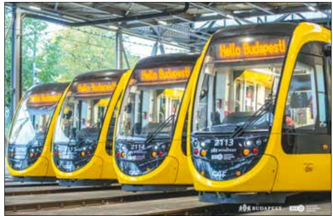
Újabb CAF villamosok álltak forgalomba Budapesten

Ennek részeként a Budapest Gyógyfürdő és Hévízei jelenleg is vizsgálja a dunai fürdőhelyek létesítésének lehetőségét, annak érdekében is, hogy a Duna-part már a közeljövőben ismét a budapestiek mindennapi életének része legyen.