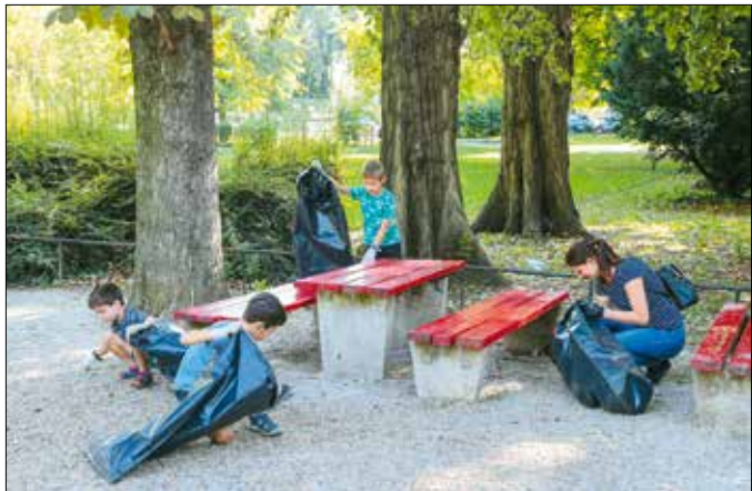
A szemétszedő akciókat is támogatja az önkormányzat

■ A részletes pályázati kiírások, valamint a kitöltési és beadási útmutatók megtalálhatók az önkormányzat honlapján, a hegyvidék.hu/palyazatok-2025 oldalon. A pályázati felhívások lapunk 4–5. oldalán is elolvashatók.