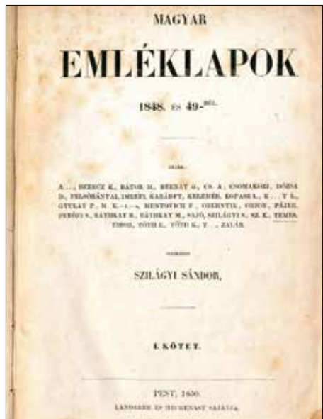
Jókai Mór Sajó álnévén publikált

A Jókai önéletrajzából ismert történetben több minden tisztázatlan. Témánk szempontjából azonban a fő kérdés az, hogy melyik svábhegyi házról van szó. A legtöbb forrás egyszerűen csak egy „svábhegyi villát” említ, és még Mikszáth sem tudta pontosan beazonosítani a helyszínt. Maga Jókai sem volt konkrét, egy 1848. június 15-én kelt levelében így írt édesanyjának: „Kedves anyám. Egy pár nap óta kinn lakom a Svábhegyen s azóta egészséges vagyok.