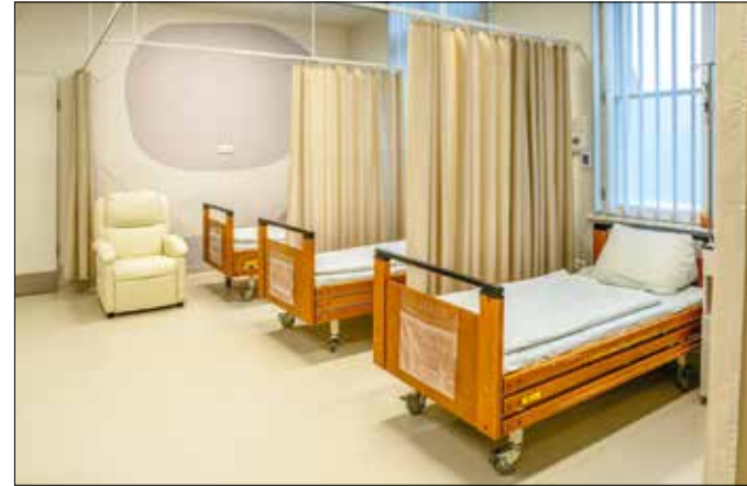
A kezelési ciklus minden elemét teljes mértékben támogatja az állam

„1992-től 1999-ig – amikor ennek az intézetnek a csapatához csatlakoztam – összesen 1800 pár jelentkezőt kezeltem. Ma már közel járunk a 33 ezres számhoz, azaz ennyi pár kivizsgálása történt meg az intézetben, s mintegy 30 ezer esetben a ke-