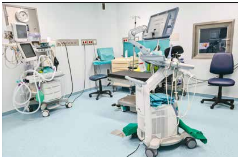
Csaknem 13 ezer gyermek született meg a sikeres kezelések eredményeként

a műtői szárny, amelyhez egy korszerűen felszerelt, kétágyas posztoperatív őrző is kapcsolódik. A beruházás részeként új betegváró és látogatói váró épült, továbbá megtörtént a teljes IT-s rendszer modernizálása.