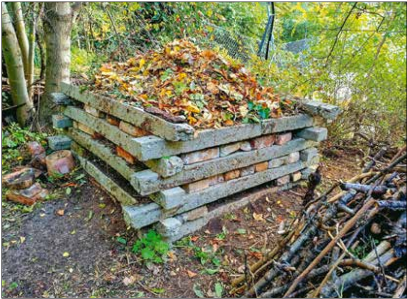
A száraz tavaszi napok tökéletesen alkalmasak a komposztáló ellenőrzésére

lomb, s ha a komposztáló teljes térfogata nem is alakult át tápanyagban gazdag földdé, az alsó felelőből biztosan kilapátolhatjuk a komposztot.