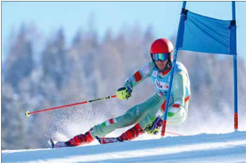
A szlalom a kedvence, de az óriás-műlesiklást is szereti