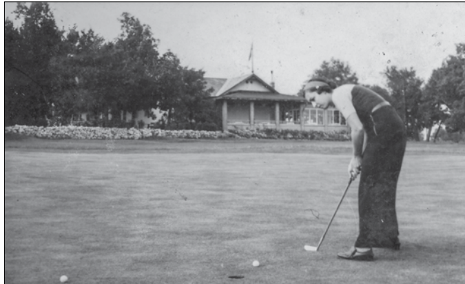
A későbbi golfpálya, háttérben az egykori Latinovics-major épületével

Mikszáth is beszámolt erről: „Kezdetben az irodalomnak is alig van többje, mint egy ilyen kis színgete, a Szilágyi Sándor szerkeszté-