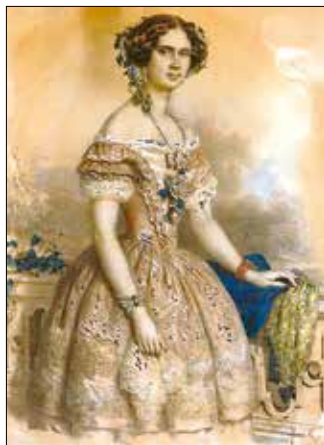
Laborfalvi Róza és Jókai Mór kalandos körülmények közt házasodott össze

Bár Jókai Mór Komáromban született, iskoláit pedig Komáromban, Pápán és Kecskeméten végezte, élete nagy részét – közel hatvan évet – a fővárosban töltötte. Ma már elválaszthatatlan a neve a magyar irodalom aranykorától, ám azt kevesen tudják, hogy közel húsz különböző lakcíme is volt Pesten és Budán.