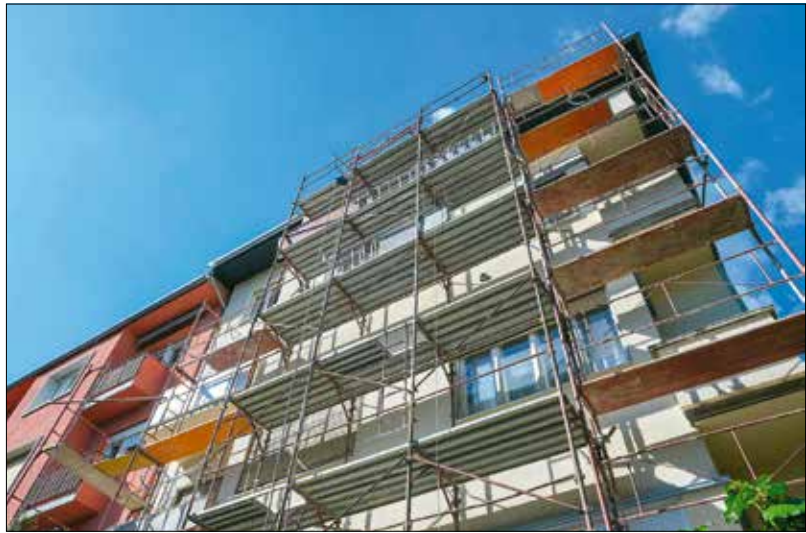
Társasház által végzett közös beruházáskor közgyűlési határozatot kell hozni

Amikor a beruházás egy nem védett és nem is védett épület közelében álló ingatlan érint (ez a leggyakoribb), akkor egy tervezői jogosultsággal rendelkező szakember által készített tervdol-