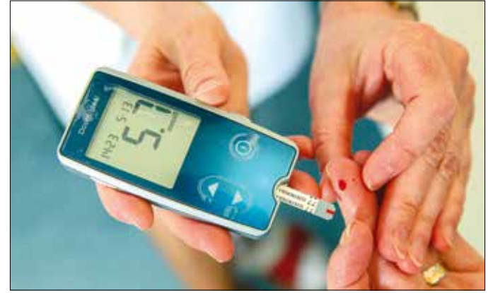
A megelőzés egyik módja a vércukorszint rendszeres mérése

Az éhomi vércukorszint akkor van igazán rendben, ha 5 mmol/liter alatt van. Ezt érdemes rend-