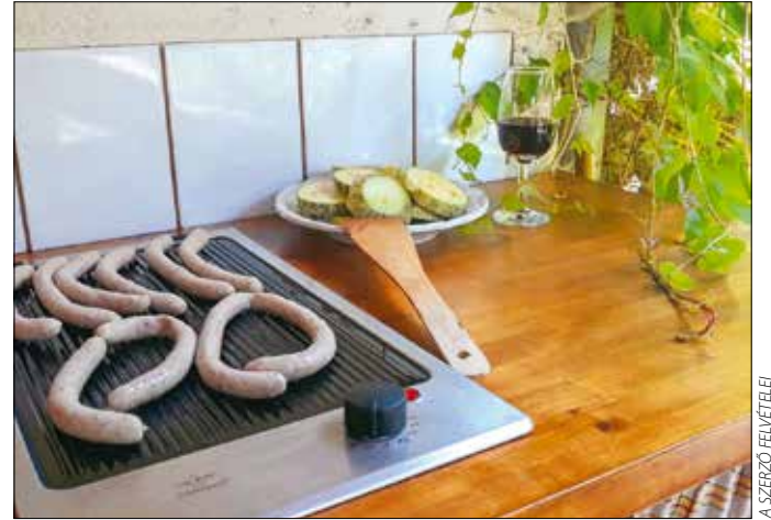
Grillezni lehet, csak vigyázzunk, hogy ne füstöljük tele a környéket!

Az utóbbi időben egyre keresettebbek lettek a logóval ellátott zsákok, így több viszonteladó partnernél hiánycikké váltak, leginkább a MOHU hulladékgyűjtő udvaraiba érdemes elbal-