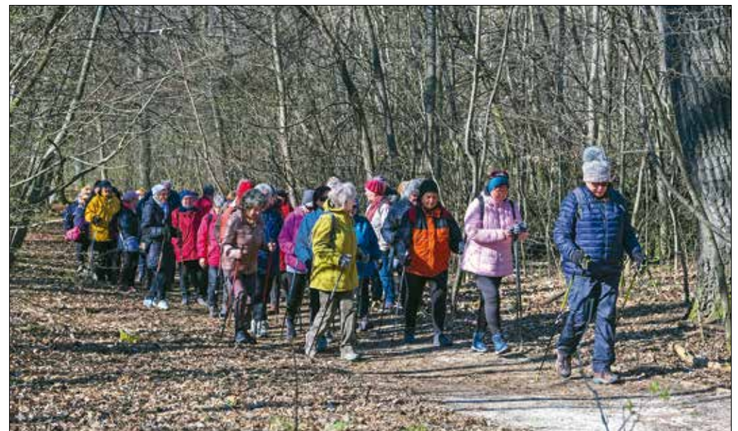
Séták, túrák, prevenció és rekreációs összejövetelek megvalósítására egyaránt pályázhatnak a közösségek

3 A zöld- és fenntarthatósági programok pályázatán a faültetéseket, nem társasházi területeken közösségi kertek létrehozását, közösségi komposztáló kialakítását, szemétszedő akciókat, továbbá állatvédelmi