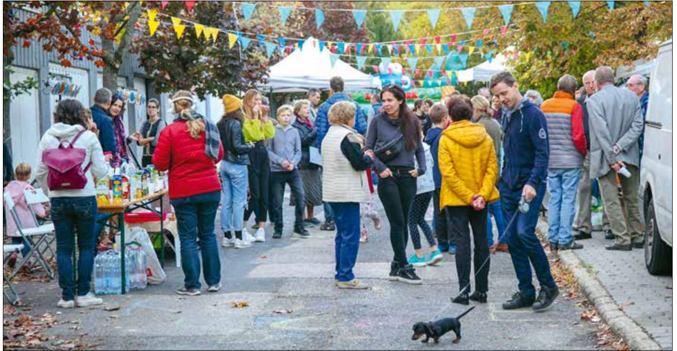
Az új pályázati rendszer alapvető célja a helyi közösségek erősítése – akár szomszédünnep szervezésére is lehet támogatást igényelni

„Alapvető változás, hogy eddig szervezeti forma alapján voltak elosztva a keretösszegek. Mi jobbnak láttuk, ha nem azt nézzük, ki milyen jogi formában működik, vagy miben hisz, hanem a programokat, eseményeket igyekszünk támogatni, attól függetlenül, hogy azokat ki szeretné megvalósítani” – mondta a kerület vezetője. Hozzátette, hogy nincs csak az egyházaknak dedikált támogatás – bár a 2. számú pályázatban a hitéleti tevékenységek is nevesítve vannak –, ugyanakkor a