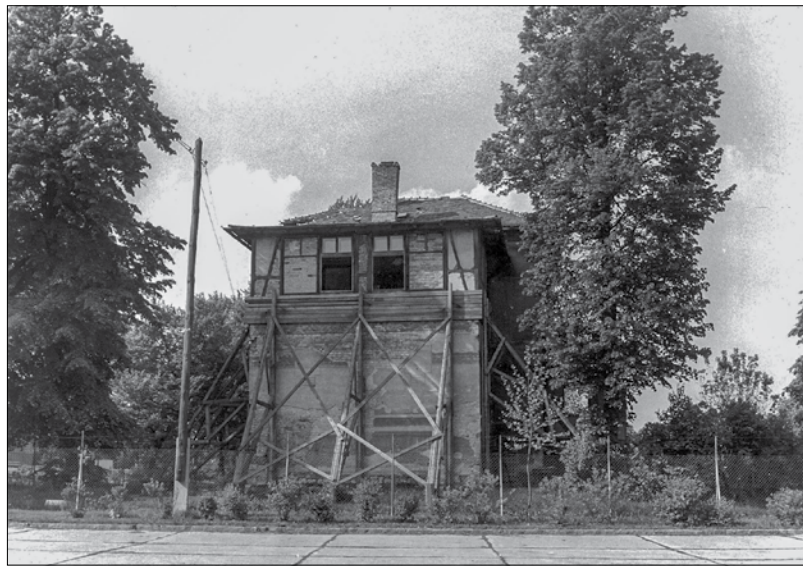
Ennyi maradt az Adliczer vendéglőből az 1970-es évek végére, amikor le is bontották

Petőfi ezután értesítette Jókai édesanyját, hogy fia egy nála nyolc évvel idősebb színésznőt készül feleségül venni. Jókayné és lánya, Eszter azonnal Pestre utaztak, hogy megakadályozzák az esküvőt. A legnagyobb érvük az volt, hogy Laborfalvi Rózának volt egy törvénytelen, tizenkét éves kislánya – amiről állítólag Jókai mit sem tudott. A hír hallatán az író megfogadta, hogy nem házasodik, de végül szerelmével együtt megszökött a Svábhegyre, arra a helyre, ahol az eljegyzésüket is tartották.