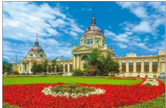
Három év alatt megújulhat a Széchenyi Gyógyfürdő

A Dunában is jó úszni. A fővárosi önkormányzat belépett az Úszható Városok Kartájába. A nemzetközi szervezet egyik célkitűzése, hogy népszerűsítse