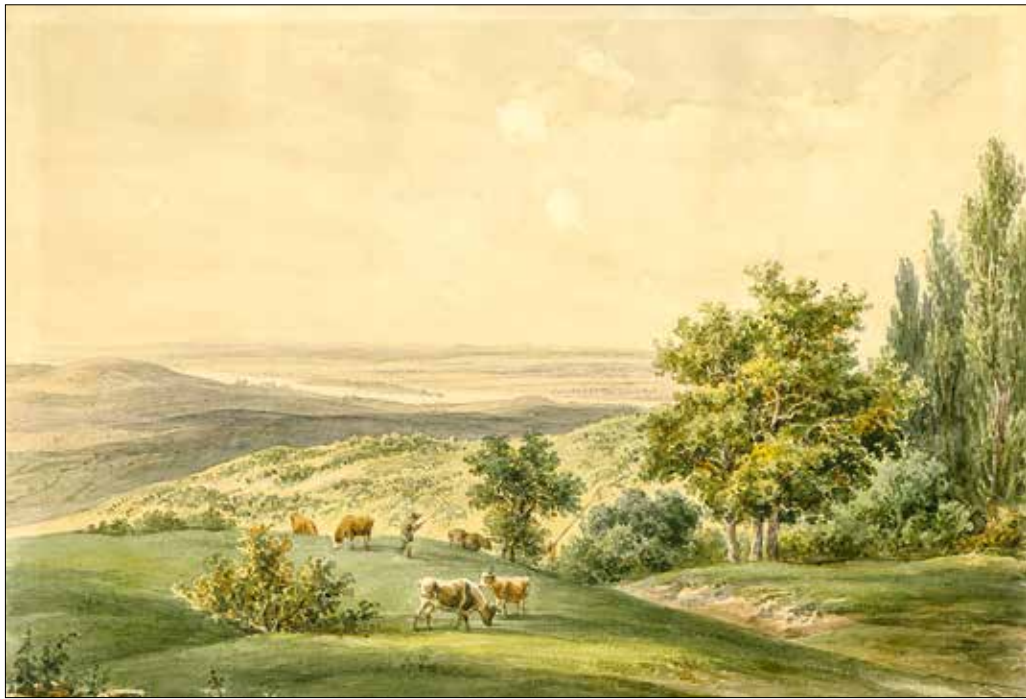
A Svábhegy az 1840-es években – nem csoda, hogy Jókai szinte első látásra beleszeretett a békés környékbe

Mintegy két hétig itt fogok maradni [...]”