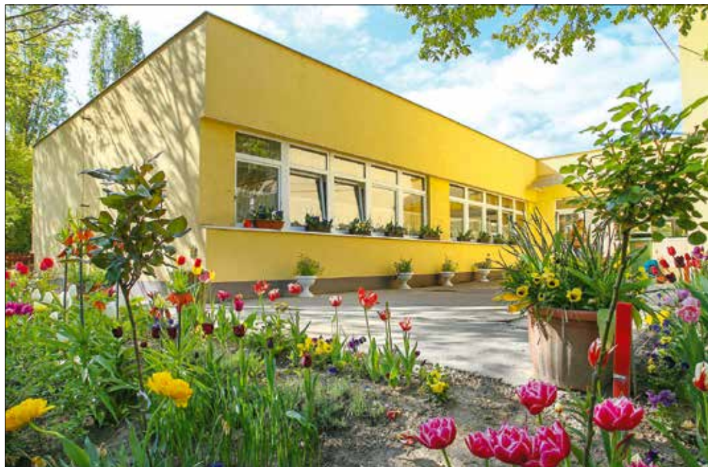
Jövedelmi helyzettől függően, sávosan emelkedik a bölcsődei térítési díj (képeinken a Zugligeti Bölcsőde)

• Hegyvidéki Közlöny néven, elektronikus formában, időszakszerűen megjelenő lapot alapított