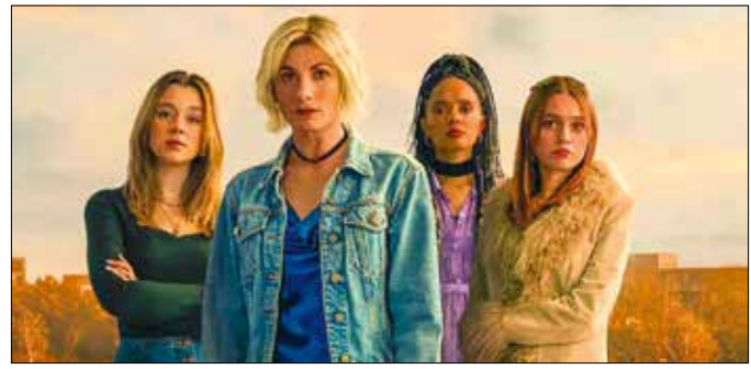
Mérgező város: kétségbeesett anyák a dölyfös hatalom ellen

Az édesanyák (Dávid) a bíróság előtt az út szélén hagyott közép-angliai ipari munkásságot is képviselik a corbyi önkormányzattal (Góliát) szemben – társadalmi drámává terebélyesítve a