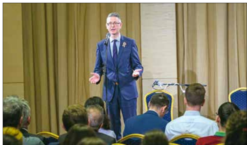
„Kollektív diákszín” volt március 15-e László Ferenc történész szerint

legvonzóbb mozzanata. Mint fogalmazott, „1848 egyszerre történelmünk magasztos pillanata, egy politikai akcióorozat hibátlan lebonyolítása, valamint egy nagy, kollektív diákszín, merthogy 1848. március 15-nek meglepően derűs, határozottan humoros volt a hangulata”.