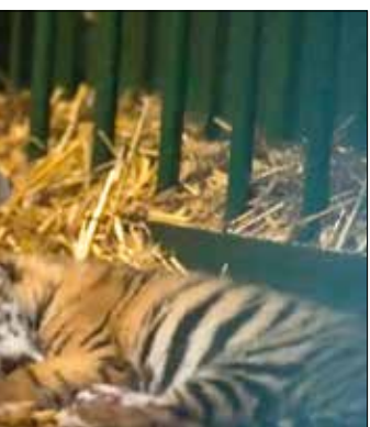
Várhatóan néhány hét múlva láthatja a tigriskölyköket a nagyközönség

sezon, ezért mostantól sűrűbben indul a 100E Repülőtéri Expressz járat, amely a hét minden napján éjjel-nappal közlekedik. A délelőtti és délutáni csúcsidőben hétfőn, pénteken és vasárnap 6 percnél, kedden, szerdán és csütörtökön az eddigi 7-8 helyett 6-7 percnél indulnak a buszok a végállomásokról. Szombatonként délelőtt 6-7, délután 7-8 perc a járatkövetési idő. A járat mindig a repülőtér nagyobb forgalmi irányához igazodik, a nap elején odafelé, késő este a belváros felé indul gyakrabban.