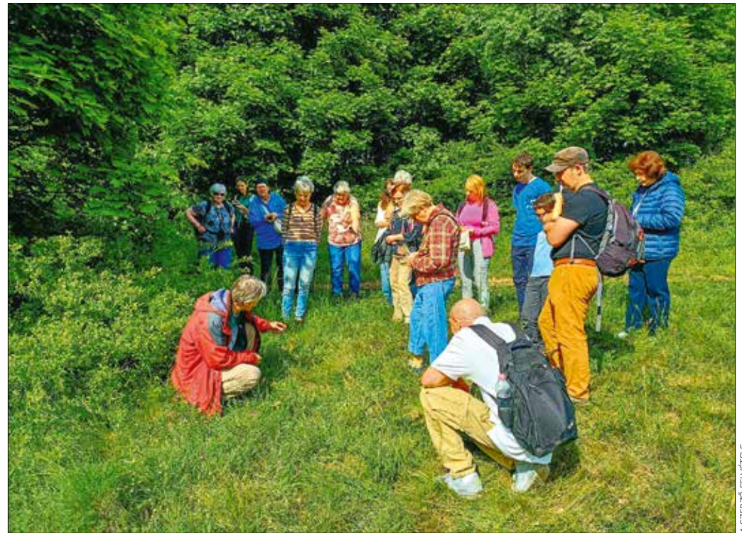
Egyre nagyobb szerepet kap a jövőben a környezeti nevelés, aminek részei a tematikus erdei séták

A fő prioritás a társadalmi és ökológiai közérdekűség, azaz a Hegyvidéken a „jó élet és jó közösségi lét” feltételeinek oly módon történő biztosítása mindenki számára, hogy annak hatásai ne lépjenek