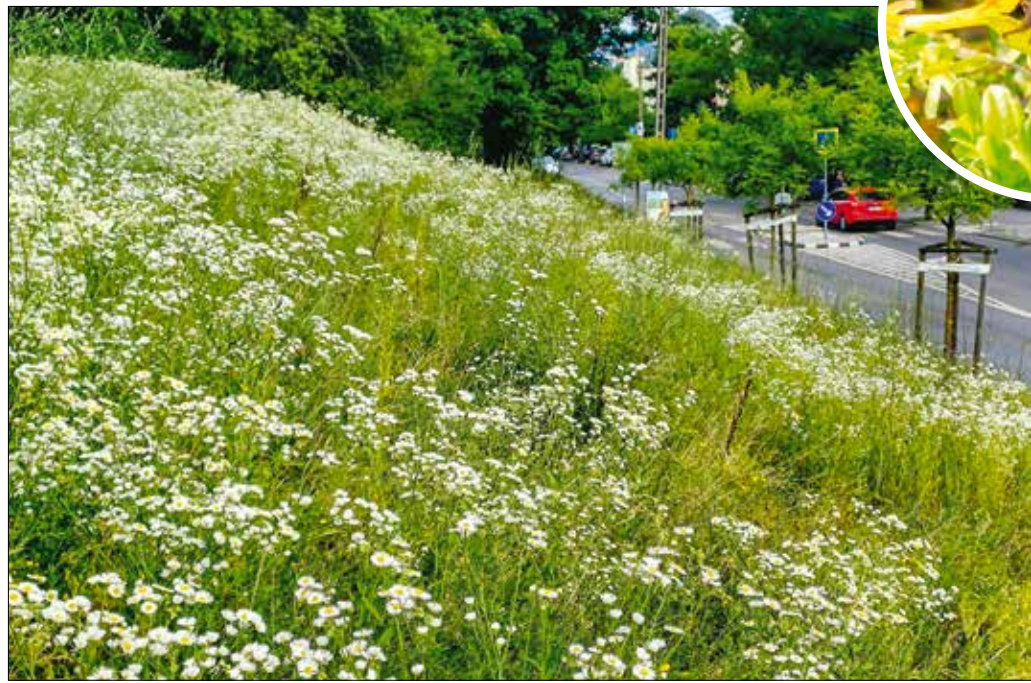
Seprecetenger az Istenhegyi részsűn, ahol mindig találnak táplálékot és bújóhelyet a rovarok

és Botanikai Intézet Lendület Ökoszisztéma-szolgáltatás Kutatócsoportja végezte el az elemzést.