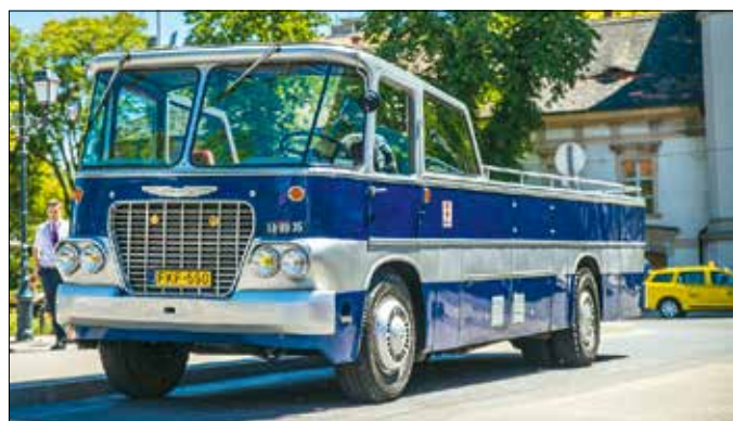
A kabrió Ikarus 630-ason is utazhatunk október végéig

ció egymillió forint produkciós támogatást nyújt a nyertesnek egy újabb bemutatójához. A közönségsvavazás további két helyezettje a Fidelio és a radiocafé médiacsomagját kapja. A szava-