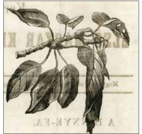
Az író rajza kedvenc gyümölcséről, a körtéről