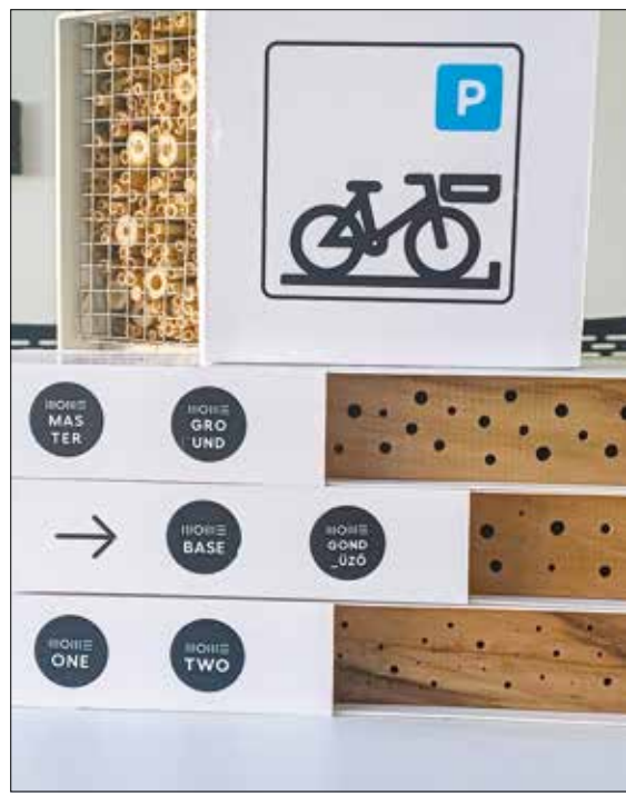
Rovarhotelek a MOME területén

A terepi felvételezés során 84 méh-, 14 zengőlégy- és 18 nappali lepkefaj mutatko-