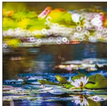
Bencze-Kovács György: Gernyeszegi tó II.

intenzív színekkel, nagy méretekben. Aztán egyre inkább a részletek felé fordultam, „csöndesebbek” lettek a képeim, azért is haladok annyira lassan. Az itt