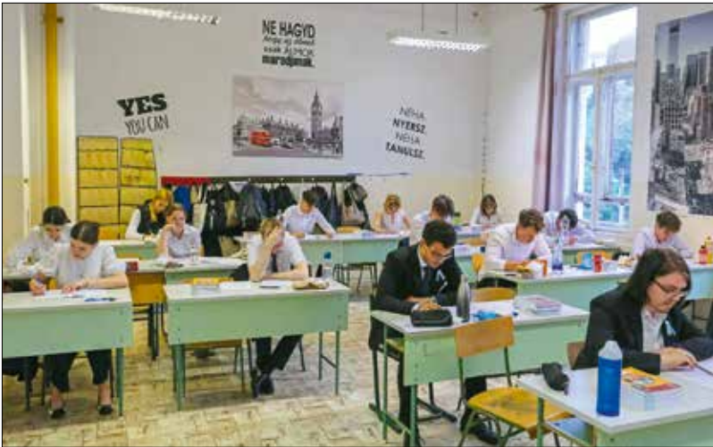
A középiskola befejezése előtt még maradt egy nagy feladat: az érettségi vizsga

– A diploma megszerzésénél, a továbbtanulásnál az is nagyon komoly kérdés, hogy milyen anya-