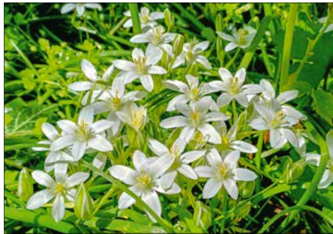
Messziről érezhető a sűrű virágszőnyeg illata, ami vonzza a beporzókat

Az ernyős sárma tudományos neve ( Ornithogalum umbellatum )