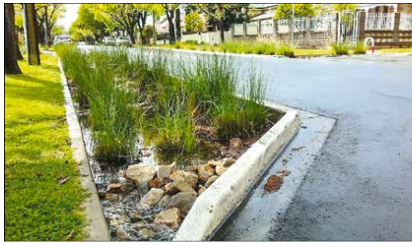
A csapadék helyben tartásának és hasznosításának fontos eleme az esőkert

A program koncepciójának meghatározása során a terv igazodik a Hegyvidék környezeti jövőképehez, amely szerint „a Hegyvidék Budapest