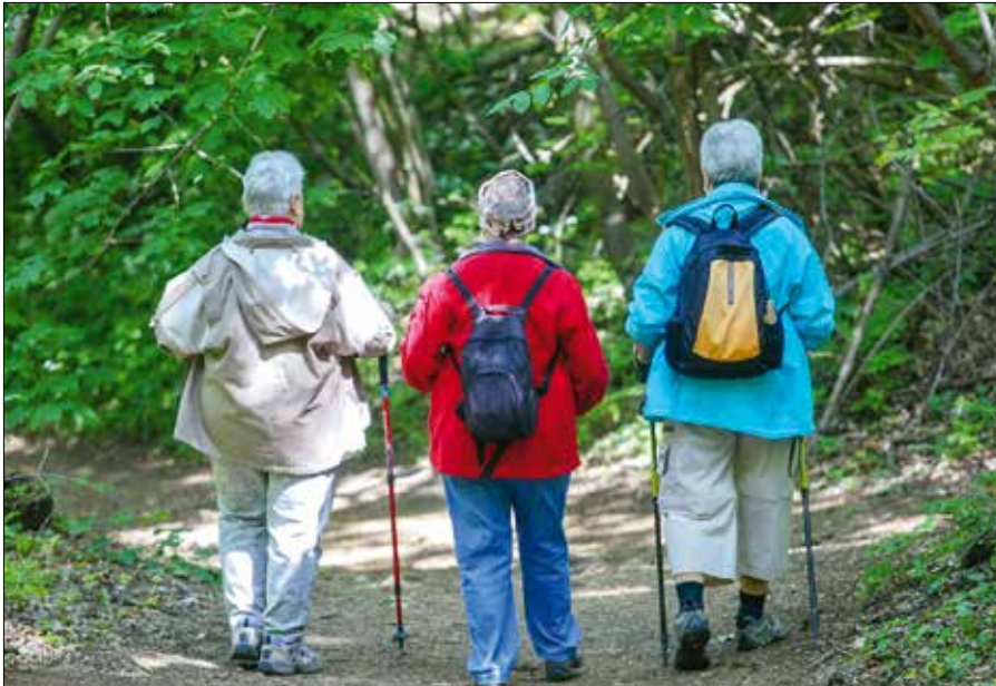
A legjobb orvosság a megelőzés: erősítsük az izmainkat, mozogjunk mindennap!

Ilyenek lehetnek a születési rendellenességek, mint az ó-láb, lehetnek a csípőficam is, de akár gyulladások is kiválthatják. Az autoimmun gyulladások közül a