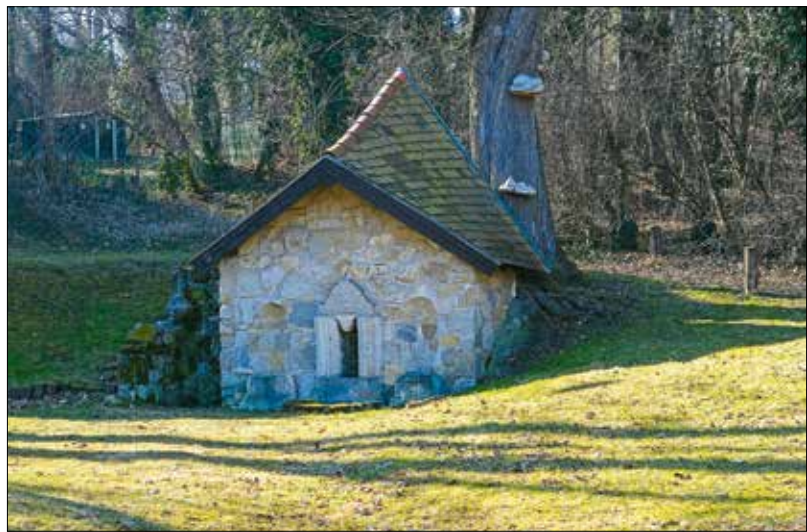
A tervek között szerepel egy kis tó kialakítása a Városkút forrsházának közelében

zeti jövőképéhez, továbbá a főváros környezeti és környezetvédelmi terveivel. Mindemellett reflektál a XII. kerület előző környezetvédelmi programjának hiányosságaira és a végrehajtás során összegyűjtött tapasztalatokra is.