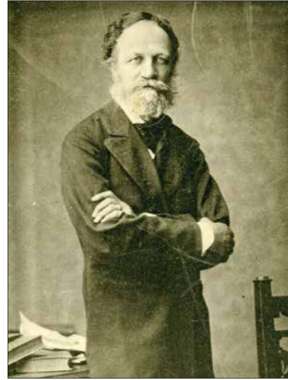
Jókai Mór 1883-ban

Másnap szélvihar volt, letört egy ágat, azzal megint két körteménység múlt el örökre. Most már csak öt volt. Jókai feltárogatta őket karókkal, hogy többet a szél kárt ne tehessen benne, de nagy buzgalomban a vállával letörte az egyik gyümölcsöt. Négy maradt. Ekkor már érni kezdtek. Egy reg-