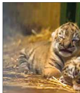
Várhatóan néhány hét múlva láthatja a tigriskölyköket a nagyközönség

Széll Kálmán tér metróállomás között közlekedő 139-es. A végállomásokról 20.00 óra után induló járatokon a járművezetők az utazás megkezdése előtt ellenőrzik a jegyeket és a bérleteket, így ki-