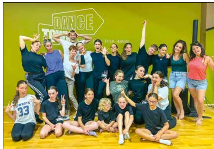
Vidám társaság jött össze, amelynek tagjai élvezik, amit csinálnak

gyon élvezzük a szülőiséget, ez még több lelkesedést ad, emellett persze sokkal elfoglaltabbak vagyunk, mint korábban: versenyek, fellépések a gyerekekkel, nyári intenzív kurzusok, rengeteg felkészülés, tervezés.