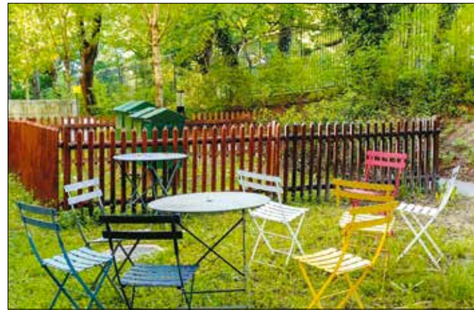
...szépen, organikus beépült az egyetem környezetébe

nemcsak megbarátokztak a közelben dolgozó méhekkel, de a szorgos rovarok elkezdtek organikus kapcsolatban az egyetemi oktatáshoz is. Az egyik diák például a digitális tárgyalgató tanterv keretében a kaptármérleg mérési eredményeiből hoz létre az adatok vizualizációját szolgáló, kerámianyomtatással készülő installációt.